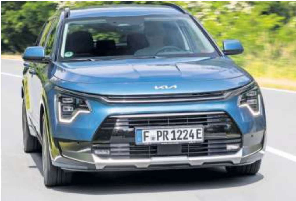
Das Niro-Design hat gegenüber dem Vorgänger deutlich gewonnen, der Kofferraum fasst mindestens 348 Liter, das Cockpit ist modern und intuitiv zu bedienen.

Der Plug-in-Hybrid galt bis vor Kurzem als Brückentechnologie ohne echte Zukunft. Doch mit dem Aus der staatlichen Förderung für E-Autos sind die Modelle attraktiver geworden. Wie der PHEV (Grundpreis ab 38.700 Euro). Im koreanischen Kompakt-SUV sind ein 77 kW/105 PS starker Vierzylinder-Benziner und ein E-Motor mit 62 kW/84 PS am Werk. Ergibt eine Systemleistung von 135 kW/183 PS. Die Kraftübertragung erfolgt über ein 6-Gang-Automatikgetriebe. Bis zu 65 km WLTP-Reichweite soll die 11,1-kWh-Batterie ermöglichen, wenn brav nachgeladen wird.