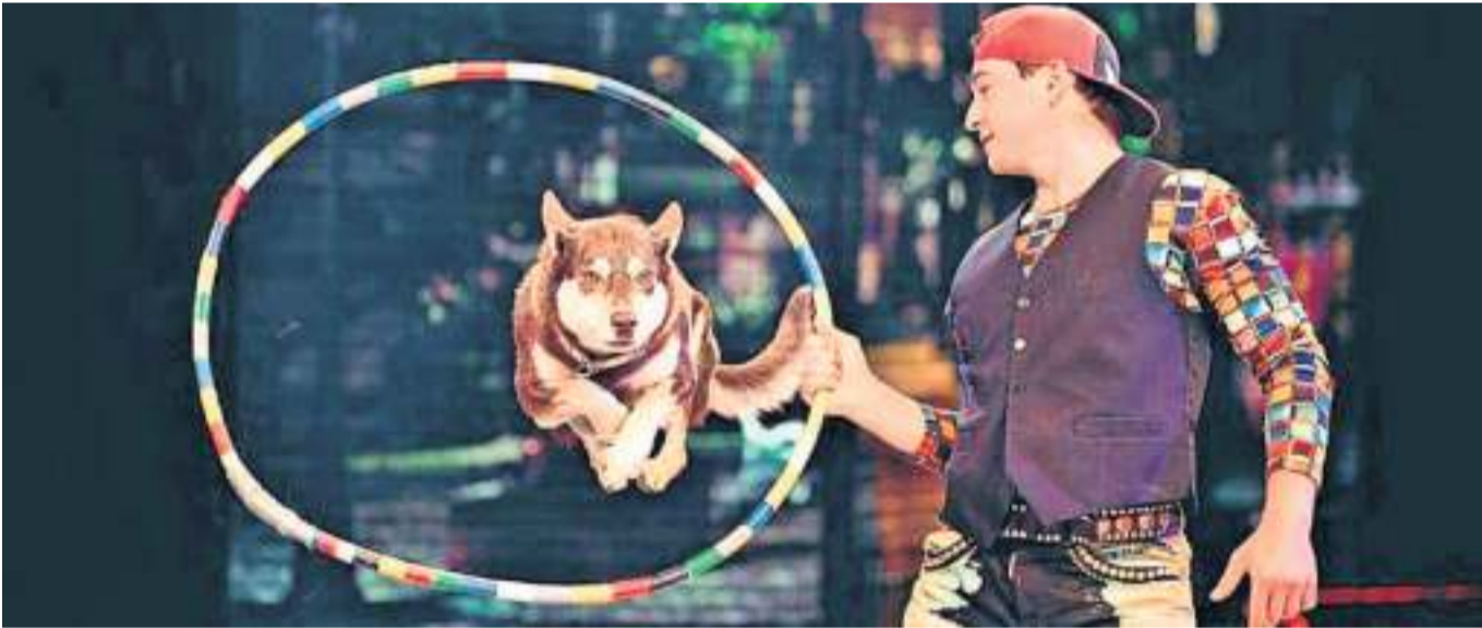
Die Artisten verzaubern beim Ostercircus in Bietigheim das Publikum.