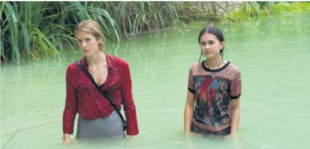
Der Film „Elaha“, eine Emanzipationsgeschichte, steht am Mittwoch, 3. April, im Orfeo auf dem Programm.

Am Weltfrauentag selbst, Freitag, 8. März, spielt das Theater im Polygon das Stück „Feminist*in“ von Linda Dorritke. Ein inter-