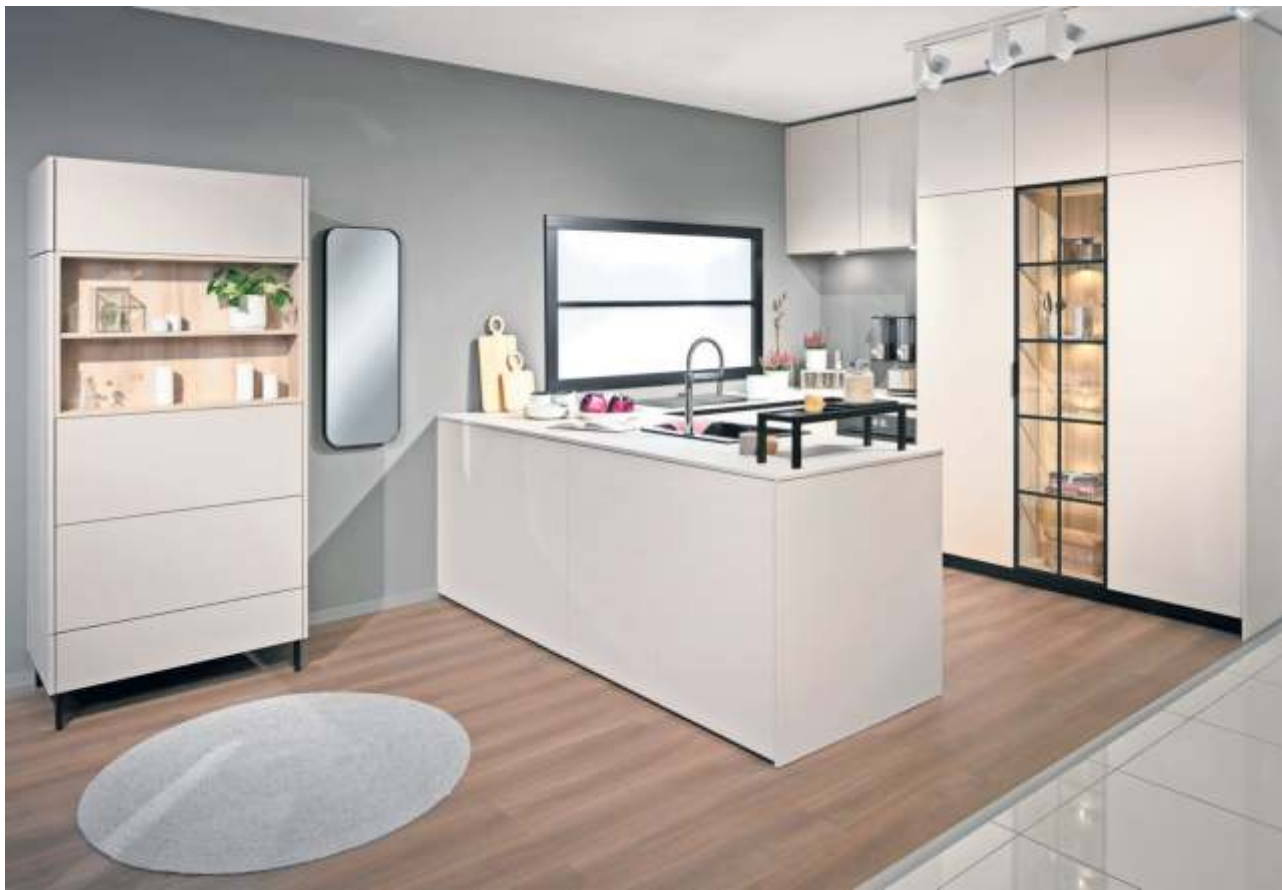
Diese hochwertige Küche in Resopal supermatt von Ballerina überzeugt durch klare, grifflose Optik.

Ebenfalls lohnend ist ein Blick auf das weitere Angebot des Schmidener Küchenstudios, das inzwischen weit über den Verkauf von Markenküchen und hochwertigen Einbaugeräten sowie deren Einbau durch ein hauseigenes Team von ausgebildeten Schreibern hinausgeht. Weil immer wieder zufriedene Kunden nach Hilfe bei der Umgestaltung weiterer Räume mit Badmöbeln, Garderoben und ähnlichen Einbauten angefragt haben, bietet das Schmidener Küchenstudio jetzt