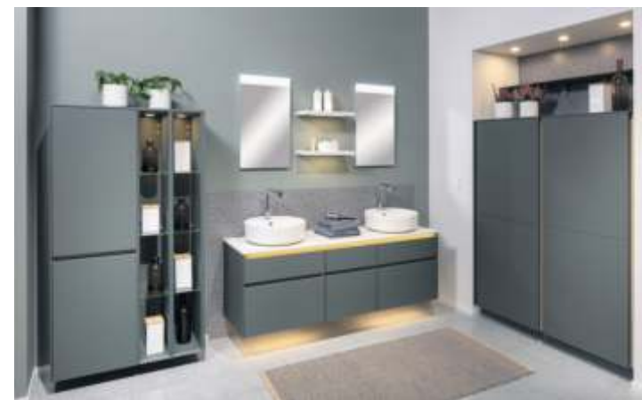
Ein Badezimmer von Nobilia mit runden Waschbecken.