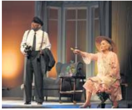
Bekannte Gesichter auf der Bühne der Schwabenlandhalle: Ron Williams und Doris Kunstmann

Atlanta, Georgia, 1948: Als die 72-jährige Witwe Miss Daisy ihren neuen Wagen in einen Garten setzt, stellt ihr Sohn Boolie gegen ihren Protest einen Chauffeur ein, den Afroamerikaner Hoke Coleburn. Zunächst weigert sich die resolute Dame hartnäckig, dessen Dienste in Anspruch zu nehmen. Doch mit Geduld und Gelassenheit schafft Hoke es, dass Miss Daisy schließlich zu ihm