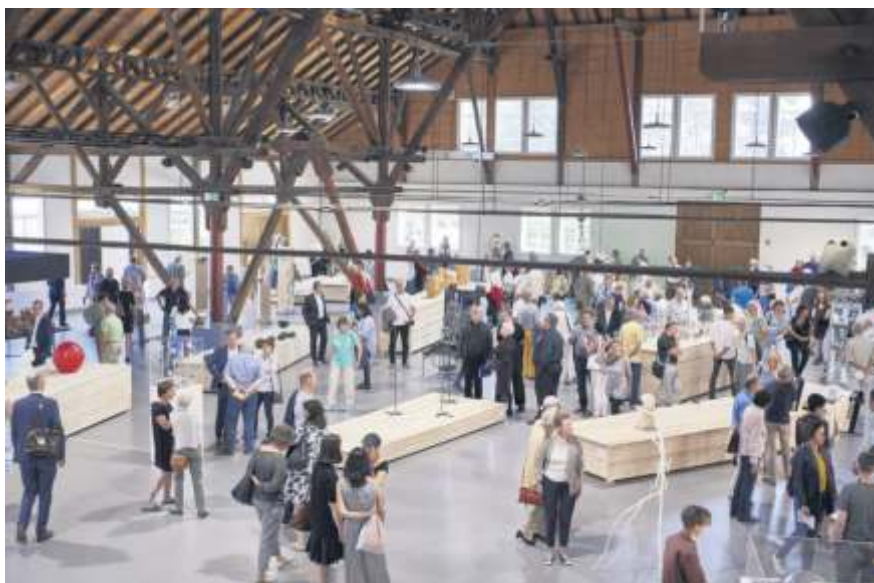
2025 findet die 16. Triennale Kleinplastik in der Alten Kelter statt..

Eine Anmeldung ist erwünscht, entweder unter Tel. 0711 5856 7660 oder per E-Mail an mozartstrasse@forum-fellbach.de .