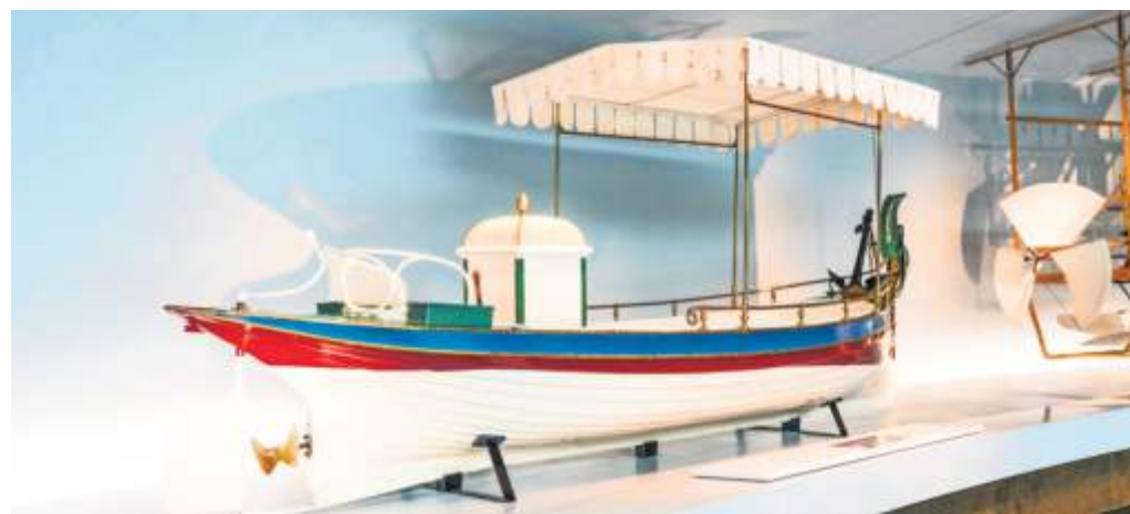
Das Daimler-Motorboot „Marie“ der Familie von Bismarck aus dem Jahr 1888: Das Prachtstück ist im Mercedes-Benz Museum im Raum Mythos 1: Pioniere – Die Erfindung des Automobils zu finden.