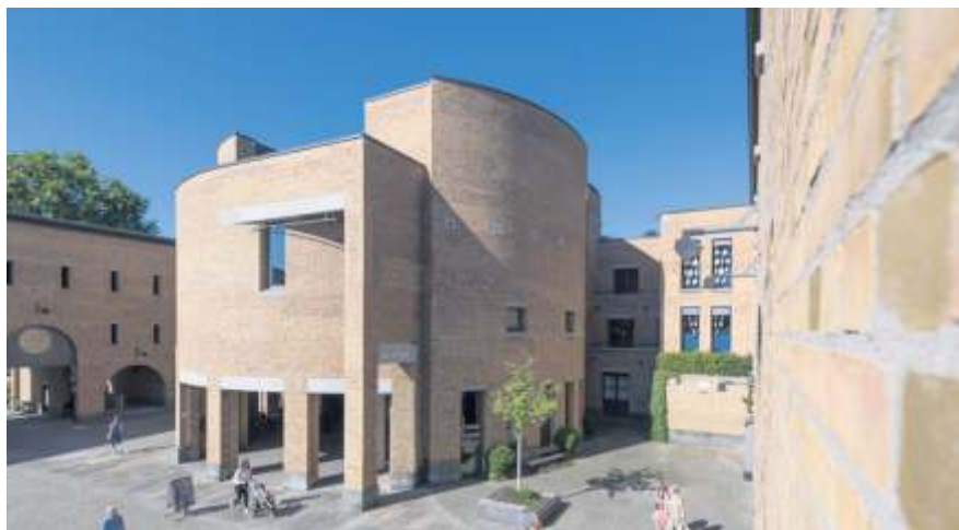
Ein klares Bekenntnis für Demokratie und Menschenrechte formulierte jetzt der Fellbacher Gemeinderat.

Weitere Infos: Die Erklärung des Bündnisses Demokratie und Menschenrechte ist nachzulesen auf der Webseite der Stadt unter www.fellbach.de/de/Aktuelles/Nachrichten .