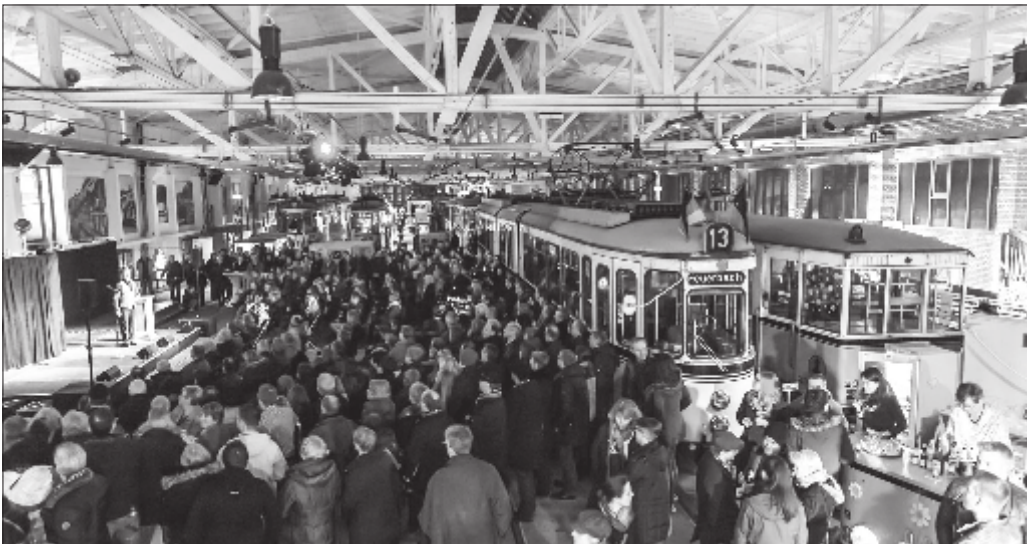
Im Straßenbahnmuseum wird es zur Langen Nacht der Museen kurzweilige Unterhaltung geben - von einem Magier, einer Live-Band und von Michael Gaedt.

Die Lange Nacht der Museen in Stuttgart findet dieses Jahr am Samstag, den 16. März 2024, statt. Mehr als 64 Museen, Galerien und weitere Kulturräume beteiligen sich. Mit dabei: das Straßenbahnmuseum im Veilbrunnenweg 3 in Bad Cannstatt. Das Straßenbahnmuseum nimmt mit abwechslungsreichem Programm von 19 bis 03.00 Uhr an der Veranstaltung teil (Tour Hafen; Haltestelle Nr. 7, Elwertstraße). Auf dem Programm stehen: – von 17.10 bis 0.55 Uhr, viertelstündliche Rundfahrten. Mit der Oldtimerlinie 21 geht es auf Tour über die Haltestellen Neckartor, Berliner Platz (Hohe Straße) und Hauptbahnhof. – von 19 bis 0.00 Uhr geht es alle 20 Minuten mit kurzweiligen Führungen quer durch die Ausstellung.