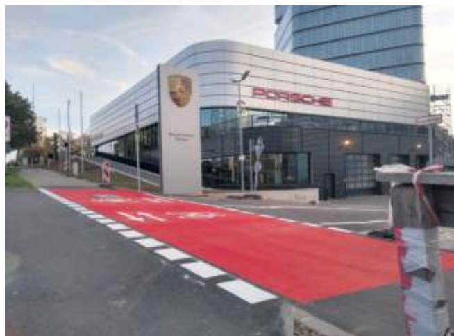
Beispiel für die Markierung einer roten Radverkehrsfurt in Stuttgart.

Bei Fragen zu den Maßnahmen gibt die Stabsstelle Radmobilität unter E-Mail radverkehr@fellbach.de gerne Auskunft.