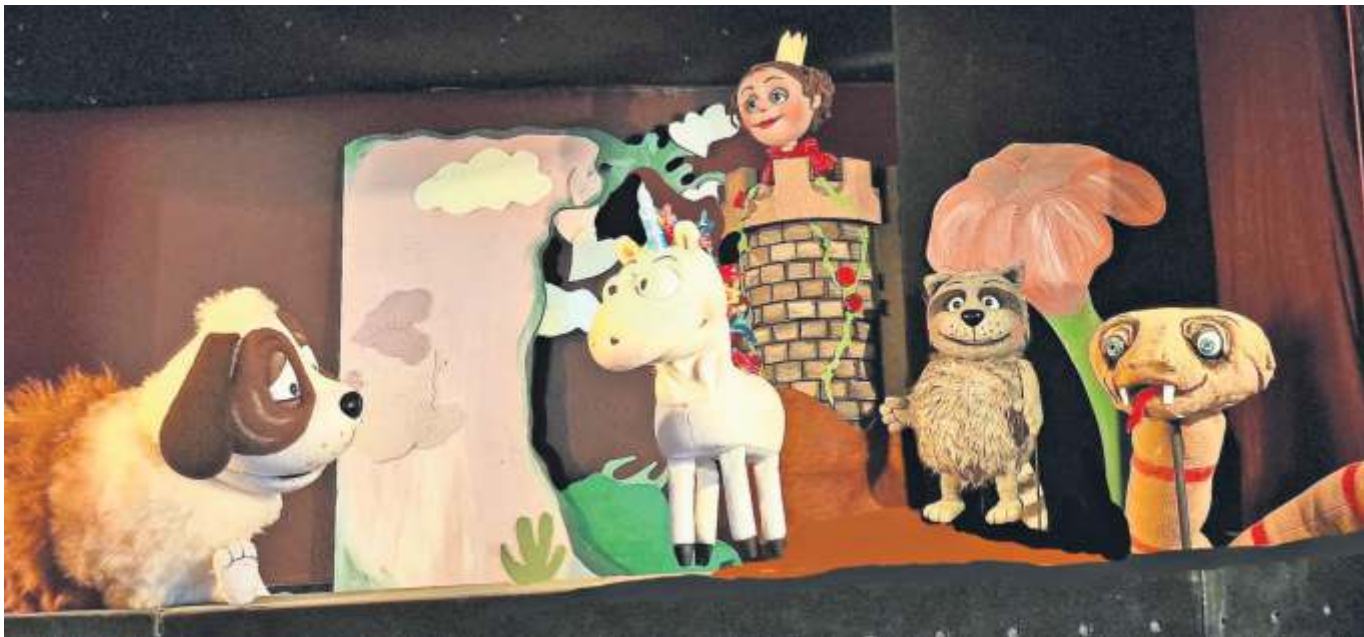
Der Na-Hund, das Nein-Horn und die Königs-Dochter – Figuren, die Marc-Uwe Kling erfunden hat – sorgen für gute Unterhaltung.

■ REMSTAL Syrah-Weine aus den Ländern Deutschland, Österreich und der Schweiz haben Juroren des Vinum-Magazins im Rahmen einer Sonderverkostung unter die Lupe genommen. Dabei zeigt sich, dass das Remstal auch bei dieser Sorte vorne mitspielt: 18 von 20 Punkten, und damit die zweithöchste Wertung im Wettbewerb, gehen an den 2018 Syrah trocken Barrique aus dem Weingut Dobler, Weinstadt-Beutelsbach. „Dunkle Beeren, in erhabener Intensität, auch k Reidig-erdige Noten. Ein Hauch Sauerkirsche und schwarze Oliven. Am Gaumen fruchtig, elegant und frisch, zeigt sich schwungvoll und sehr gekonnt gemacht. Viel Druck und viel Saft, eine gute Länge im Abgang“, urteilt die Fachjury. Das Weingut Heid, Fellbach, taucht in der Prämierungsliste gleich zweimal auf: Sehr gute Wertungen gibt es für den 2022er Syrah sowie für den 2021 Syrah Melchisedec trocken. Das Weingut Doreas punktet mit seinem 2020 Syrah „S“ trocken Grunbacher Bergalbe. red