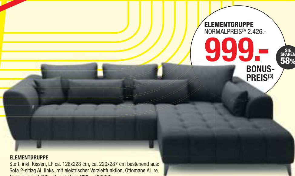
ELEMENTGRUPPE Stoff, inkl. Kissen, LF ca. 126x228 cm, ca. 220x287 cm bestehend aus: Sofa 2-sitzig AL links, mit elektrischer Vorziehfunktion, Ottomane AL re. Normalpreis 2.426,- Bonus-Preis 999,-, 208238

ZUSÄTZLICH AUF MÖBEL UND KÜCHEN + 19% MEHRWERTSTEUER GESCHENKT AUF DIE HOFMEISTER VORTEILSCARD (M)