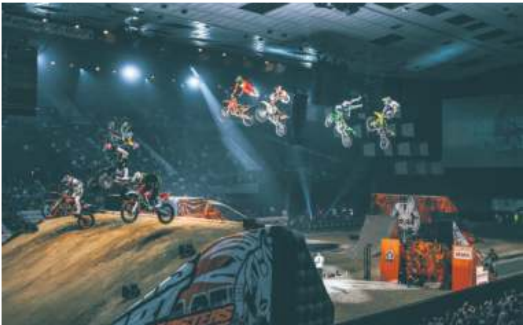
Ein Kader der weltweit besten Freestyle-Athleten präsentiert unglaubliche Stunts.

YouTube-Superstar Fabio Wibmer ist am 18. Februar beim verrückten Showspektakel der Motorradfahrer in der Schleyerhalle auch mit dabei.