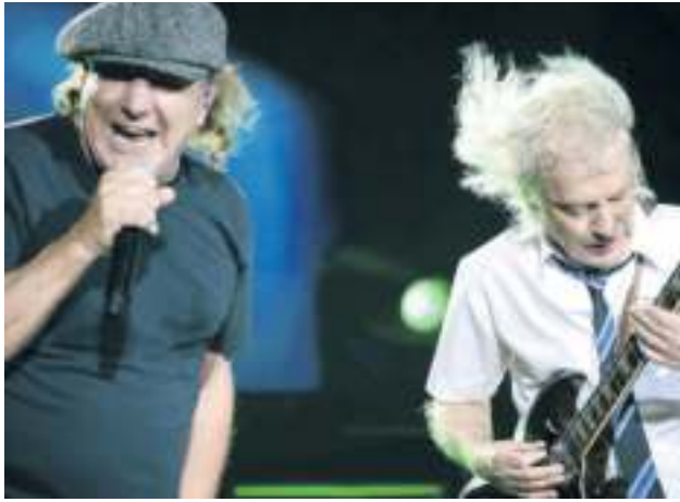
„Power-up“: AC/DC spielen am 17. Juli live auf dem Cannstatter Wasen!