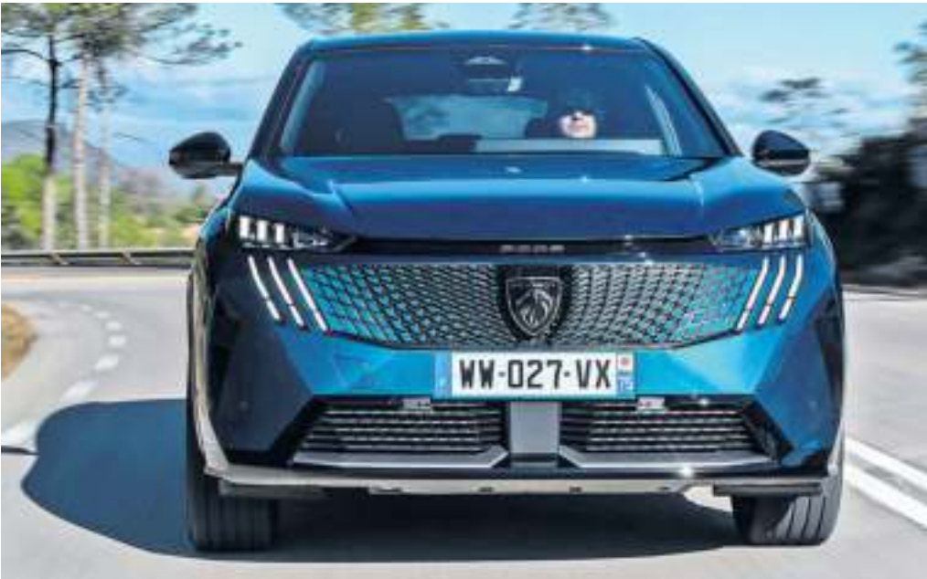
Design aus Frankreich: Die Gestaltung des Peugeot 3008 will Aufsehen erregen.

Dabei setzt die Löwenmarke auf ausgefallenes Design und avantgardistisches Ambiente. Auch die Technik ist auf Augenhöhe mit der Konkurrenz. Möglich macht das eine neue Plattform, bei der sich die Entwickler des Mutterkonzerns Stellantis nicht wie bislang auf die Verbrenner, sondern auf die Elektroantriebe fokussiert haben. Die Akkus sind größer als bisher und laden schneller. Die Motoren haben mehr