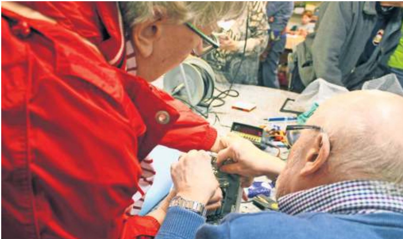
In Deutschland gibt es 900 Repair Cafés – bald auch eins in Stuttgart-Freiberg.