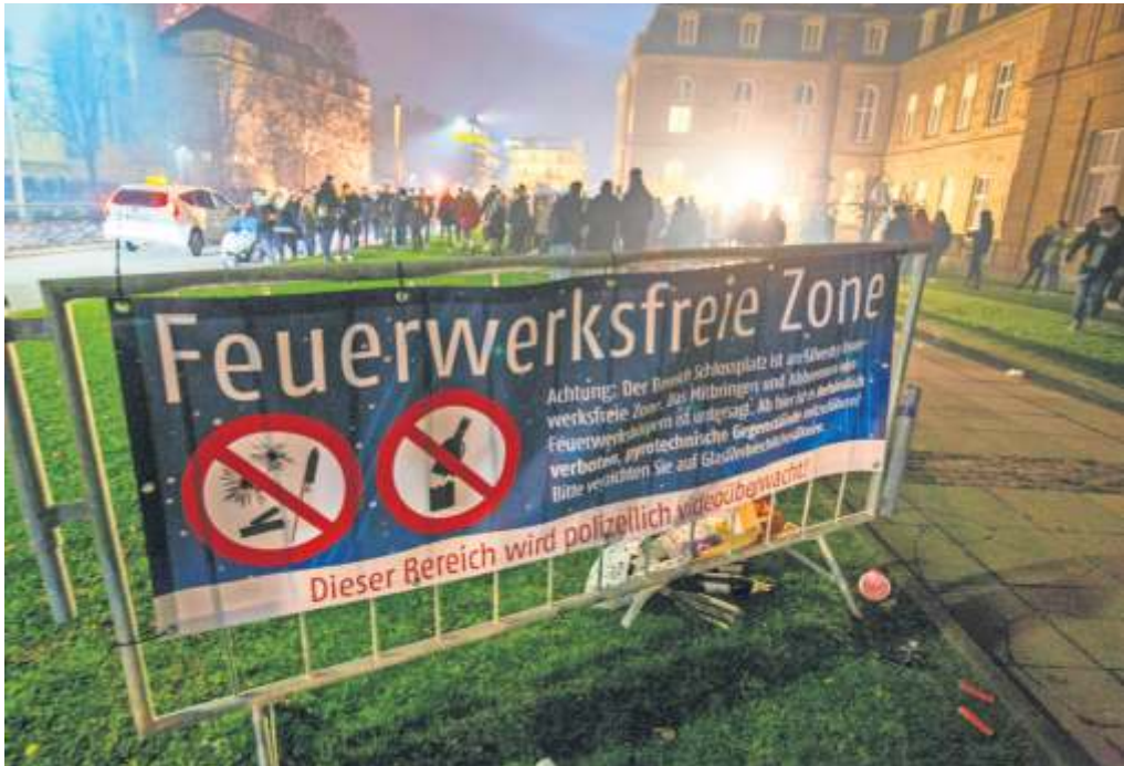
Innerhalb des Cityrings herrscht auch an diesem Silvester in der Innenstadt ein Feuerwerksverbot. Nur Wunderkerzen sind noch erlaubt.

erbsen, Brummkreisel oder Springteufel sind noch gestattet. Dennoch mitgebrachtes Feuerwerk wird beschlagnahmt und unbrauchbar gemacht. Außerdem drohen Platzverweise und Geldbußen – je nach Schwere des Verstoßes von 200 bis 5000 Euro, kündigt das Amt für öffentliche Ordnung an. Die Kontrollen nehmen Polizei und Sicherheitsdienste vor, insbesondere an den Durchlassstellen zum Schlossplatz.