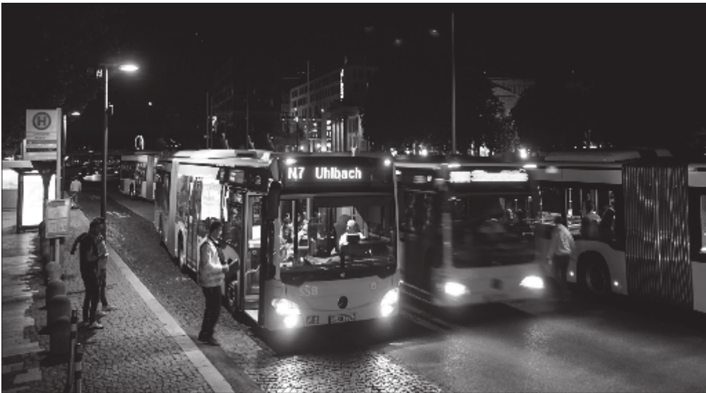
Die Nachtbusse fahren auch tief in der Nacht noch vom Schlossplatz aus los.

Die Stuttgarter Straßenbahnen AG wünschen Ihnen einen guten Start ins Jahr 2024. Damit er auch wirklich gelingt, steht Ihr Mobilitätsdienstleister zum Jahreswechsel wieder parat und bringt Sie zur Feier, zur Familie, zu Freunden und auch mitten in der Nacht wieder zurück.