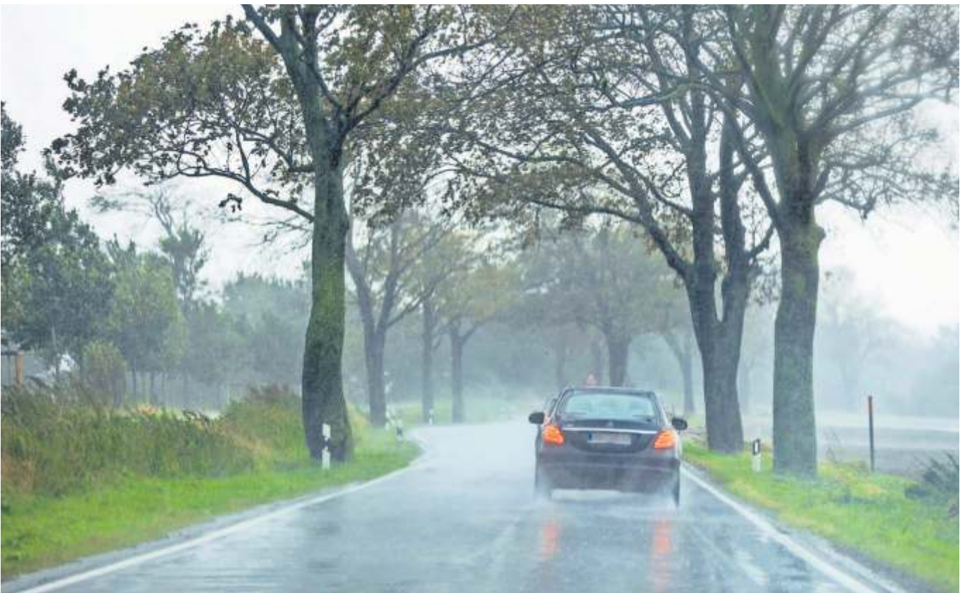
Bei starkem Wind sollten Autofahrer ihr Tempo drosseln und bei Böen gefühlvoll gegenlenken.

Tipp 1 Tempo drosseln, defensiv fahren, beide Hände ans Steuer: Erfasst eine Böe das Fahrzeug, kann man bei niedrigem Tempo erheblich einfacher reagieren und gegenlenken.