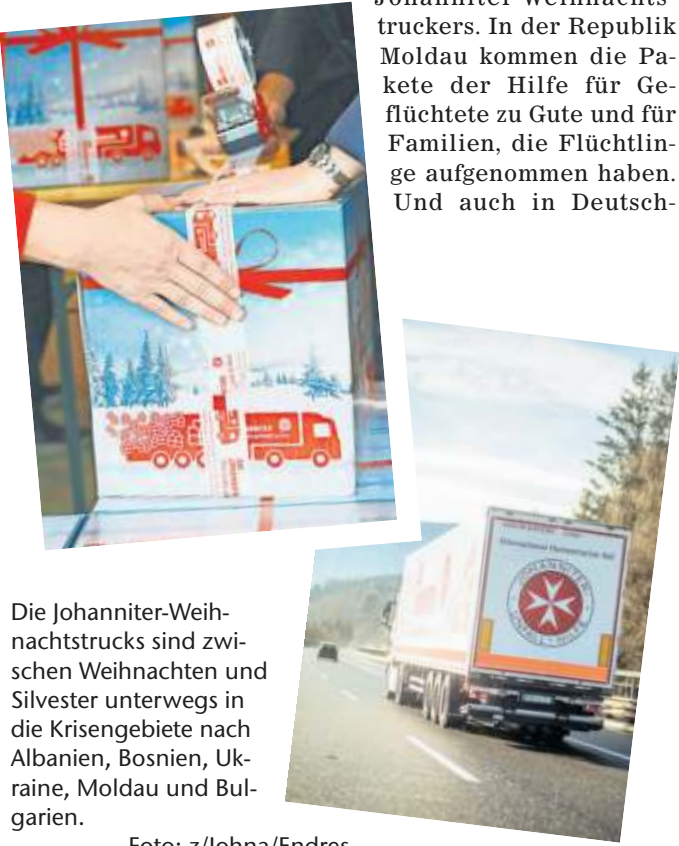
Die Johanniter-Weihnachtstrucks sind zwischen Weihnachten und Silvester unterwegs in die Krisengebiete nach Albanien, Bosnien, Ukraine, Moldau und Bulgarien.

Hilfe e.V.; IBAN: DE89 3702 0500 0004 3030 02; BIC: BFSWDE33XXX; Stichwort: Weihnachtstrucker. Oder virtuelle Päckchen packen direkt über die Spendenseite.