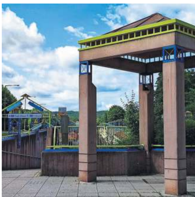
Die Haltestelle Rastatter Straße am Südrand von Weilimdorf wird im Volksmund „Legoland“ genannt.

Die Haltestelle „Pragsattel“ wurde 1990 im Vorfeld der Internationalen Gartenschau IGA 1993 neu errichtet. Verantwortlich zeichneten sich die Architekten Siedler & Fränkel zusammen mit dem Gartenarchitekten Miller. Eine mächtige natursteinverkleidete Stützmauer absorbiert den Lärm der nahen Bundesstraße. In Blickrichtung der Parkanlagen ist die tief liegende Haltestelle zwischen zwei Tunneln offen und mit viel Grün angebunden. Die Haltestelle setzte mit dem Materialmix von Naturstein und bunt gefassten Stahl-Glas-Konstruktionen eine zeittypische Gestaltungssprache fort, wie sie auch bei der Neuen Staatsgalerie 1984 eingesetzt wurde, heißt es seitens des LAD. Kennzeichnend sei die große gestalterische Sorgfalt bis ins Detail, etwa die Gestaltung der Leuchten, das