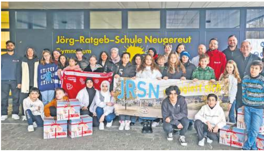
Lehrer und Schüler der Jörg-Ratgeb-Schule packten fleißig Päckchen für die Weihnachtstrucks der Johanniter.

Auch die Mitarbeitenden der Firma Svendsen GmbH Antriebstechnik aus Fellbach beteiligte sich voller Tatendrang an der humanitären Hilfsaktion. Zusammen mit deren Familien und der Johanniter-Hilfs-gemein-