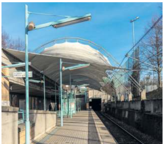
Die Haltestelle Waldau