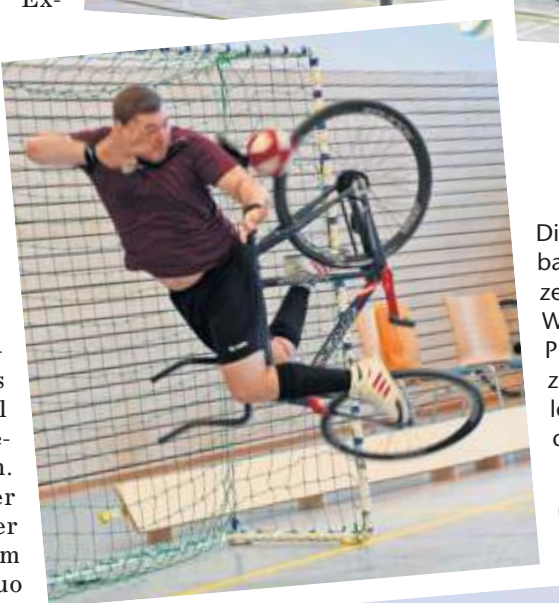
Die Weltelite der Radballer ist am 30. Dezember zu Gast in der Weilerhauhalle in Plattenhardt. Dann zeigen die Radkünstler, was sie alles draufhaben.