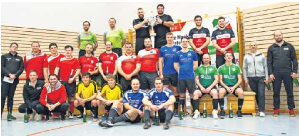
Die Teilnehmer (hier bei der Siegerehrung im vergangenen Jahr) geben wieder ihr Bestes und hoffen auf viele Zuschauer.