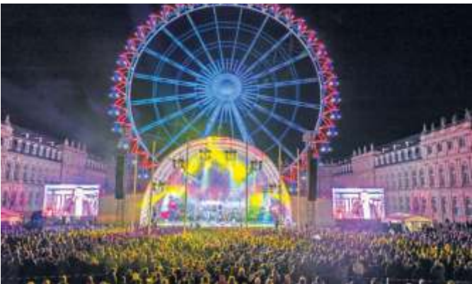
Auf dem Schlossplatz steigt wieder eine große Silvesterparty. Der gebürtige Stuttgarter Peter Schilling wird „Major Tom“ völlig losgelöst zum Besten geben.