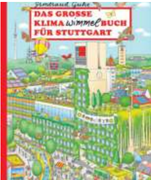
Jetzt neu erschienen: Das große Klima-Wimmel-Buch für Stuttgart.

ke liegt im Kühlschrank schon direkt neben der Flasche fürs Sekstrüstück. Ich freue mich wahnsinnig darauf, bald zusammen mit SWR3 Land aufzustehen.“ An seiner Seite wird die erfahrene Kollegin Rebekka de Buhr moderieren, die bislang bereits als News-Anchor Teil der Morningshow war.