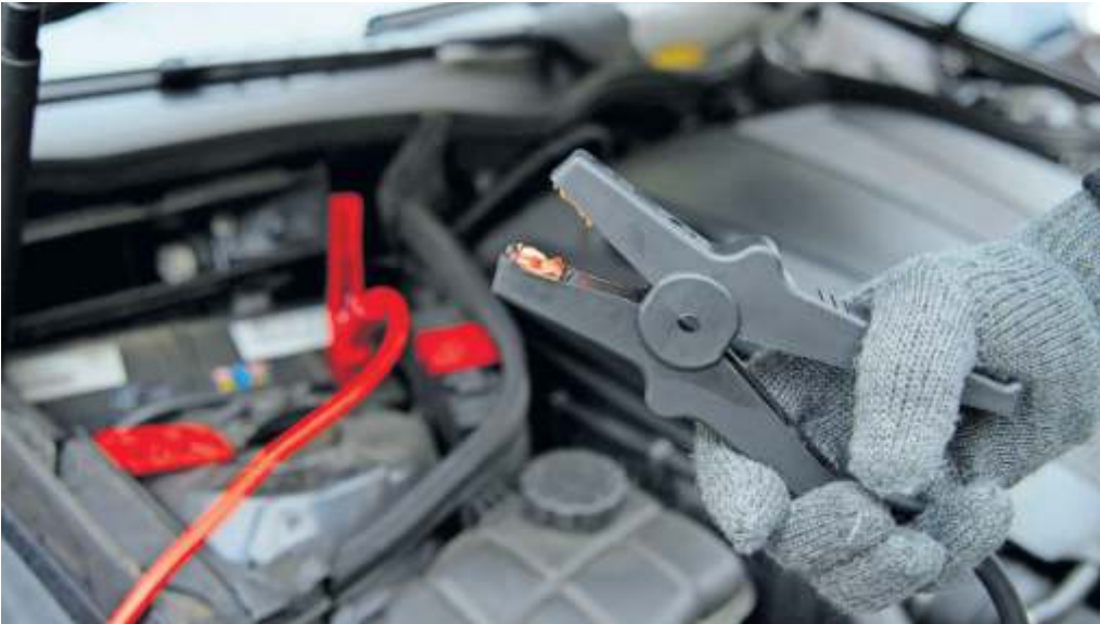
Energiespritze mit ordentlich Saft: Mit einem Starthilfekabel an Bord kann man sich bei schwacher Batterie bei anderen Hilfe holen oder selbst Starthilfe geben.

Wichtig: Die Zündung beider Autos muss zunächst aus sein. Dann werden die Plus-Pole der Batterien mit dem roten Plus-Kabel verbunden – erst am Spender- und dann am Empfänger-Fahrzeug. Dabei ist darauf zu achten, dass die rote Zange nicht aus Versehen mit anderen Metallteilen der Autos in Kontakt kommt. Ansonsten kann es zum Kurzschluss kommen. Als Nächstes verbinden Starthelfer das schwarze Kabel mit dem Minuspol der Spenderbatterie oder dem speziell da-