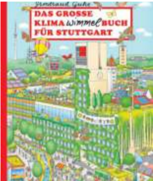
Jetzt neu erschienen: Das große Klima-Wimmel-Buch für Stuttgart.

ke liegt im Kühlschrank schon direkt neben der Flasche fürs Sekstrüstück. Ich freue mich wahnsinnig darauf, bald zusammen mit SWR3 Land aufzustehen.“ An seiner Seite wird die erfahrene Kollegin Rebekka de Buhr moderieren, die bislang bereits als News-Anchor Teil der Morningshow war.