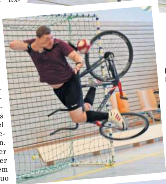
Die Weltelite der Radballer ist am 30. Dezember zu Gast in der Weilerhauhalle in Plattenhardt. Dann zeigen die Radkünstler, was sie alles draufhaben.