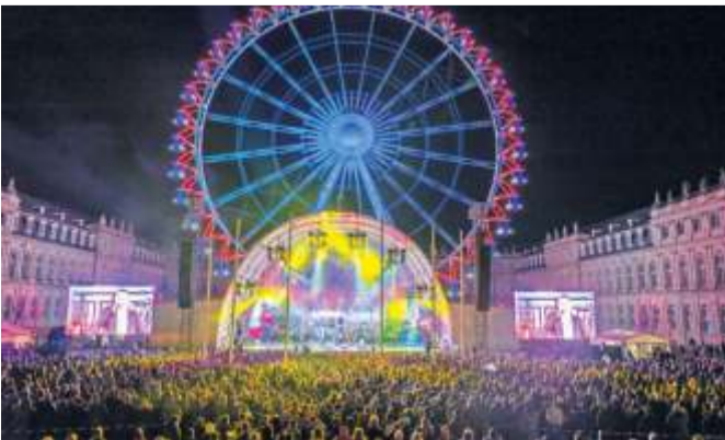
Auf dem Schlossplatz steigt wieder eine große Silvesterparty. Der gebürtige Stuttgarter Peter Schilling wird „Major Tom“ völlig losgelöst zum Besten geben.