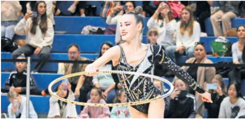
Am 6. Januar gastiert die TurnGala für die ganze Familie zweimal in der Porsche-Arena in Stuttgart – und mit dabei ist Darja Varfolomeev, die mehrfache Weltmeisterin vom Bundesstützpunkt für Rhythmische Sportgymnastik in Schmidlen und Zweitplatzierte bei der Wahl zu Deutschlands Sportlerin des Jahres.

■ STUTTGART Zweieinhalb Stunden hochkarätige, bewegte und bewegende Auftritte: Die TurnGala „Eternity“ des Schwäbischen Turnerbunds (STB) und des Badischen Turner-Bundes (BTB) tourt zwischen den Jahren, vom 28. Dezember bis zum 9. Januar, durch insgesamt zwölf Hallen in Baden-Württemberg. Am Samstag, 6. Januar, dem Dreikönigstag, gastiert die beliebte Show für die ganze Familie zweimal in der Porsche-Arena in Stuttgart – und mit dabei ist Darja Varfolomeev, die mehrfache Weltmeisterin vom Bundesstützpunkt für Rhythmische Sportgymnastik in Fellbach-Schmidlen und Zweitplatzierte bei der Wahl zu Deutschlands Sportlerin des Jahres. Die TurnGala des STB und BTB präsentiert jedes Jahr eine wechselnde und abwechslungsreiche Show für die Sinne mit internationalen Künstlern und einem atemberaubenden Mix aus Turnen, Akrobatik, Tanzen, Comedy, Entertainment und vielem mehr. Und immer haben auch regionale Gruppen ihre großen Auftritte. Zwölf Show-Acts entführen das Publikum in eine artistische Traumwelt mit Gänsehautmomenten. Die TurnGala 2023/24 erweckt Träume zum Leben und lässt die Artisten fliegen, schweben, tanzen und sich im Rhythmus der Trommeln bewegen. „Eternity“ ist einzigartig und erschafft inspirierende Traumwelten, visuelle Highlights und