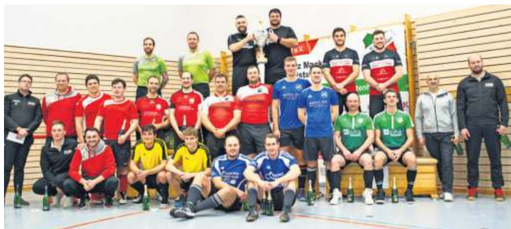
Die Teilnehmer (hier bei der Siegerehrung im vergangenen Jahr) geben wieder ihr Bestes und hoffen auf viele Zuschauer.