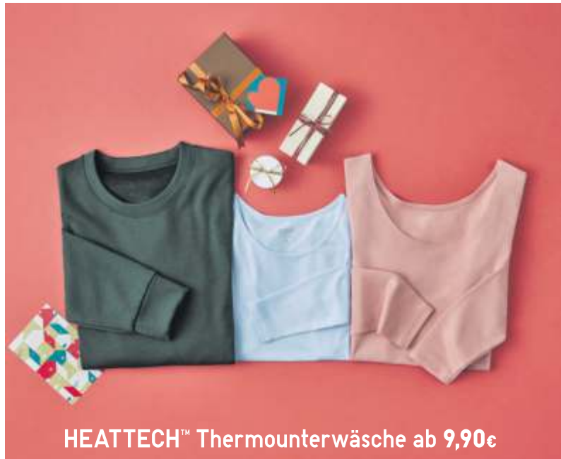
HEATTECH™ Thermounterwäsche ab 9,90€