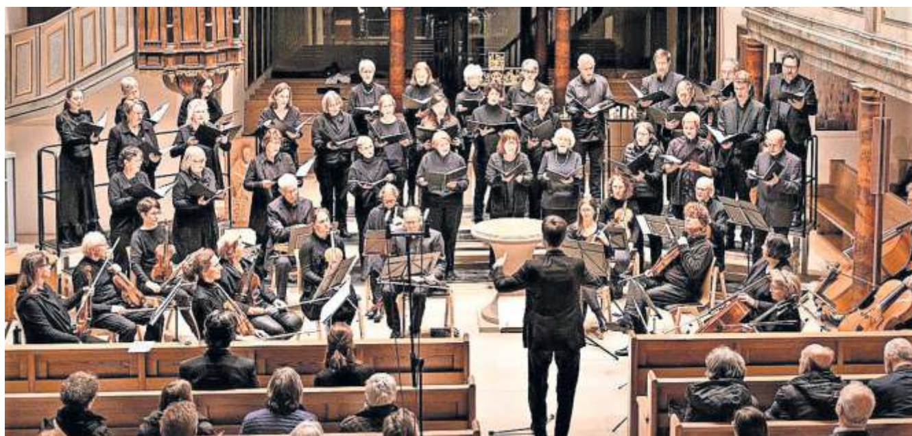
Auch die Kantorei Fellbach wirkt mit beim Konzert in der Lutherkirche