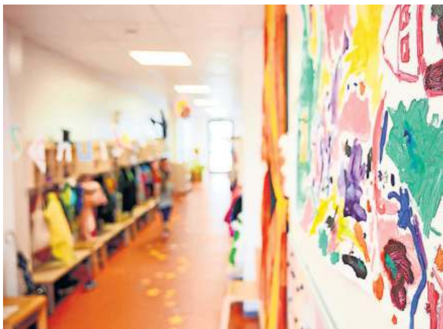
Der Betreuungsbedarf steigt in allen Stadtteilen.