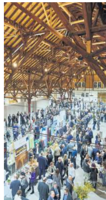
Fellbachs Alte Kelter wird im Februar wieder zum Treffpunkt für alle Weinliebhaber.

Der kommende Weintreff in der Alten Kelter Fellbach, Untertürkheimer Str. 33, findet statt am Samstag, 24. Februar und Sonntag, 25. Februar, jeweils 11 bis 18 Uhr. Der Eintrittspreis beträgt 25 Euro für das Tagesticket und 35 Euro für das Wochenendticket; enthalten ist jeweils ein Einkaufsgutschein sowie im Vorverkauf zusätzlich ein VVS-Kombiticket zur An-/Abreise mit den öffentli-