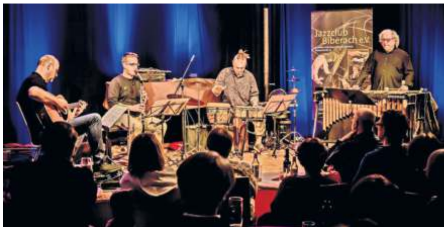
„Light Play“ sind zu Gast bei Soulfood in der Johanneskirche.

Karten gibt es im Vorverkauf im i-Punkt in Fellbach, im Lottolädle in Oeffingen oder im Pfarramt in Oeffingen, Tel. 0711 511219, E-Mail pfarramt.schmiden-oeffingen.johanneskirche@elkw.de .