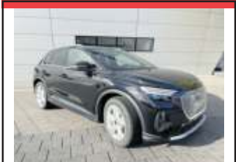
Q4 50 e-tron quattro - Neu o. Zul. 22% u. LNP + 3T€ Bafa möglich für 61,5T€ zvk, Tel: 07159920263

Wir kaufen Wohn-/Reisemobile aller Marken/Typen ☎ 0711-571 9142