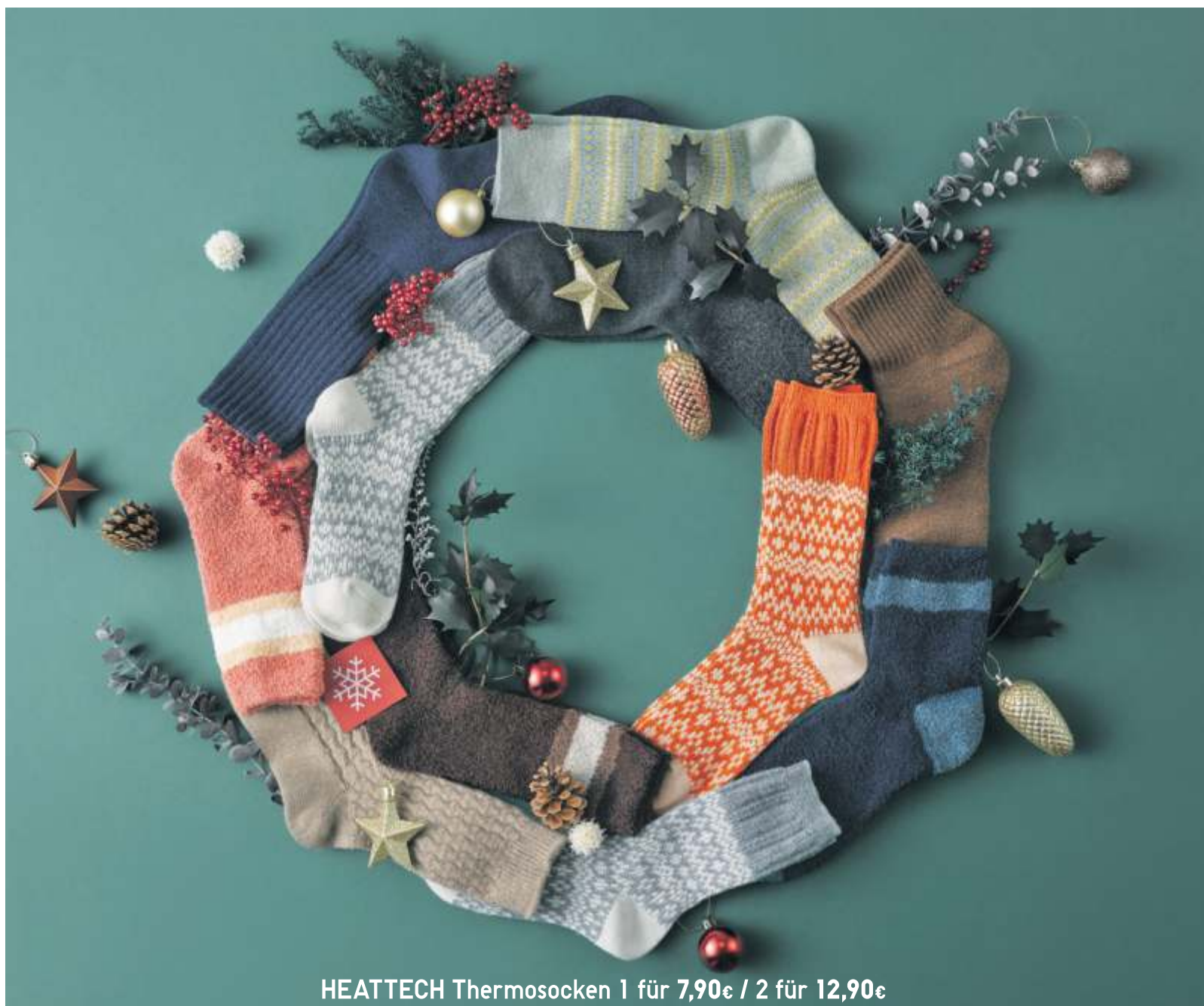
HEATTECH Thermosocken 1 für 7,90€ / 2 für 12,90€