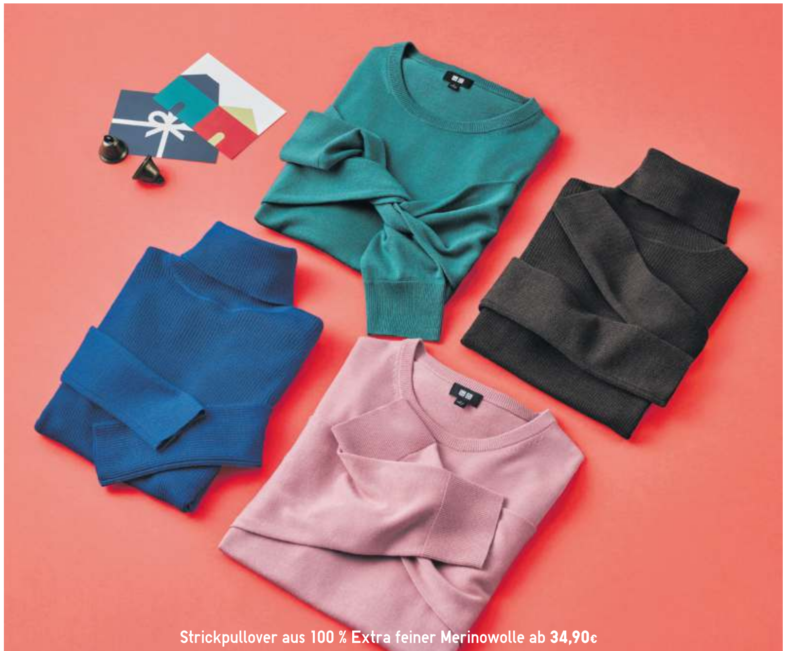
Strickpullover aus 100 % Extra feiner Merinowolle ab 34,90€