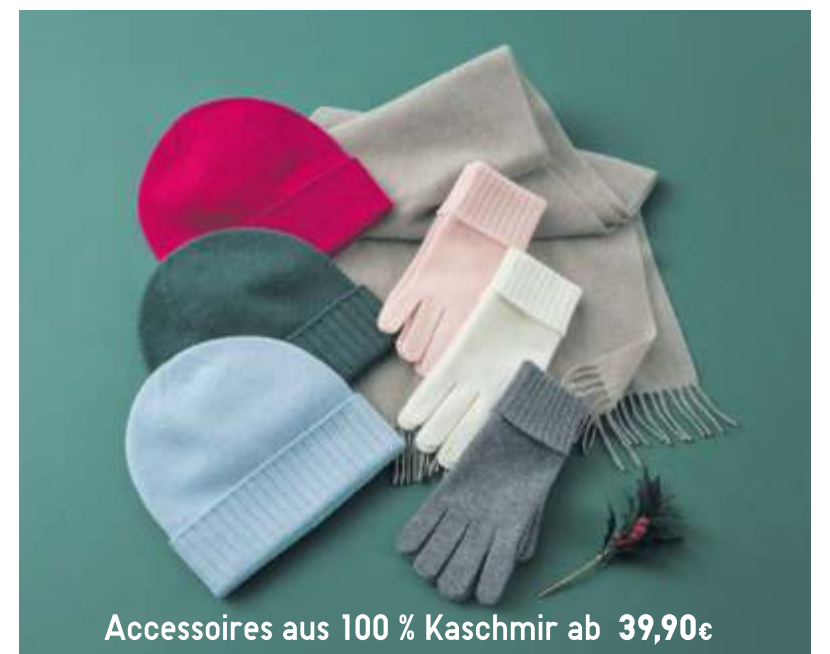
Accessoires aus 100 % Kaschmir ab 39,90€