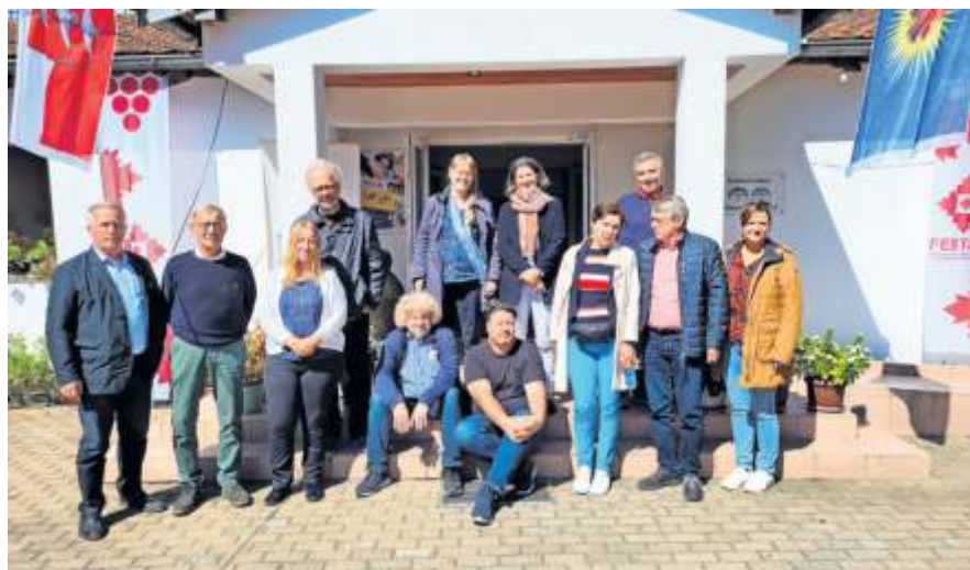
Im September besuchte eine Delegation aus Fellbach das Fellbach Haus und überzeugte sich von der guten Arbeit.