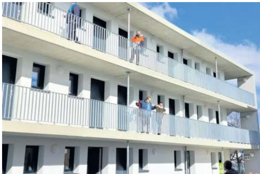
Im Frühjahr wurde das Projekt Wiesenäcker bezogen.

Die Beratungen mit den Bewohnern erfolgen in Form von Einzelterminen und werden zahlreich und dankend in Anspruch genommen. Bewerbertraining im gemeinschaftlichen Computerraum der Unterkunft, Vermittlungen zur Suchtberatung oder Planungen von beruflichen Umschulungen sind einige Dienstleistungen, die die Sozialarbeiter ko-