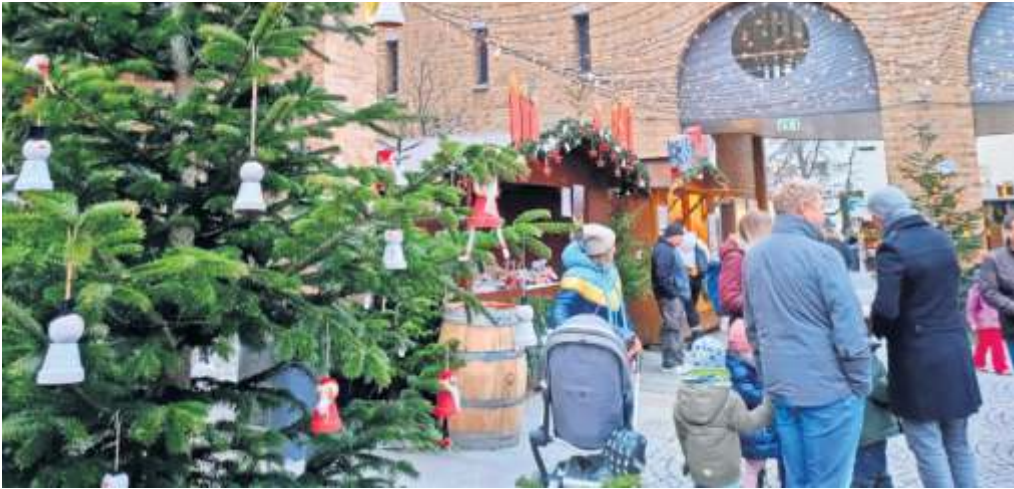
Ein Sternenhimmel und von Schülern geschmückte Tannenbäume sorgen rund ums Rathaus und die Lutherkirche in Fellbach für besonderes Flair.

dort jeweils eine Sequenz aus dem Märchen „Waldfest“ von Gustav Heick angehört werden. Das Märchenzelt wurde dieses Jahr nicht mehr aufgeschlagen, dafür gibt es erstmals in den Räumen des ehemaligen Restaurants „Roter Hirsch“ das, in dem Fall, wetterfeste „Kinderparadies“, wo jeden Tag – außer donnerstags – immer um 16.30 Uhr Märchen vorgelesen werden. Diens- tags und donnerstags gibt es Theatervorführungen und die Kids dürfen basteln. Am Wochenende ist dann auf der Weihnachtsmarktbühne im Schaugarten Programm für die ganze Familie etwas geboten. Vor dem i-Punkt zieht eine kleine Eisenbahn ihre Runden, kleine Kinder erfreue. Als „Wechselzone“ bezeichnet die Stadt den Bereich, den sie Richtung alten Friedhof eingerichtet hat, für lo-