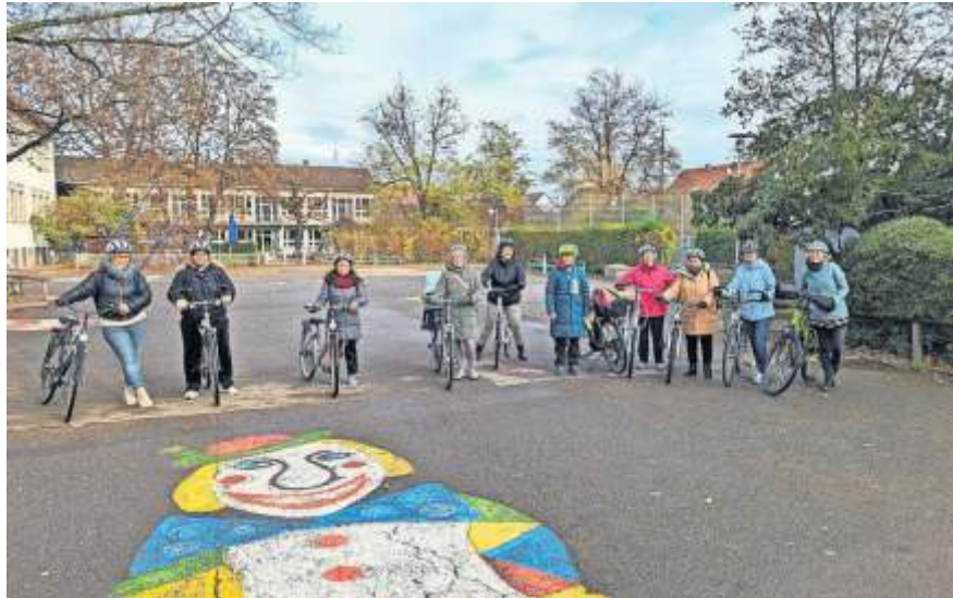
Auch eine gemeinsame Fahrradtour stand auf dem Programm.

Am Anfang des Kurses standen Übungen zur Verbesserung des Gleichgewichts und der Stabilität auf dem Programm. Danach folgten