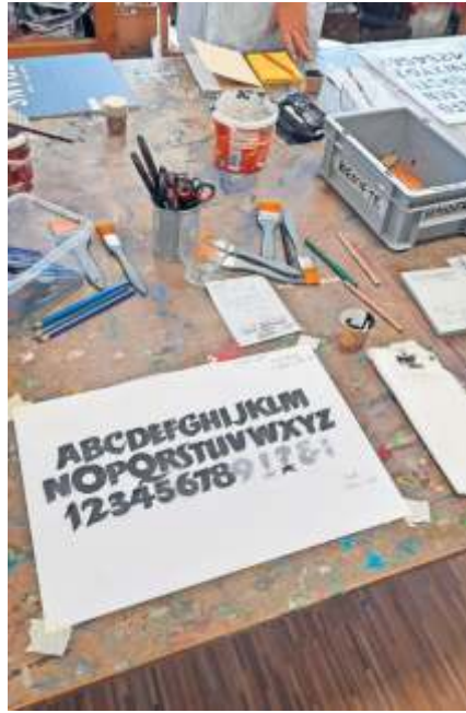
Die Bilderbuchkinder zeigen ihre Bücher und Hefte.

Die Kinder haben in der wöchentlich 3,5 Zeitstunden umfassenden außerschulischen, für alle Teilnehmenden kostenlosen Startphase intensiv mit bildenden Künstlern gearbeitet, um eigene Geschichten zu entwickeln und diese zu bebildern