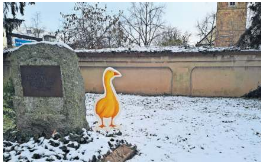
Auch die Goldene Gans versteckt sich auf dem Alten Friedhof.

andere, sind im alten Friedhof versteckt und laden die kleinen Besucher dazu ein, auf Schatzsuche zu gehen. Wie viele fabelhafte Figuren es genau gibt, können Neugierige auf der Website www.fellbach.de/weihnachten herausfinden. Hinter