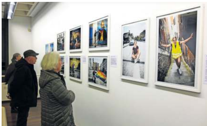
Reportagen aus dem Magazin MUT zeigt die Galerie.