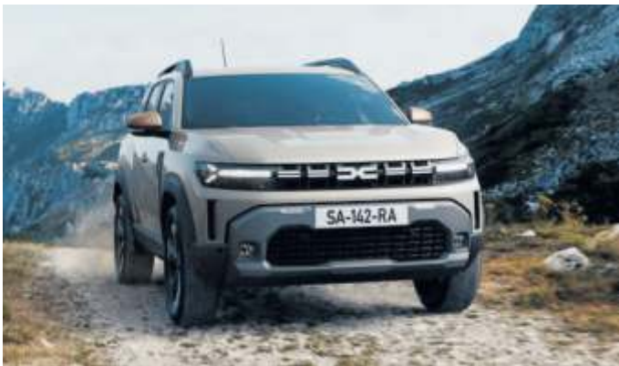
Dacia Duster: mehr Platz und neue Motoren.

Wegen genauer Einstellung zum Fachmann Steht das Auto dann mit der Nase zur Wand, erscheinen dort Standlicht, Abblendlicht und etwas höher das Fernlicht. Bei neueren Autos sind so bei nicht zu viel Sonne auch die Tagfahrleuchten zu erkennen, die mit der Zündung automatisch eingeschaltet werden. Die Nebelscheinwerfer lassen sich nur aktivieren, wenn wenigstens Standlicht oder Abblendlicht an sind. Ihre Leuchtpunkte erscheinen meist unterhalb der Hauptscheinwerfer. Ist ein Licht deutlich zu hoch oder niedrig eingestellt, kann das ein Laie zwar an sehr schlechter Sicht auf der Straße erkennen. Ob die genaue Einstellung den rechtlichen Bestimmungen entspricht, können nur Fachleute in der Werkstatt prüfen. dpa