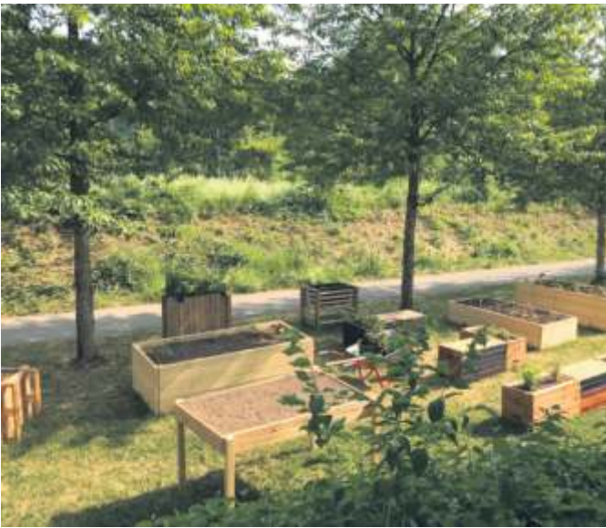
Insgesamt soll der Bürgergarten zu einem besonderen urbanen Gartenprojekt werden und Teil des MitMachGartens Fasanenhof werden, der im Mai 2023 am Wohncafé Ehrlichweg entstand.

■ FASANENHOF Der seit 2007 bestehende Bürgergarten auf dem Fasanenhof ist in die Jahre gekommen. Sanierungsarbeiten und vor allen Dingen ein neues Konzept sind dringend nötig, da offenes Feuer gerade in den zuletzt sehr heißen und trockenen Sommer nicht mehr möglich war. Der Bürgergarten Fasanenhof wurde im September 2007 mit einem Bürgerfest eröffnet. Mit ihm erfüllte sich ein lang gehegter Wunsch der Fasanenhofer: Ein großer Garten, der sowohl alle Voraussetzungen für nachbarschaftliche Geselligkeit bietet wie auch die Möglichkeit zum Ausspannen im Grünen. Der Bürgergarten ist ein Ergebnis der Bürgerbeteiligung des Programms „Soziale Stadt“, das zwischen 2003 und 2013 auf dem Fasanenhof einiges veränderte, vieles erneuerte und so den Stadtteil positiv weiterentwickelte. Inzwischen befinden sich die beiden Natursteingrills in bedauerlichem Zustand. Wegen hoher Temperaturen und Trockenheit waren sie in den Sommermonaten sogar gesperrt. Ebenso der Sitzbereich, da die Sonnendächer erneuert werden