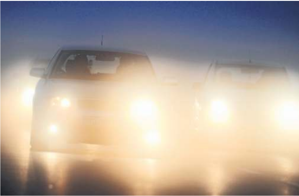
Laut einem aktuellen Test sind viele Autos mit mangelhaftem Licht unterwegs.

Beleuchtung selbst checken Nicht nur zur dunklen Jahreszeit sollten daher alle Autofahrerinnen und