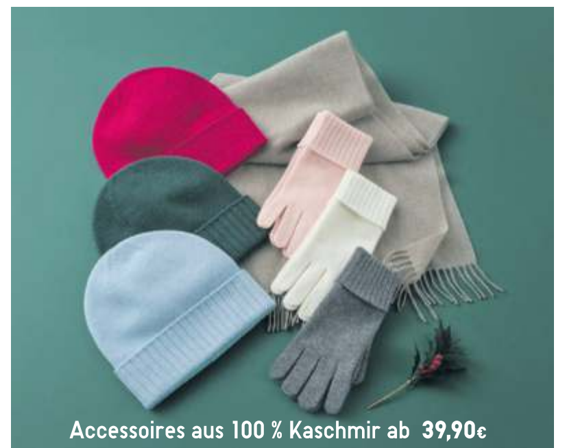
Accessoires aus 100 % Kaschmir ab 39,90€