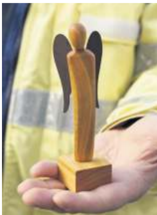
Künftig kommt die Notfallseelsorge mit himmlischem Beistand. Die Engel spenden Trost.

Bei der Notfallseelsorge Stuttgart arbeiten sowohl haupt- als auch ehrenamtliche Notfallseelsorger. Sie bleiben, wenn die anderen Einsatzkräfte wieder weg sind, und halten mit den Angehörigen die schrecklichen Nachrichten aus. Im Rahmen einer zweijährigen Ausbildung auseinander“, sagt die 34-Jährige und erinnert