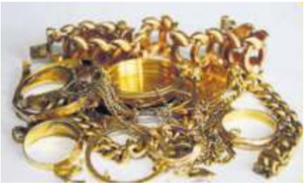
Altgold und Bruchgold

IHRE SERIÖSE ADRESSE IM GROSSRAUM STUTTGART