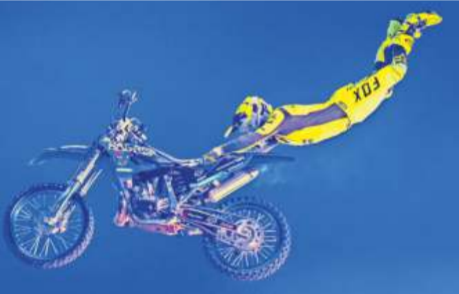
Erstmals fliegen rasende Motorräder hoch unter dem Zeltdach.