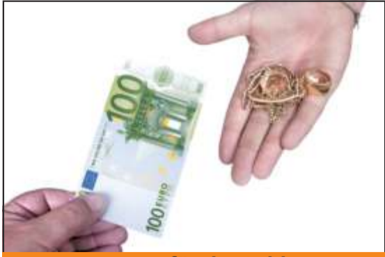
Bares für Ihr Gold