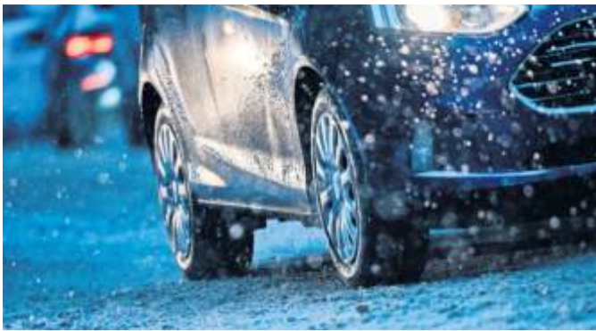
Sicher durch Eis und Schnee: Wenig Gas geben und Abstand zum vorausfahrenden Fahrzeug halten.

Die Extreme-Ausstattung, die auch für den Duster, Sandero und Jogger erhältlich ist, bietet Klimaautomatik, das schlüssellose Zugangs- und Startsystem Keycard Handsfree sowie eine Rückfahrkamera. Wichtig für Dacia ist auch die Auszeichnung mit dem Green NCAP Best Car Award, also eine besondere gute Bewertung bei Energieeffizienz sowie den Auswirkungen des Fahrzeugs und seiner Nutzung auf die Luftqualität und die globale Erwärmung. Zudem schaffte der Spring beim als Standard geltenden Euro-NCAP-Crashtest die maximale Bewertung von fünf Sternen. Nach bisherigen Zahlen ist Dacia hierzulande drauf und dran, seine Rekordzahlen von 2022 in diesem Jahr erneut zu toppen: Die Neuzulassungen stiegen in den ersten sechs Monaten um satte 40 Prozent (34.756 Zulassungen) – das stärkste Wachstum aller Volumenhersteller. Der Marktanteil kletterte auf 2,5 Prozent. Damit schloss Dacia das beste erste Halbjahr seit dem Deutschland-Start 2005 ab. Auch im zweiten Halbjahr sieht es gut aus.