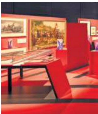
Das Haus der Geschichte wartet mit 200 historischen Originalobjekten auf.

meint: „Vielleicht Georg Rapp.“ Rapp ist 1803 in die USA ausgewandert und gehört somit zu den Pionieren der Auswanderung. „In einem Lied heißt es: Es kommt jetzt bald die beßre Zeit, wo man euch nicht mehr plagt.“ Das hofften diejenigen, die in das gelobte Land schifften. Rapp, von Beruf Leinenweber beispielsweise, gehörte zu denjenigen, die Iptingen in Württemberg vor allem deswegen verließen, weil sich im Herzogtum radikale Pietisten gegen den Staat wehrten. Dem charismatischen Iptinger Rapp gelang es, 10 000 Anhänger um sich herum zu scharen. Mit 700 Personen reiste er los, in dem Glauben, dass Jesu in den Vereinigten Staaten wiederkehren würde. Gleich mehrmals gründeten sie an verschiedenen Orten das Städtchen Harmony. Zunächst florierte das Wirtschaftsleben, dank Mühlen, einer Dampfmaschine, einer Brauerei und zahlreicher Werkstätten. 1827 führte Rapps Enkelin Gertrude die Seidenproduktion ein. Die Familie Rapp gönnte sich Wohlstand, was bei sämtlichen anderen Gemeindegliedern nicht gut ankam. Und auch der erhoffte Messias – so der Glaube dieser Gemeinde – kam nicht, zumindest nicht in Harmony.