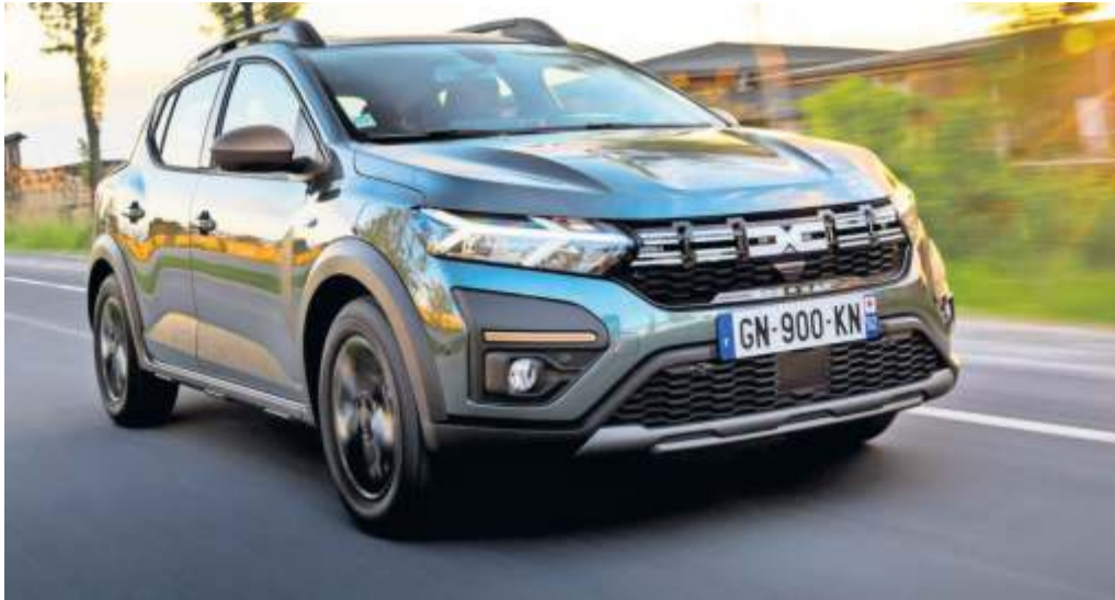
Günstig rumstromern – der Dacia Spring macht's möglich.

Antrieb: Elektro-Motor Leistung: 44 PS bzw. 65 PS V-max: 125 km/h 0 auf 100 km/h: 19,1 Sek bzw. 13,7 Sek. Außenmaße (L x B x H): 3,73 m x 1,58 m x 1,51 m Akku: 26,8 kWh netto