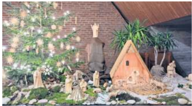
Bis Weihnachten ist in der Adventszeit in den Stuttgarter Kirchen einiges geboten.

weihnachtlich-musikalisch Programm. Der „Heslacher Dom“ wird in weiß-rotes Licht getaucht, Alexander Wehrle liest die Weihnachtsgeschichte aus Lukas 2, Mitarbeitende des VfB sprechen Fürbitten, und ein bunter Mix aus Fan- und Weihnachtsliedern erklingt durch die Stadionband Die Fraktion, die Brenz Band und den ökumenischen Chor Heslach. Im Anschluss laden die Fellbacher Weingärtner zu Glühwein und die Bäckerei Mühlhäuser zu Christstollen ein (4. Dezember, um 18.30 Uhr, in der Matthäuskirche). Der Niklasmarkt lockt mit Basar, Posaunenchor, Bauhütte und Adventssingen zur Stadtkirche Bad Cannstatt. Dazu gibt es warme Suppe, Kaffee und Kuchen sowie leckere Crêpes (9. Dezember, ab 9 Uhr, rund um die Stadtkirche Bad Cannstatt).