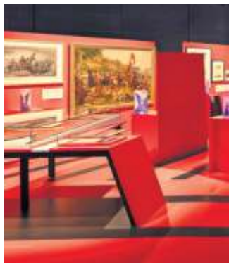
Das Haus der Geschichte wartet mit 200 historischen Originalobjekten auf.

meint: „Vielleicht Georg Rapp.“ Rapp ist 1803 in die USA ausgewandert und gehört somit zu den Pionieren der Auswanderung. „In einem Lied heißt es: Es kommt jetzt bald die beßre Zeit, wo man euch nicht mehr plagt.“ Das hofften diejenigen, die in das gelobte Land schifften. Rapp, von Beruf Leinenweber beispielsweise, gehörte zu denjenigen, die Iptingen in Württemberg vor allem deswegen verließen, weil sich im Herzogtum radikale Pietisten gegen den Staat wehrten. Dem charismatischen Iptinger Rapp gelang es, 10 000 Anhänger um sich herum zu scharen. Mit 700 Personen reiste er los, in dem Glauben, dass Jesu in den Vereinigten Staaten wiederkehren würde. Gleich mehrmals gründeten sie an verschiedenen Orten das Städtchen Harmony. Zunächst florierte das Wirtschaftsleben, dank Mühlen, einer Dampfmaschine, einer Brauerei und zahlreicher Werkstätten. 1827 führte Rapps Enkelin Gertrude die Seidenproduktion ein. Die Familie Rapp gönnte sich Wohlstand, was bei sämtlichen anderen Gemeindegliedern nicht gut ankam. Und auch der erhoffte Messias – so der Glaube dieser Gemeinde – kam nicht, zumindest nicht in Harmony.