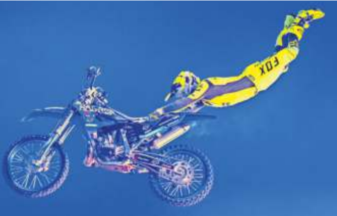
Erstmals fliegen rasende Motorräder hoch unter dem Zeltdach.