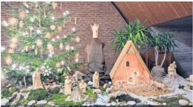
Bis Weihnachten ist in der Adventszeit in den Stuttgarter Kirchen einiges geboten.