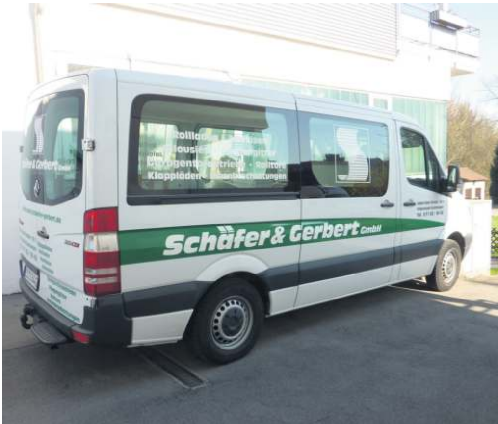
Immer für den Kunden im Einsatz: die Firma Schäfer & Gerbert in Sielmingen.