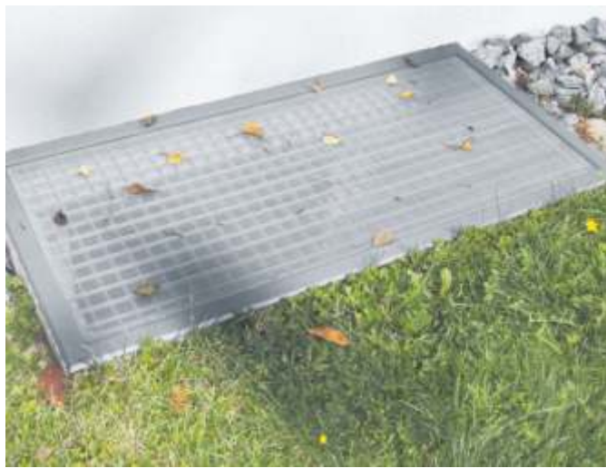
Nie mehr einen Lichtschacht reinigen: Die Firma Schäfer & Gerbert liefert maßgenaue Abdeckungen.

Die Firma Schäfer & Gerbert ist spezialisiert auf Beschattungen aller Art.