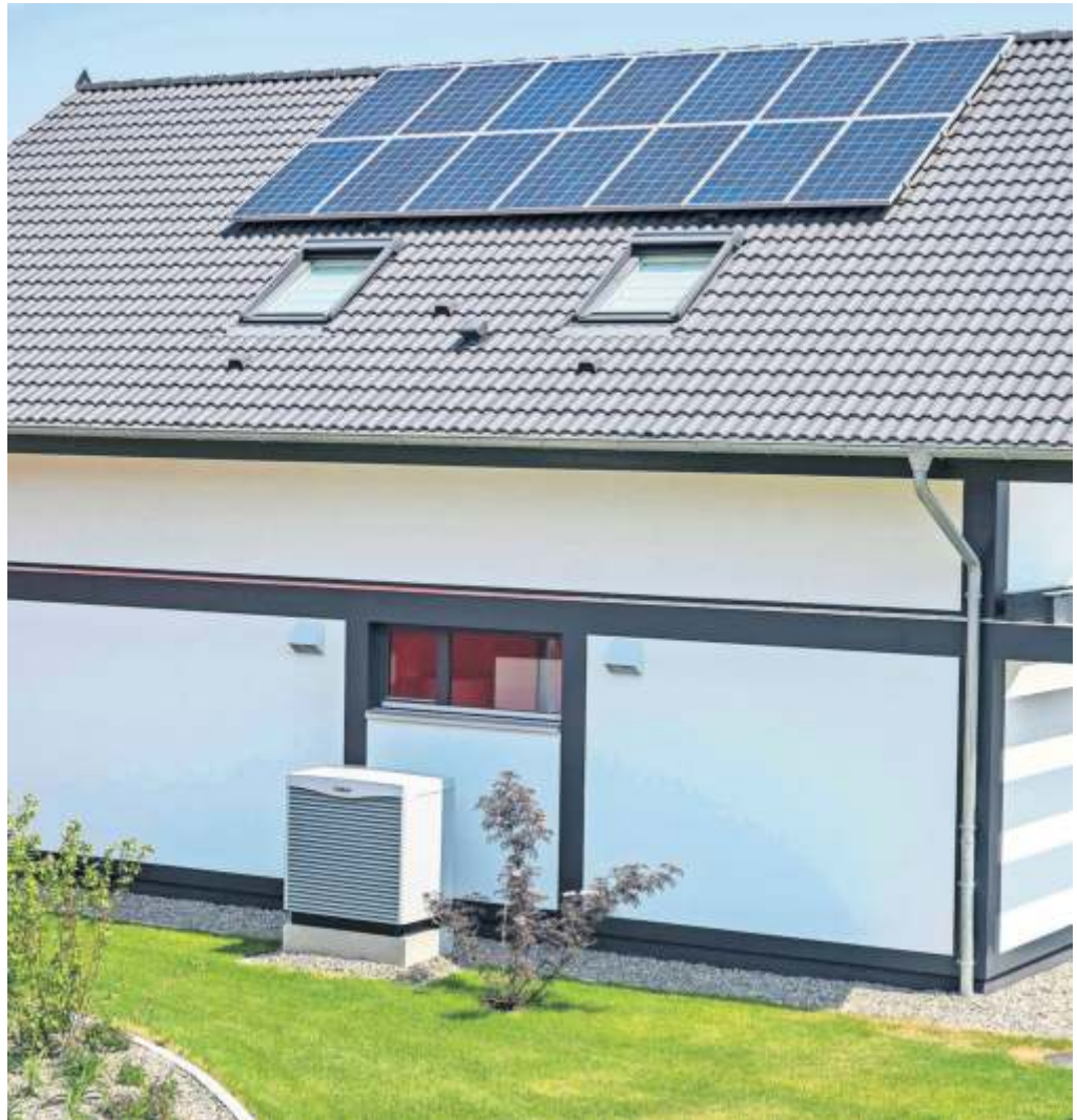
Insbesondere durch die Kombination einer Wärmepumpe mit einer Photovoltaik-Anlage auf dem Dach kann man unabhängiger von den Energiepreisen werden

Vom Gas gehen und sparen Im Vergleich zu einer neuen Gasheizung könne die Wärmepumpe laut Berechnungen der Beratung einen Kostenvorteil von bis zu 20 000 Euro auf 20 Jahre bedeuten. Dafür sorgten die geplanten hohen Förderungen sowie die durch den CO 2 -Preis deutlich steigenden Betriebskosten einer Gasheizung. Bis Mitte des Jahres 2026 beziehungsweise bis Mitte 2028 haben die Kommunen Zeit, eine Wärmeplanung zu erstellen und darin Gebiete zu definieren, in denen ein Wärmenetz oder ein Wasserstoffnetz geplant sind.