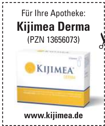
(Abbildung Betroffenen nachempfunden.)

Viele Menschen klagen über Hautirritationen unterschiedlicher Natur. Ein spezielles Präparat namens Kijimea Derma unterstützt das gesunde Hautbild von innen heraus: Es enthält Vitamin B2 und Biotin, die zum Erhalt einer normalen Haut beitragen, sowie die spezielle Mikrokultur L. salivarius. Überzeugen Sie sich selbst: Fragen Sie in Ihrer Apotheke gezielt nach Kijimea Derma.