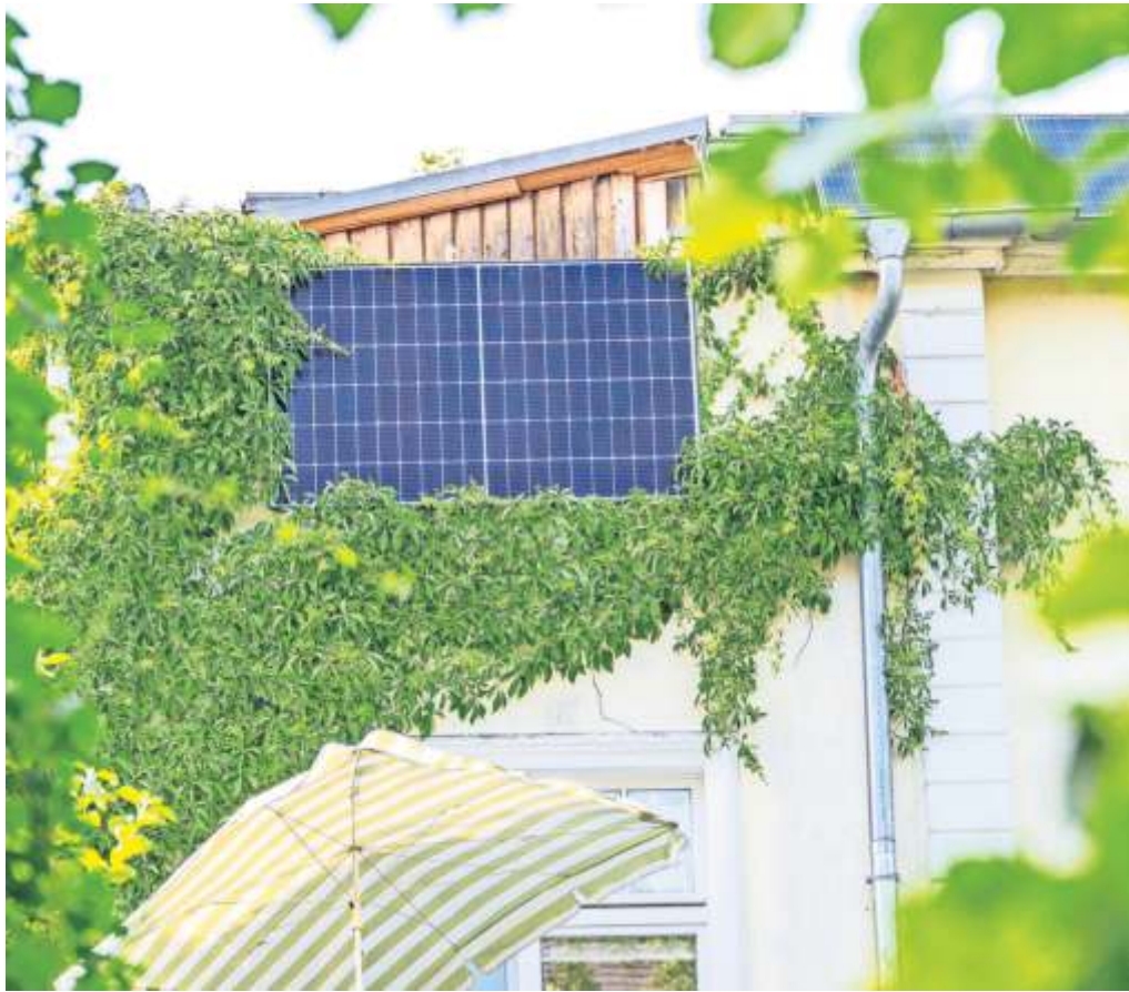
Kleine Solaranlagen für die Stromproduktion können auch am Balkon hängen.

So arbeitet eine Solarthermieanlage „Sie unterstützt die Heizung und produziert in diesen Kreislauf eingebunden auch Warmwasser. Es ist die anspruchsvollere Technik“, sagt Andreas Skrypietz, Experte der Deutschen Bundesstiftung Umwelt. In den Kollektoren einer Solarwärmanlage fließt ein Gemisch aus Wasser und Frostschutzmittel, das durch