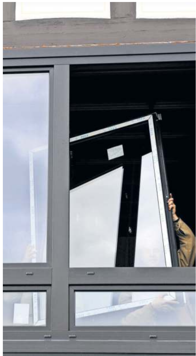
Wird der bestehende Fensterrahmen nicht ausgebaut, sind die Belastung durch Schmutz und Arbeitsintensität für die Bewohner überschaubar.