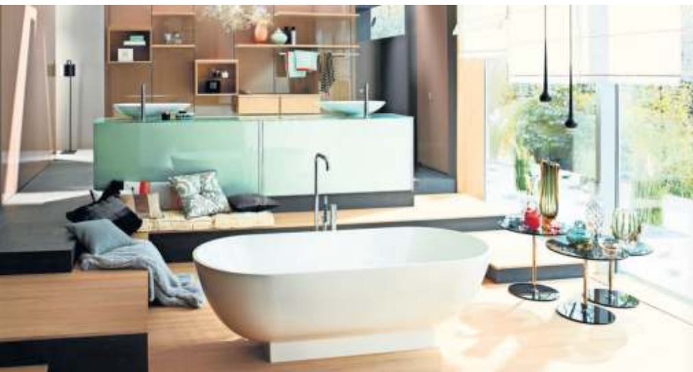
Schritt für Schritt zum modernen Traumbad.

„Wenn ich mir kein ganzes neues Bad leisten kann, habe ich zwei Möglichkeiten, etwas zu verändern. Am einfachsten ist: Ich tausche an ein paar Stellen nur etwas aus. Altes WC raus, neues WC rein, alte Armatur weg, neue Armatur rein“, sagt Jäger. „Dann habe ich ein bisschen was Neues, vielleicht auch ein bisschen was