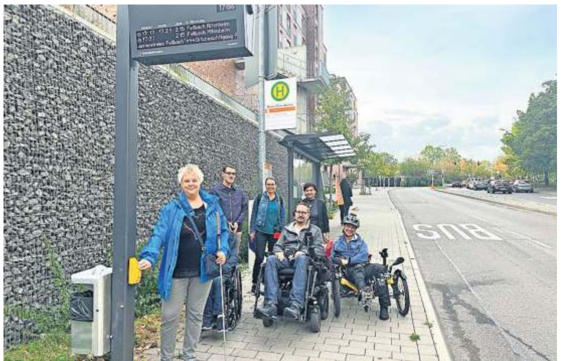
Die AG Barrierefreiheit begutachtete die umgebaute Haltestelle am Rems-Murr-Center.