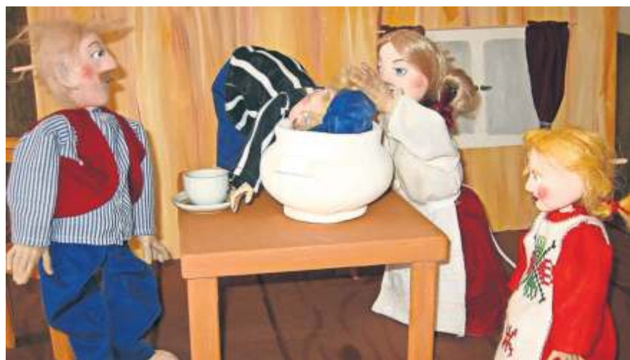
„Michel aus Lönneberga“ kommt als Puppenspiel ins SFZ.

„Jazzfieber – The Story of Germann Jazz“, Mi 20.15 Uhr.