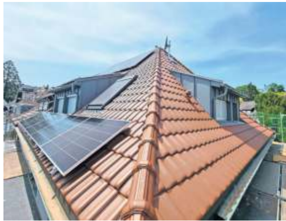
Neuer Wohnraum durch Dachgauben.

Die Firma Holzbau Schock und Bedachungen GmbH hat ihren Sitz in der Hertzstraße 1 in 70736 Fellbach. Termine für eine Fachberatung können unter 0711/58 12 00 oder per E-Mail (info@holzbau-schock.de) vereinbart werden. Auf Wunsch findet die Beratung gerne beim Kunden vor Ort statt. Weitere Informationen gibt es unter www.holzbau-schock.de im Internet. kae