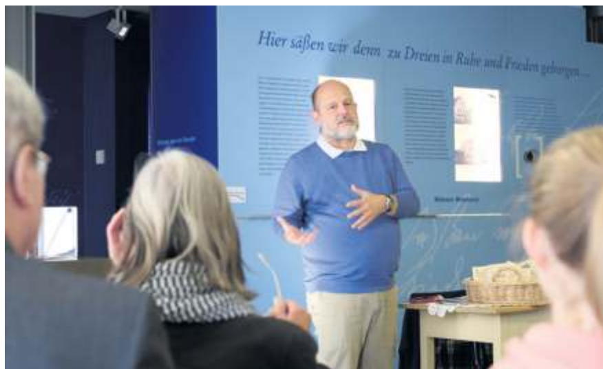
Stephan Seiter sprach über Inflation einst und jetzt,

Zum Ende der Ausstellung „50 Milliarden Mark für einen Laib Brot?“ war Prof. Dr. Stephan Seiter, MdB, im Stadtmuseum zu Gast. Die Ausstellung des Stadtarchivs beschäftigte sich mit dem Phänomen des Notgeldes in den Inflationsjahren vor 100 Jahren, auch vor dem Hintergrund der aktuellen – wenn auch nicht vergleichbaren – Inflation. Der Wirtschaftspraxisprofessor, der in Fellbach zu Hause ist, widmete sich dem schwierigen Thema „Inflation gestern und heute“ auf sehr verständliche und unterhaltsame Weise.