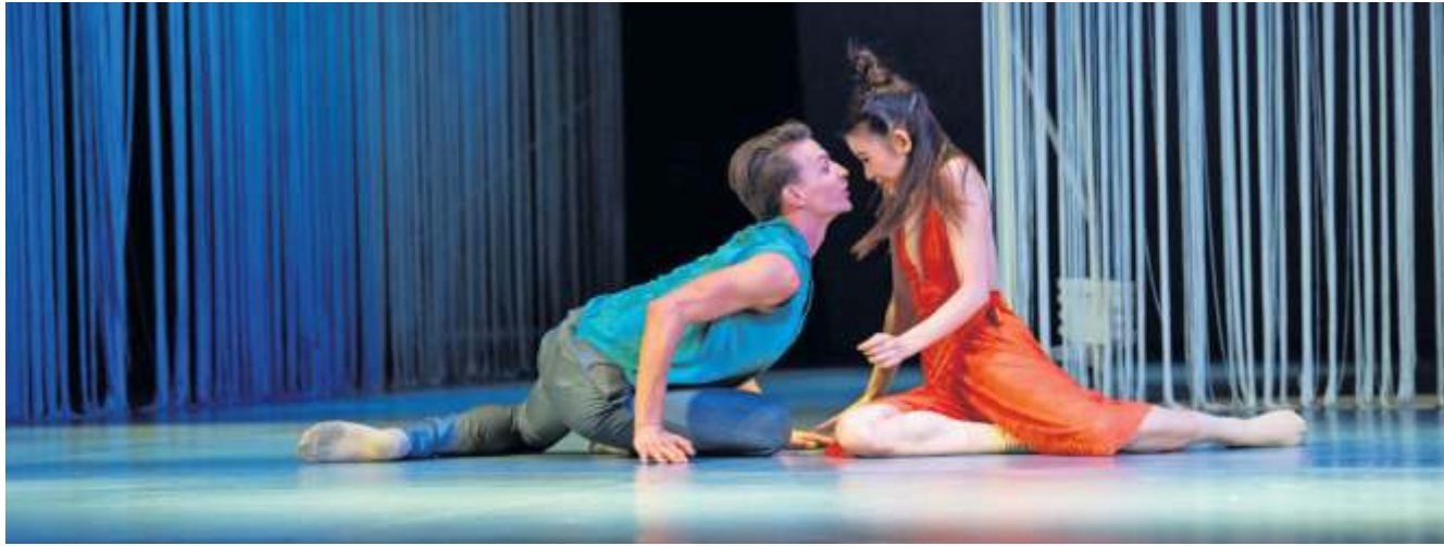
Eine jugendlich-frische Tanzfassung von „Romeo und Julia“ bringt das Pécs Ballett auf die Bühne.