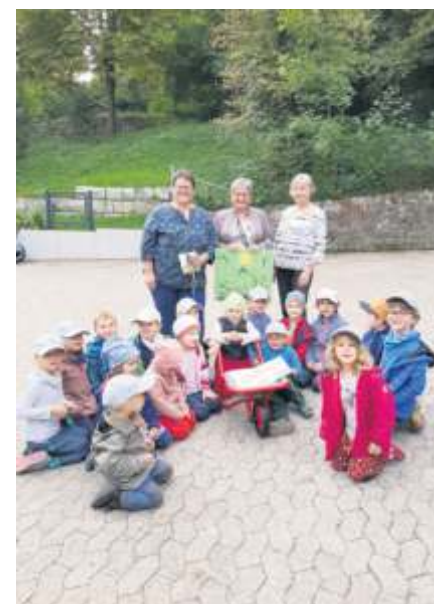
Die Kinder freuten sich über den Besuch der Landfrauen.

Die kommende Party wird am Freitag, 10. November, ab 19.30 Uhr mit der Band „The Choristers“ und dem Motto „After Halloween“ im Jugendhaus stattfinden.