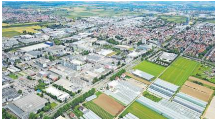
Ideen und Innovationen für die Zukunft des Fellbacher IBA-Gebiets wurden erarbeitet

Das Planungsbüro erarbeitete eine detaillierte Analyse bezüglich der