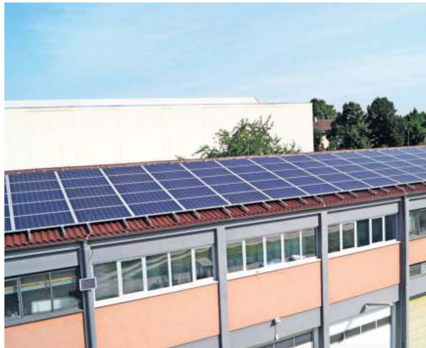
Auch auf dem Dach des städtischen Bauhofs wurde eine Photovoltaik-Anlage installiert.

„Die Nutzung von Dächern wird mit viel Engagement seit Jahren betrieben“, so Soltys. Dabei liege es nahe, städtische Flächen intensiv dafür zu nutzen. „Aktuell haben wir 13 PV-Anlagen auf unseren Dächern, weitere acht befinden sich in der Planung und weitere sechs in der Vorplanung“, erläuterte die Baubürgermeisterin. Doch nicht nur bei den städtischen Gebäuden, auch auf privaten Dächern sei sehr viel Potenzial vorhanden. Viel Potenzial attestierte Soltys auch Photovoltaik-Anlagen an Gebäuden. „Es gibt heute Elemente, die zugleich klimatisch auf das Haus wirken. Das geht einfach und kann von jedermann recht schnell umgesetzt werden.“ Zudem werden die steckerfertigen Photovoltaikanlagen, die technisch einfach umzusetzen sind, von der Stadt finanziell gefördert. Diese „Balkonkraftwerke“