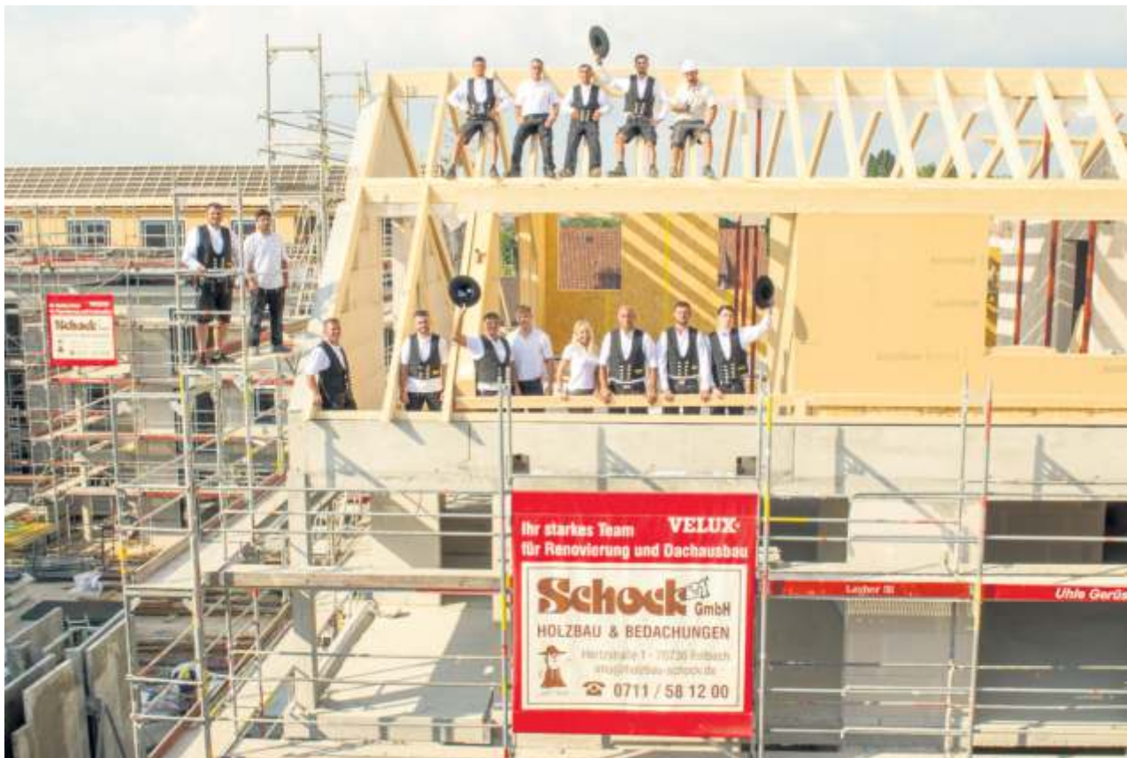
Das Team der Fellbacher Firma Holzbau Schock ist auch für größere Aufträge der richtige Partner.

Wird das Dach oder die oberste Geschossdecke dazu noch besser als gesetzlich vorgeschrieben gedämmt, schont neben der folgenden Energiekosteneinsparung auch die mögliche staatliche Förderung den Geldbeutel der Haushalten und das verbesserte Raumklima ist sowohl im Winter als auch im Sommer deutlich spürbar. Mit einer cleveren Wahl bei der Dämmung – beispielsweise in Form einer reinen