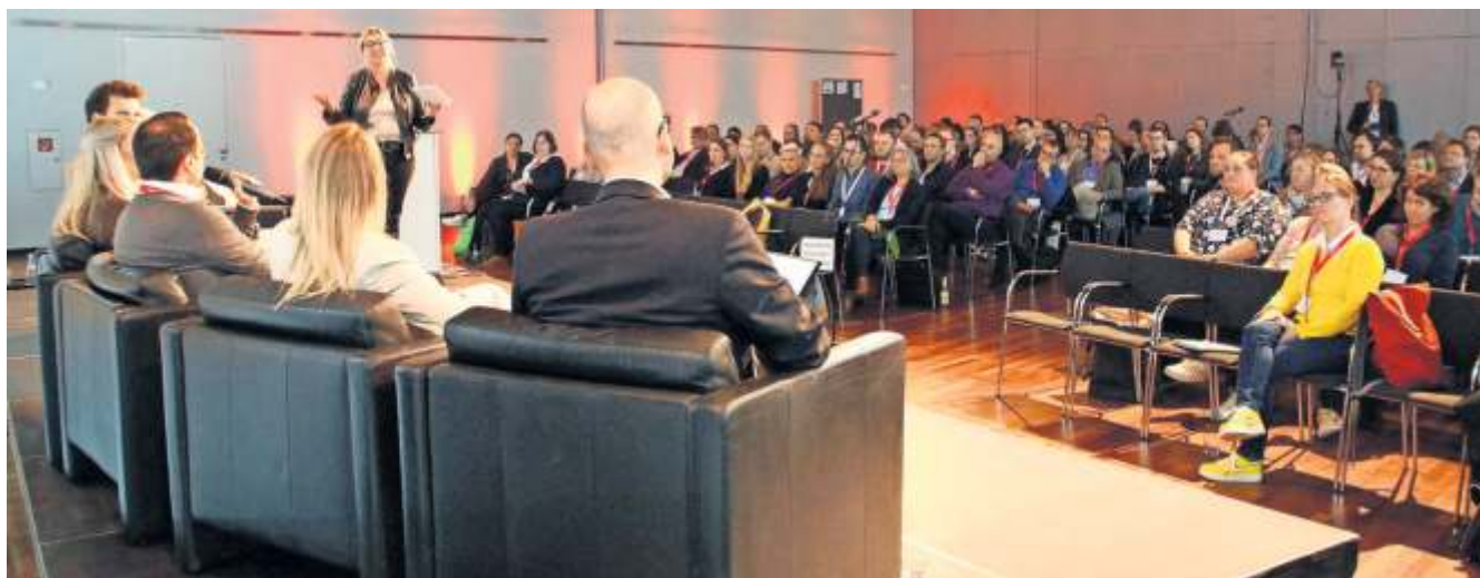
Rund 250 Digitalisierungsbeauftragte der baden-württembergischen Kommunen diskutierten auf der OZG-Konferenz, wie die Digitalisierung der Verwaltung mehr Schwung aufnehmen kann.

Die sogenannte OZG-Taskforce, ein lockerer Zusammenschluss kommunaler Digitalisierungsbeauftragter, war 2019 von einigen Kommunen – unter anderem Waiblingen, Ravensburg, Esslingen, Stuttgart und Fellbach – gegründet worden. Inzwischen tauschen sich die über 1000 Mitglieder regelmäßig online aus und treffen sich einmal im Jahr zu einer landesweiten Konferenz. „Wir wollen nicht meckern, sondern vorankommen“, so das Ziel. Daher wird der Austausch zwischen den kommunalen Praktikern und den Landesbehörden intensiviert und soll sich noch weiter entwickeln. „Wir wollen als ‚Graswurzelbewegung‘ bis auf Bundesebene Veränderungen erreichen. Es muss einfacher und durchdachter werden.“