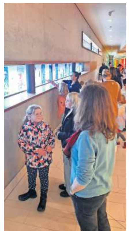
Die Kunstschulkinder sind stolz, ihre Arbeiten im F3 präsentieren zu können.

Die Wertschätzung der Stadt Fellbach für die jungen Mitbürger sei ein wichtiger Standortfaktor und präge das gemeinsame Leben und Wirken in Fellbach – ob im Schwimmbad oder in den Schulen, Fellbach habe viel künstlerisches Gestaltungspotenzial – umso schöner, wenn es im öffentlichen Raum und für alle sichtbar dargestellt wird.