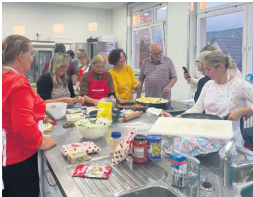
Die Teilnehmer lernten die albanische Küche kennen.

Für den kommenden Kochabend am Freitag, 17. November, mit dem Motto „Brasilianisch-marokkanisch“ gibt es noch Restplätze zu vergeben. Anmeldungen sind bis 1. November per E-Mail an sara.schmalzried@jgr.fellbach.de möglich.