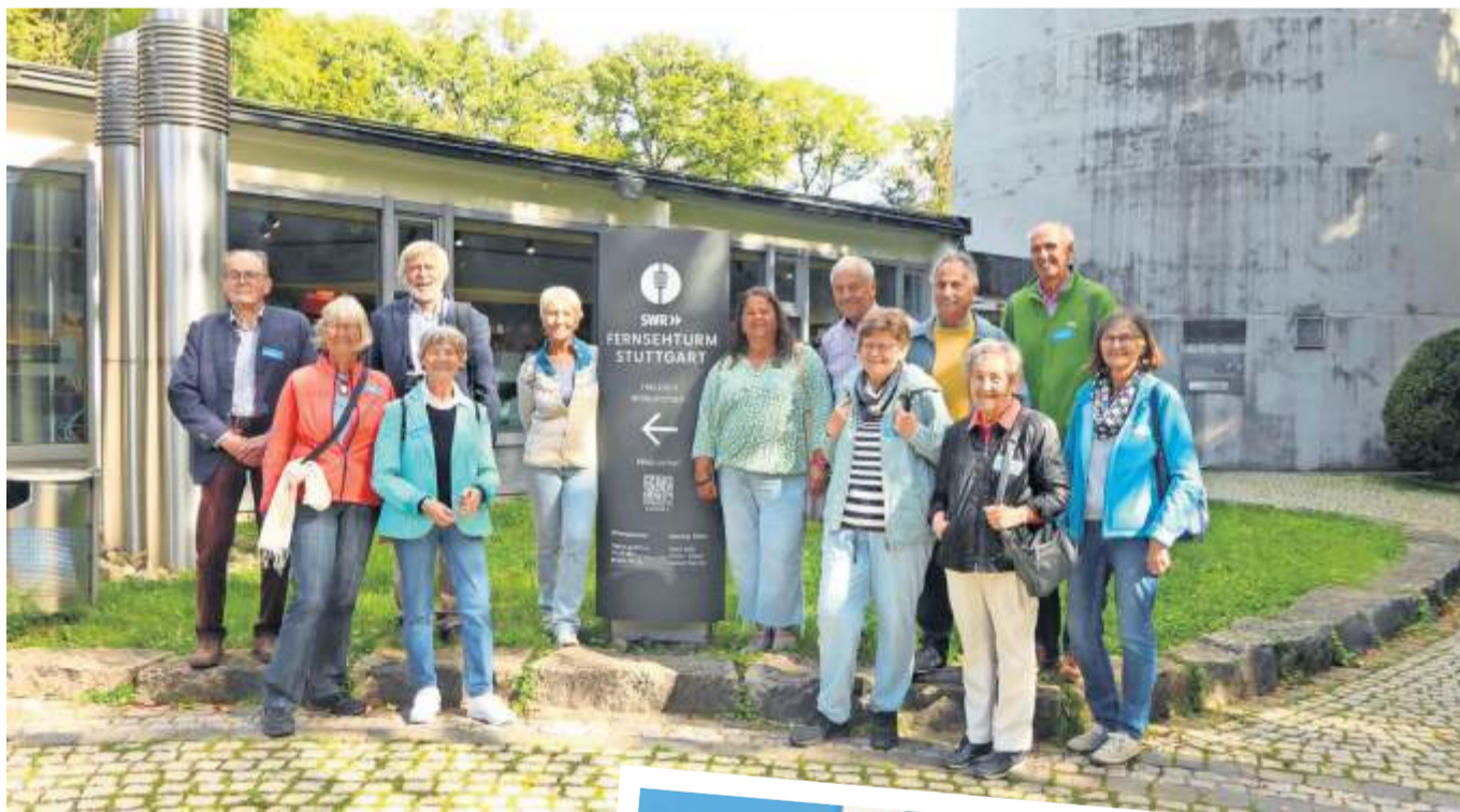
Am Fuße des Fernsehturms: die Teilnehmerinnen und Teilnehmer der VVS-Wochenblatt-60+ Aktion nach dem Besuch im Korb (Bild rechts).