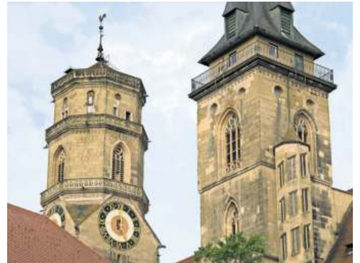
700 Jahre alt: Mit ihren ungleichen Türmen ist die Stiftskirche – neben dem Stuttgarter Fernsehturm – das Wahrzeichen der Landeshauptstadt.

Die Stuttgarter Stiftskirche feiert am nächsten Wochenende ihren 700. Geburtstag mit vielen Gästen und einem Festgottesdienst. Von Eva Herschmann