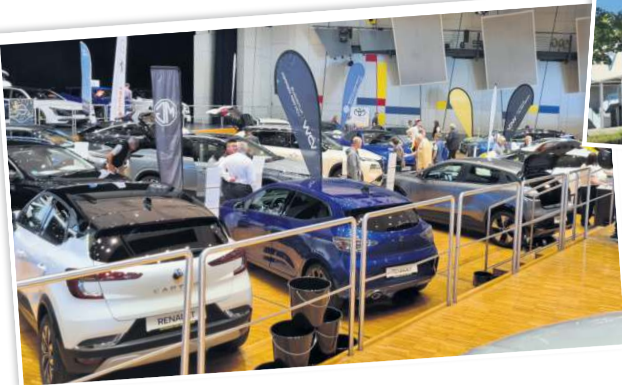
Einblicke in den 19. Autosalon in der Filderstädter Filharmonie, eine zweitägige Leistungsschau der modernen Mobilität.