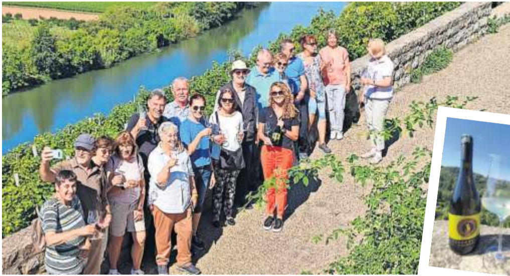
In den Weinbergen bei den Felsengärten mit wunderbarem Blick über den Neckar haben die Wochenblatt-Ausflügler den Secco sehr genossen.