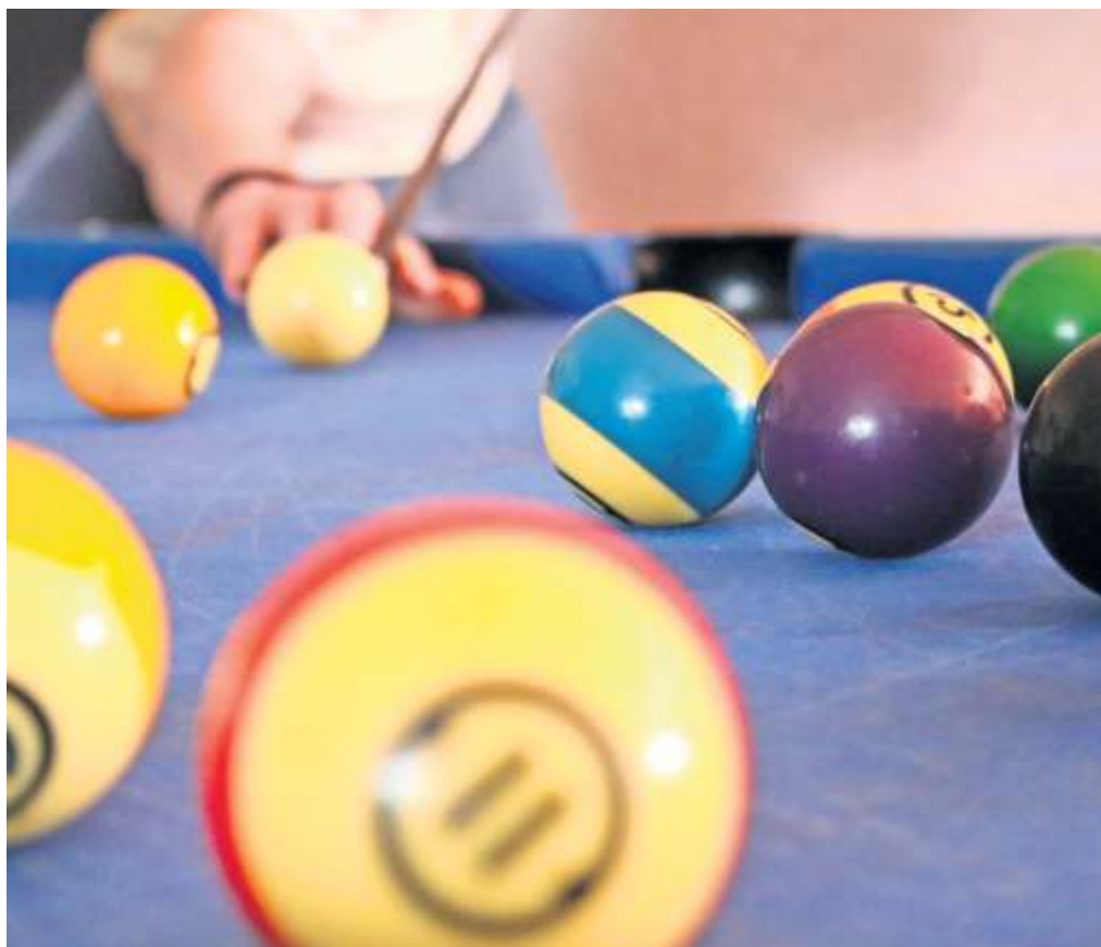
Ein Sport, der immer beliebter wird: Billard.

„Das Gesamtpreisgeld beträgt bis zu 6400 Euro, der Turniersieger bekommt immerhin 2000 Euro“, sagt Holger Maier. Gespielt werde Pool-Billard in der Dis-