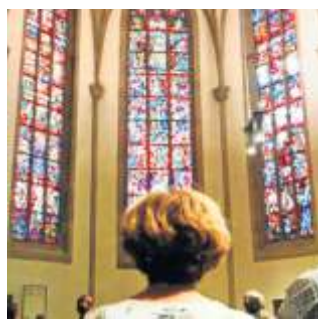
Die Stuttgarter Stiftskirche hat wunderbare Glasfenster.

Gratis und ohne Anmeldung kann man viel über die Vergangenheit erfahren und erleben. In diesem Jahr beteiligen sich in Stuttgart viele evangelische Kirchengemeinden: Die Stadtkirche Bad Cannstatt (Marktplatz 1) ist zum ersten Mal beim Tag des offenen Denkmals dabei. Der „Monumentalbau“ will in diesem Jahr zeigen, welche „Tale“ sich seiner Sanierung angenommen haben. Los geht's um 11 Uhr