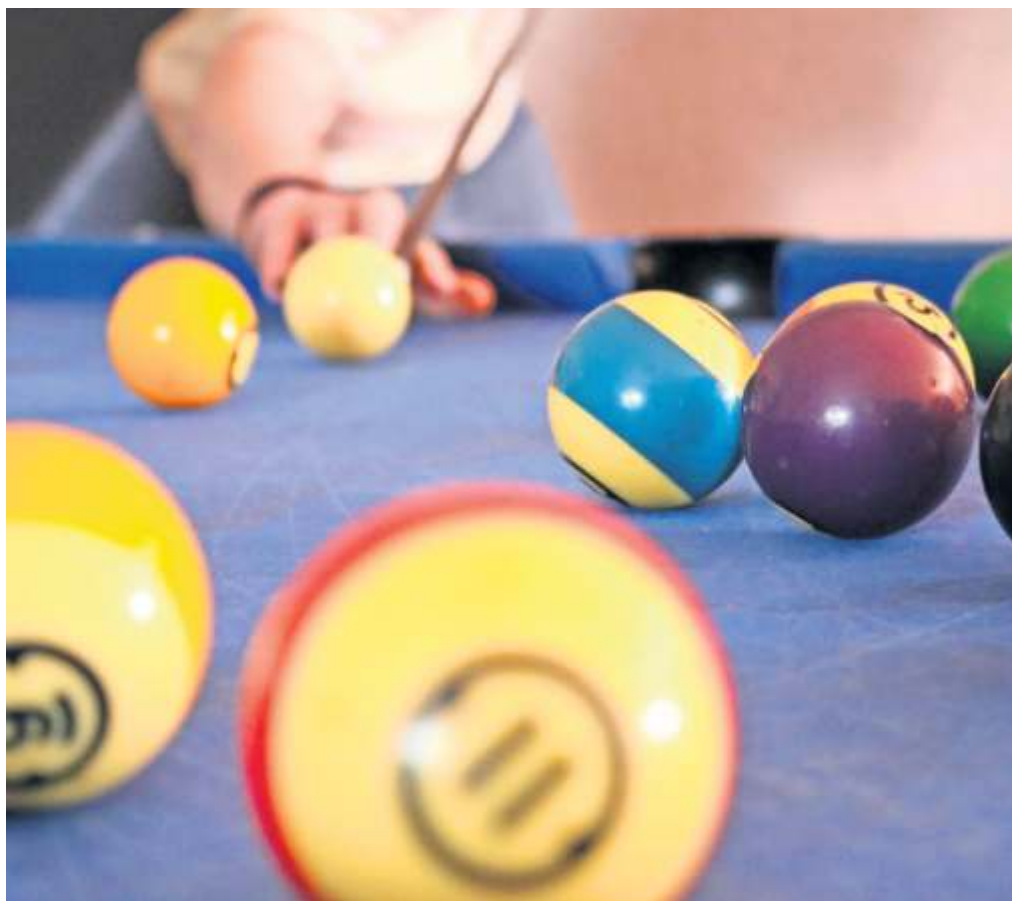
Ein Sport, der immer beliebter wird: Billard.