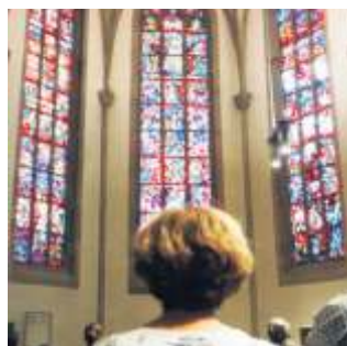
Die Stuttgarter Stiftskirche hat wunderbare Glasfenster.

Gratis und ohne Anmeldung kann man viel über die Vergangenheit erfahren und erleben. In diesem Jahr beteiligen sich in Stuttgart viele evangelische Kirchengemeinden: Die Evangelische Kirchengemeinde Stuttgart-Wangen lädt in die Michaelskirche, Im Kirchweinberg 1, ein. Von 11 bis 15 Uhr gibt es stündlich Kirchenführungen mit Turmbesteigung, durch ehrenamtliche