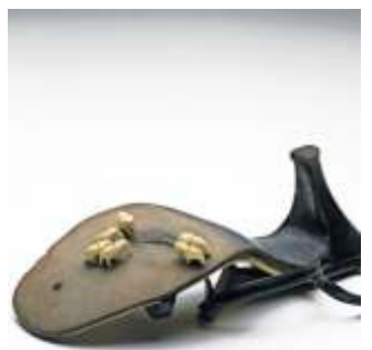
Eine Sohle eines Damen- schuhs plus Mini-Elefanten

sich der Künstler zu sei- nem Werk. Ein alter Da- menschuh mit Pfennigab- satz, verkehrt herum auf einem Sockel liegend, eine sichtbar abgewetzte Sohle, fast schon ein kleines Loch. Um dieses Loch herum ste- hen sechs Elefanten. Was sich wie der Entwurf für eine surreale Geschichte liest, ist ein kleines Kunst- objekt. „Elefantentränke“ ist der Titel, ausgestellt war es bei der 1. Triennale Kleinplastik Fellbach im Jahr 1980, kuratiert von Dr.