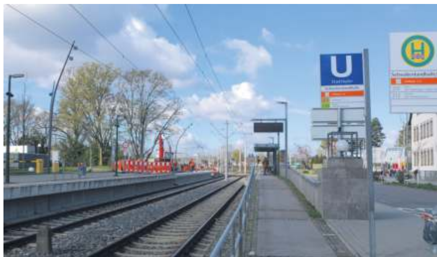
Ende September sollen die Arbeiten an der Haltestelle Schwabenlandhalle abgeschlossen sein.

Etwas länger in Geduld üben müssen sich die Pendler an der Stuttgarter-Straße/ Höhenstraßen. Hier sind erst die Hälfte der Arbeiten erledigt. Konkret heißt dies, dass der Bahnsteig in Richtung Stuttgart bereits vergrößert ist, während sich die Richtung Fellbach noch im Umbau befindet. Bis Ende September entfällt daher weiterhin der Halt in Richtung Fellbach. Die SSB rechnet damit, dass Ende Oktober auch diese Baustelle fertiggestellt ist und aufgelöst werden kann. Erst Mitte des kommenden Jahres geht es dann mit dem Umbau der Haltestelle an der Esslinger Straße weiter.