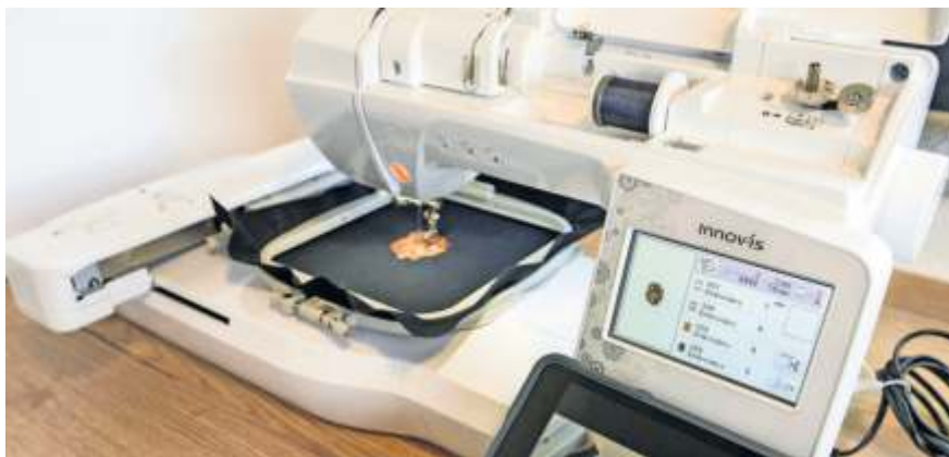
Auch eigene Projekte können im Makerspace realisiert werden.

Für einen noch besseren Einblick in das Angebot des Makerspaces lädt das Kreismedienzentrum jeden ersten Donnerstag im Monat von 9 Uhr bis 16 Uhr zum offenen Makerspace ein. Ob Jung oder Alt, Anfänger oder Fortgeschrittene, hier können alle Bürger des Rems-Murr-Kreises die faszinierende Welt des kreativen Schaffens und der Innovation erkunden: Beim offenen Makerspace