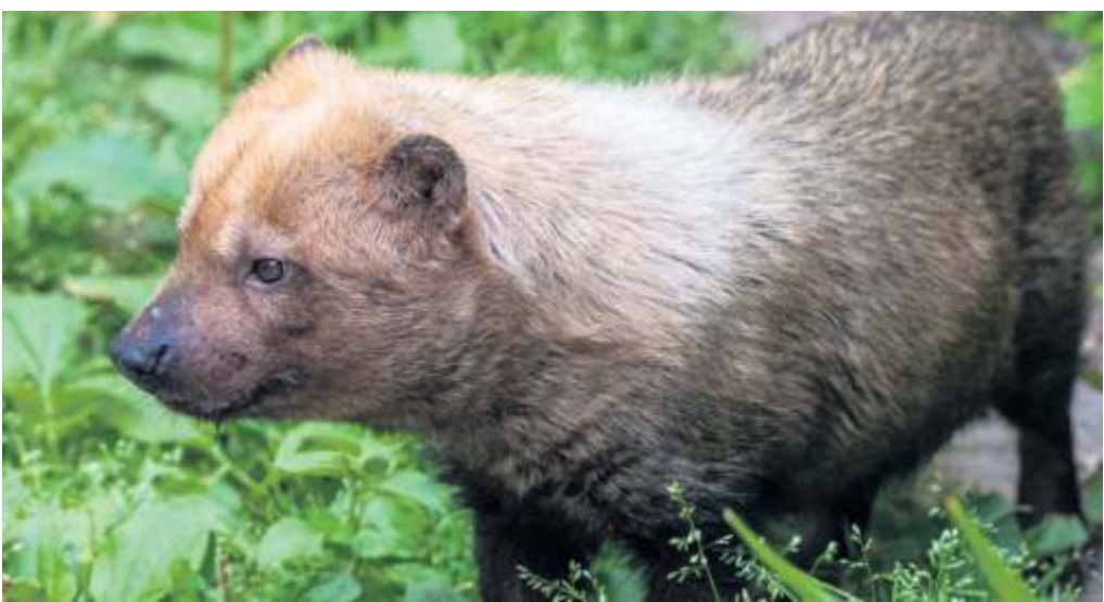
„Qamilla“: Die neue Gefährtin für Waldhund Timido.