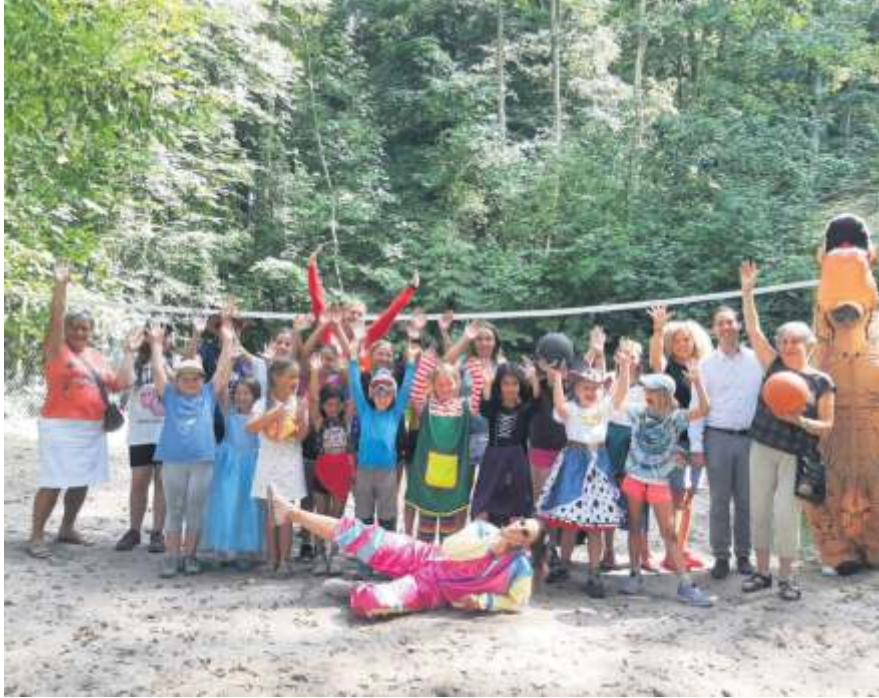
Große Freude herrschte bei den Waldheimkindern über die Spende der Fellbacher Landfrauen.