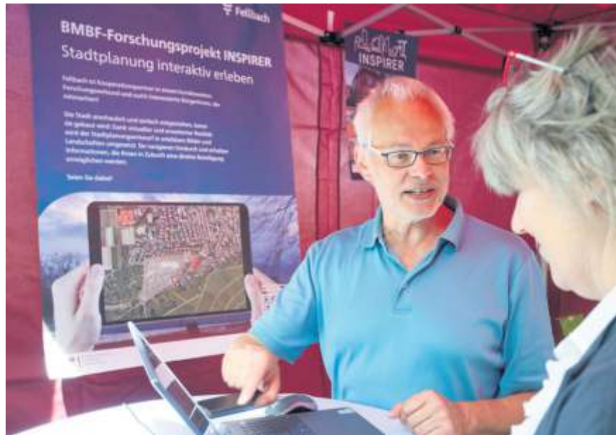
Beim Maikäferfest 2022 wurde das Projekt INSPIRER vorgestellt.

Der Workshop bietet einen einzigartigen Einblick in die Welt der Technologie und deren Rolle bei der Stadtplanung. Unter der Anleitung von Expertinnen erfahren die Teilnehmerinnen, wie die INSPIRER-App funktioniert und konkret dazu beiträgt, die Meinungen der Bürger in die Entscheidungsprozesse einzubringen.