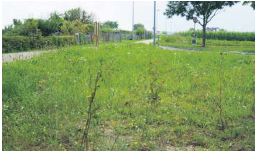
Mit der Blühfläche wurde Lebensraum für Insekten geschaffen.

Auch in Fellbach wird verstärkt das Straßenbegleitgrün umgewandelt, um die Lebensbedingungen für Insekten zu verbessern. Als Projekt für den Wettbewerb wurde eine stra-