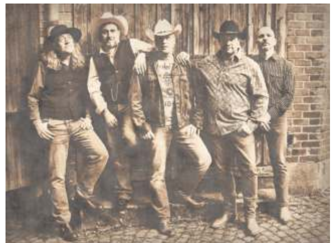
Unschwer zu erkennen: Die Band „Crock-it!“ steht für Country-Rock.

aus der amerikanischen Country-Rock Szene auf die Bühne und haben 2021 ihr zweites Studioalbum „Miles’n’Miles“ veröffentlicht. Konzertbeginn ist wie immer um 18.30 Uhr, der Guntram-Palm-Platz ist ab 17.30 Uhr bewirtet.