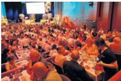
Die Große Weinprobe bildet den Herbstauftakt.

Es ist wohl eine der größten modellierten Weinproben in der Region und erfreut sich ungebrochener Beliebtheit: Die Große Weinprobe der Fellbacher Weingärtner am Donnerstag, 5. Oktober, im Hölderlinsaal der Schwabenlandhalle – der Auftakt zum Fellbacher Herbst.