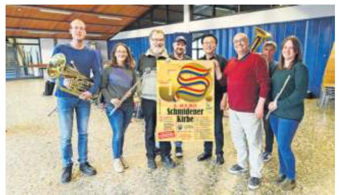
Der Lyra-Vorstand und die Musiker freuen sich, endlich die 50. Schmidener Kirbe feiern zu können.

Die Veranstalter freuen sich auf viele Gäste bei der Schmidener Jubiläumskirbe, auch beim Fassanstich im Festzelt am Samstag um 17 Uhr durch Oberbürgermeisterin Gabriele Zull und beim ökumenischen Gottesdienst am Kirbe-Sonntag um 10.30 Uhr.