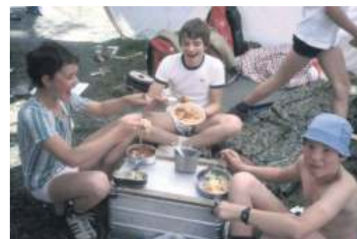
Die Pfadfinder hatten 1985 viel Spaß im Pfingstlager in Kirchberg an der Iller.

Die Marienburg, das Domizil der Hofener Pfadfinder, wurde 2011 völlig zerstört und musste wieder aufgebaut werden. Erst 2015 konnte die Marienburg von den Pfadfindern wieder „eingenommen“ werden.