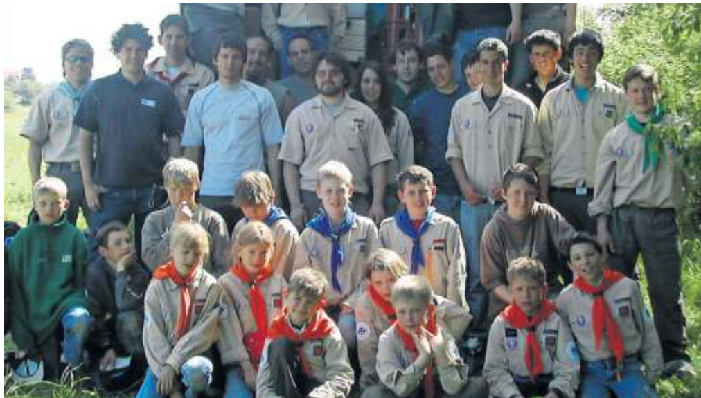
Pfingstlager in Buchheim 2006.

In den vergangenen 90 Jahren hat die DPSG Hofen viele Höhen und Tiefen erlebt. Bereits sechs Jahre nach der Gründung wurde der Stamm 1939 durch die Gestapo aufgelöst, die Pfadfinderarbeit wurde aber direkt nach dem Krieg wieder aufgenommen. In den folgenden Jahren konnte sich der Stamm weiter festigen, und es wurden neben Floßfahrten, jährlichen Zeltlagern und Ausflügen auch neue Stämme – in anderen Vereinen heißen diese Ortsgruppen – in anderen Stadtteilen gegründet.