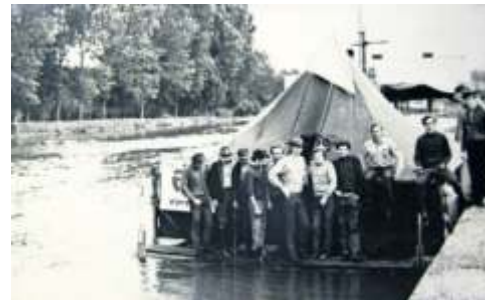
Pfadfinder-Gypsy-Rover-Floßfahrt auf dem Neckar 1969.