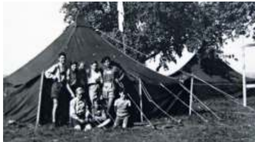
Zeltlager der Sippe Möwe 1947.