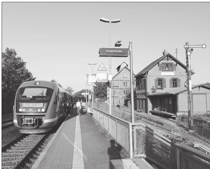
Der Zug ist flott und modern, der Rest historisch: Das Freilichtmuseum in Wackershofen im hübschen Waldenburger Bergland hat direkten Bahnanschluss. Nichts wie hin!

Zwecksetzung: Einlagenrohlinge zur Abgabe an die versorgenden Fachkreise für die Erstellung von Sonderanfertigungen zur indikationsgerechten Versorgung der Patient:innen am Fuß.