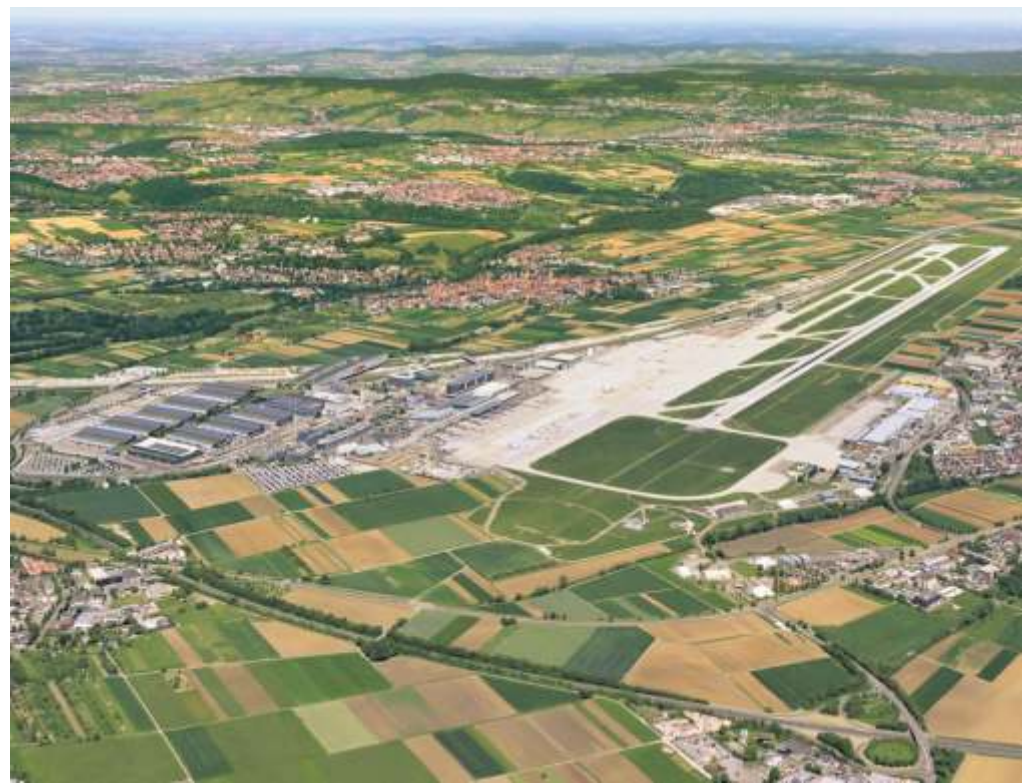
Das neue Luftbild vom Stuttgarter Flughafen aus der Vogelperspektive.