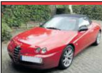
Alfa Romeo Spider JTS 2.0 166 PS rot metallic Bj 2005 148.000km Fachwerkstatt gepflegt 10.300€ VB Tel. 01729089906