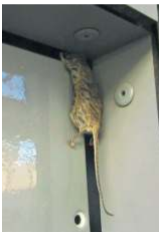
Die arme Maus konnte nicht mehr rechtzeitig vor dem Lebensmittelkontrollleur fliehen und blieb in der Schrankecke stecken. Wie kann sie wissen, dass sie in einer Restaurantküche nichts verloren hat?

frische Thunfischdose als den Übeltäter aus. „Das bildet Histamin, was die Beschwerden verursacht“, erzählt Stegmanns. „Es gibt hygienische Beanstandungen sowohl im schwäbischen Café als auch im türkischen Restaurant. Es steht und fällt mit den Menschen, die es machen, und ist unabhängig von der Nationalität“, stellt Stegmanns klar. Seine Kontrolleure machen auch Herstellungskontrollen auf dem Großmarkt (z. B. kommen die Erdbeeren wirklich aus Deutschland?). Schließlich kontrolliert Stegmanns' Team auch Großveranstaltungen wie Frühlingsfest, Festivals und Schulfeste. Die Veranstalter wurden in den letzten Jahren sehr viel von der Lebensmittelüberwachung geschult und sensibilisiert: Verkaufsbuden, in denen Lebensmittel frisch zubereitet werden, müssen ein Dach und Spuckschutz haben, leicht zu reinigende Rückwände und -böden, eierhaltige