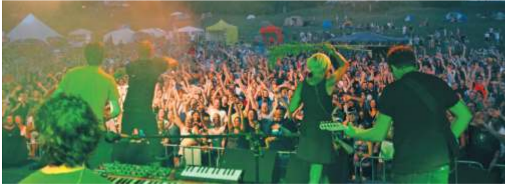
Die Stimmung beim „Umsonst und Draußen“ war in den vergangenen Jahren auf der Uniwiese (Bild) stets wahnsinnig gut. 2023 findet das Festival zum ersten Mal auf dem Festplatz Krehlstraße statt – hoffentlich mit ähnlich guter Stimmung!

Mit kräftiger Unterstützung durch die Ämter, die lokale Politik, das Popbüro und das ClubKollektiv wurde ein neuer Festplatz für das Festival „Umsonst und Draußen“ (U&D) gesucht und gefunden: Das 42. U&D findet noch bis Sonntag, 6. August, nun auf dem Festplatz an der Krehlstraße statt. Die Festivalmacher haben da gern zugegriffen. „Wir sind sehr zuversichtlich, dass auch das 42. U&D am neuen Standort eine großartige Veranstaltung werden wird“, so die Veranstalter. Viele Details werden sich natürlich ändern, doch im Kern bleibt es das Stuttgarter U&D: ein offenes, buntes Fest für alle, auf einem offenen Gelände, ohne Zaun und natürlich ohne Eintritt. Mit einem vielfältigen Musikprogramm, vornehmlich mit Bands aus der Region, darunter viele Nachwuchsbands, aber auch ein paar tollen Gästen von außerhalb. Mit einem Kinderprogramm, Infoständen, leckerem Essen und Trinken und hoffentlich ohne Verräterbier. Natürlich gibt es reichlich Festivalköstlichkeiten zu essen und zu trinken. Übrigens: Der Begriff „Verräterbier“, der inzwischen im allgemeinen Sprachge-