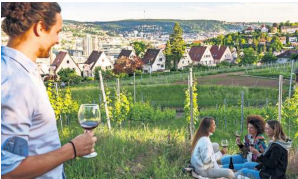
Picknick und Wein: Da können Daheimgebliebene prima „Urlaub zu Hause“ machen.

Zwei Tage lang haben die Menschen aus dem Großraum Stuttgart die Möglichkeit, ihre eigene Heimat noch besser kennenzulernen. Zusammen mit den beteiligten Kommunen hat die Stuttgart-Marketing GmbH und Regio Stuttgart Marketing- und Tourismus GmbH ein umfangreiches Ausflugsprogramm durch Städte und Natur zusammengestellt, kombiniert mit der Verkostung regionaler Leckereien. Das Erlebniswochenende