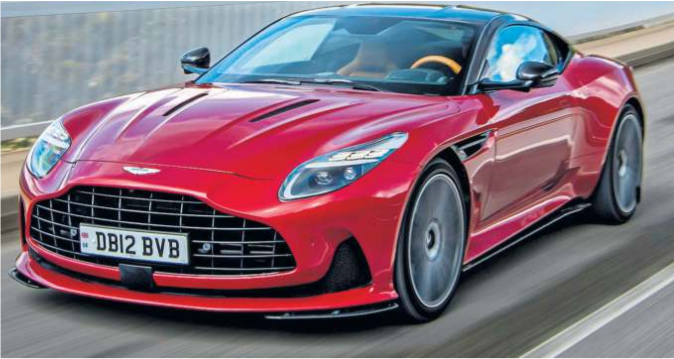
Mit 680 PS ist man am Steuer des DB12 für alle Eventualitäten gerüstet, selbst wenn man nicht Bond heißt.

Er gehört zu James Bond wie der Wodka Martini, Miss Moneypenny und die Rettung der Welt: ein Aston Martin. Kaum eine andere Marke steht derart für die 007-Reihe wie Aston Martin. Daher ist es kaum eine Frage, welches Auto er im nächsten Film fahren dürfte. Schließlich hat Aston Martin gerade den DB11 mit dem DB12 abgelöst. Wer das Auto fahren will, muss circa 225 000 Euro übrig haben. Der DB12 ist mit der Neuauflage noch breiter. Aber er trägt über seinen Muskeln statt wilder Spoiler einen eleganten Smoking, mit dem man sich nicht nur in der Boxengasse sehen lassen kann, sondern auch vor dem Grand Hotel. Und: Kaum ein anderer Sportwagenhersteller staffiert die Kabine mit mehr Luxus aus. Da Aston Martin nicht mehr das alte Infotainment des Entwicklungspartners Mercedes auftragen muss, sondern sich neuerdings eine eigene Bordelektronik leistet, sind die Anzeigen und vor allem die Unterhaltungszentrale in der Mittelkonsole auf der Höhe der Zeit. Selbst wenn sich die Navigation kurz vor Serienstart bisweilen ein