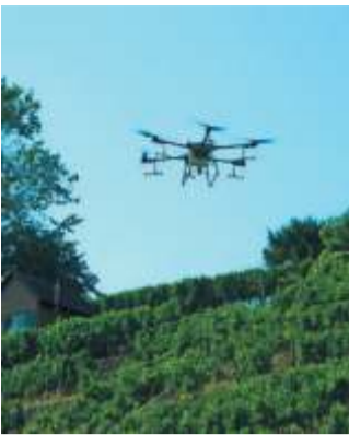
Die 78 Kilo schwere Drohne, die fleißige Helferin der Weinbauern, wird vorgeführt.

Die idyllische Kulisse entlang des Neckarufers am Fuße der Weinberge bietet den Besuchenden einen spektakulären Anblick. In den späten