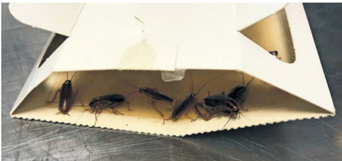
Schabenbefall: Auf einen solchen Anblick können die Stuttgarter Lebensmittelkontrolleure bei ihren Inspektionen sehr gut verzichten.