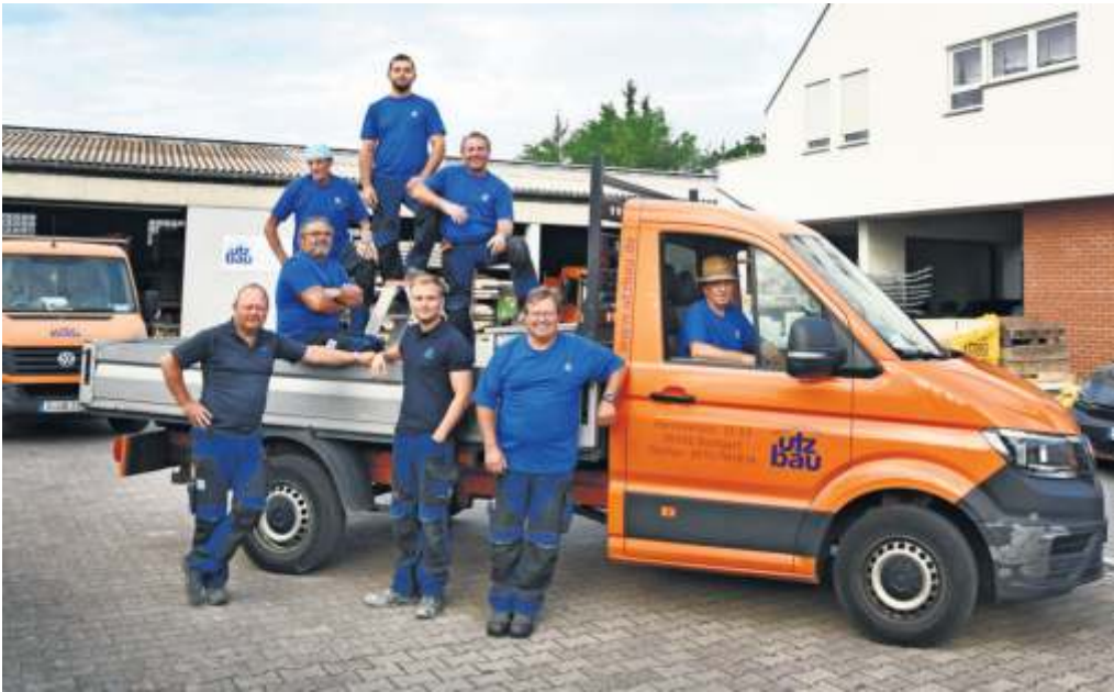
Das Team der Firma Utz Bau im Industriegebiet Vaihingen-Möhringen.