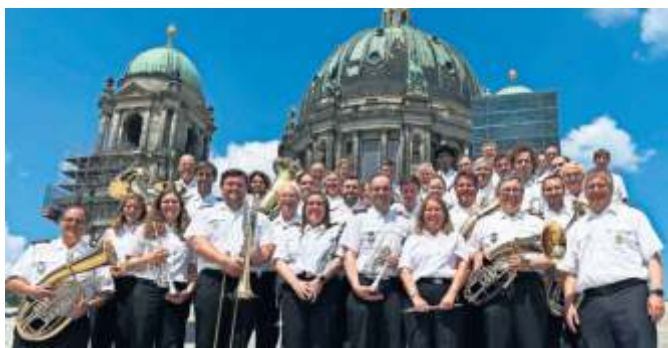
Der Musikzug Wangen spielte in Berlin.

IHR WERBEPARTNER SEIT 1955 Stuttgarter Wochenblatt Reinklicken unter www.stuttgarter-wochenblatt.de und als kostenloses ePaper im App-store