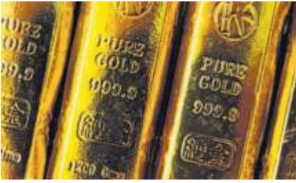
Goldbarren jeder Größe