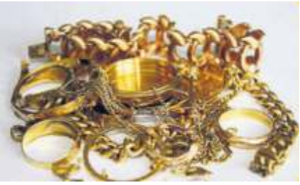
Altgold und Bruchgold

mit Werken von Bruckner auf. Eine kleine, aber besondere Reihe ist auch die Atempause in der Erlöserkirche, Birkenwaldstraße 24; das nächste Mal am 19. Juli, 19 bis 20.30 Uhr. Sämtliche Termine, auch in den Ferien, findet man unter www.musikinstuttgarterkirchen.de oder unter www.kirchenmusik-in-stuttgart.de .