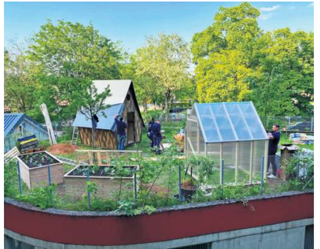
Das Angebot auf dem Aki Raitelsberg ist kostenlos.

bad&heizung Sanitär Bauer Ulmer Str. 319, Stgt. (Wangen), ☎ 42 30 69