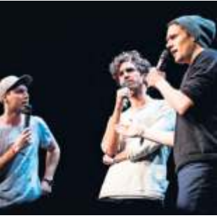
Best of Poetry-Slam – das Gipfeltreffen der Wortkünstler und -künstlerinnen – gibt es am 21. Juli auf der Open-Air-Bühne am Mercedes-Benz Museum.

ins Herzen des Publikums. Den/die Sieger/in des Abends bestimmt wie immer das Publikum. Mit dabei ist wie immer die aktuelle Crème de la Crème der deutschsprachigen Poetry-Slam-Szene – z. B. der amtierende deutschsprachige Meister im Poetry-