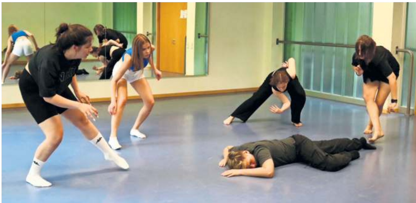
Die jungen Frauen aus der Ukraine üben fleißig für ihre Theaterperformance.

ups pfiffige Ideen präsentieren. Die Landesanstalt für Bienenkunde hat nicht nur ihr berühmtes Honig-eis zu bieten. Ein Blick in den Kuhstall auf dem Meiereihof, ein Clown-Programm und Mitmachaktionen bieten auch den jüngsten Forschern ein buntes und aufregendes Programm. Anschließend gibt es ab 18 Uhr im Schloss-Osthof ein Sommer Open-Air-Konzert der Concert Band der Uni Hohenheim. Der Eintritt ist frei. Infos und das komplette Programm unter: www.uni-hohenheim.de/tag-der-offenen-tuer . red