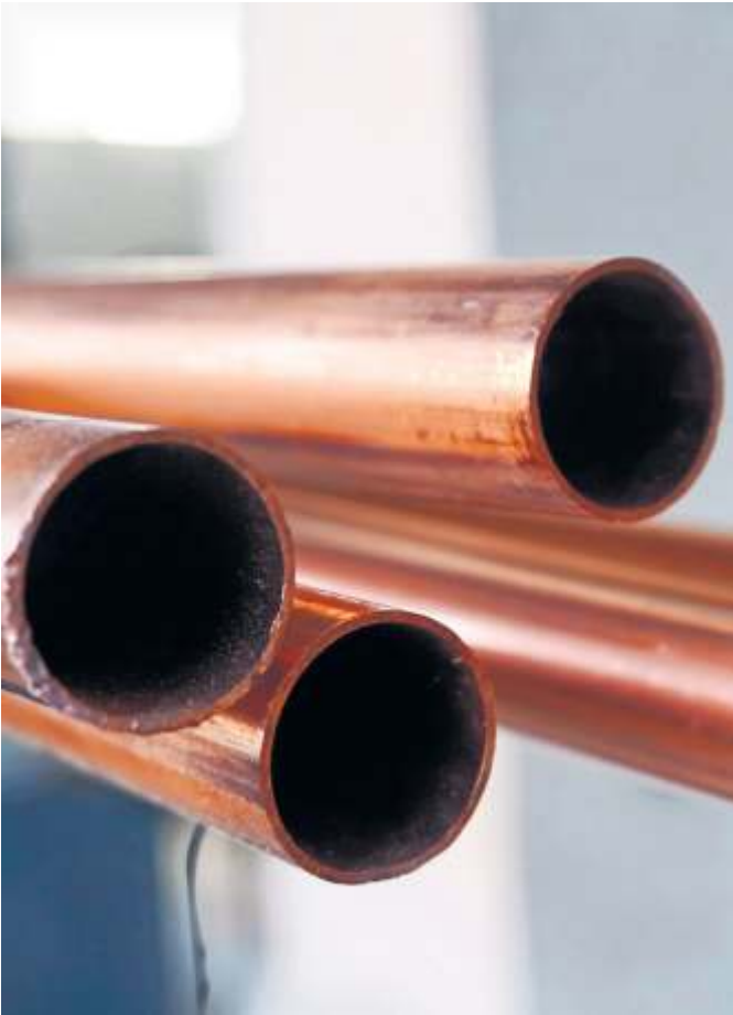
Kupferrohre mit Gütesiegel stehen für eine nachhaltige Hausinstallation.

Kupfer ist der Klassiker für die Installation im Haus – und seit vielen Jahrzehnten bewährt. Mit hervorragenden Eigenschaften etwa bei Langlebigkeit und Korrosionsbeständigkeit trägt der Werkstoff dazu bei, Ressourcen zu schonen und Gebäude „grüner“ zu machen. Durch sein breites Einsatzspektrum ist Kupfer für alle Bereiche der Hausinstallation geeignet. Neben Trinkwasser- und Heizungsleitungen wird Kupfer auch für Anwendungen mit großen Sicherheitsanforderungen eingesetzt. Dazu zählen etwa Gasleitungen oder die Anschlüsse für Solaranlagen mit ihren hohen Temperaturschwankungen. Für den Einsatz von Kupfer spricht außerdem, dass Rohre, Formteile, Fittinge und weitere Material-