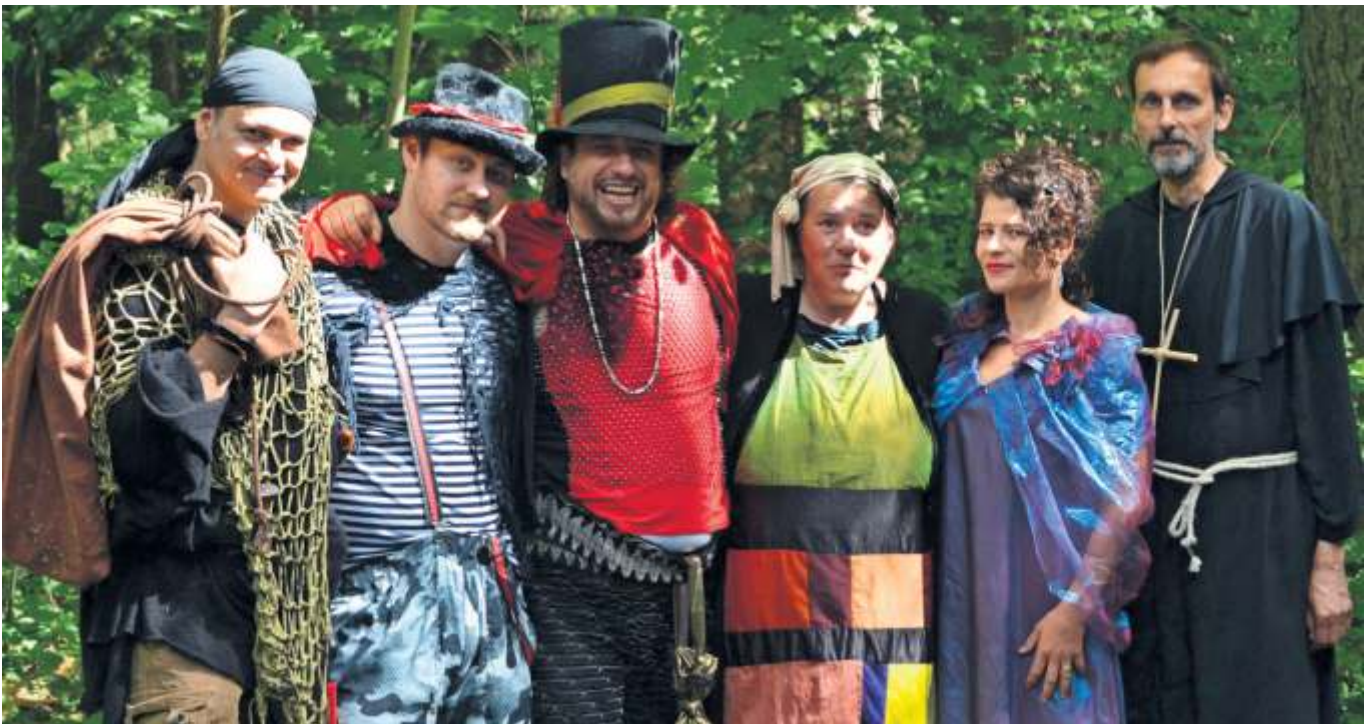
Das „RÄUBER!“-Ensemble freut sich auf die Aufführungen im Bopserwald.