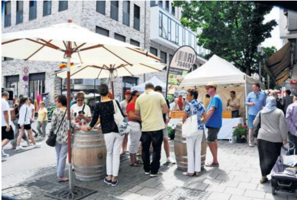
Kulinarische Highlights und leckere Drinks dürfen beim Feuerbacher Höflesmarkt nicht fehlen.

Und abends verklingt ein ausgesprochen erlebnisreicher Tag mit einem Vokalwerk-Konzert ab 18 Uhr in der Stadtkirche, Walterstraße 11, mit Werken von Ludwig van Beethoven, Billy Joel, Coldplay, John Rutter und weiteren. Eintrittskarten hierfür sind bei der Buchhandlung Schairer, Feuerbacher-Tal-