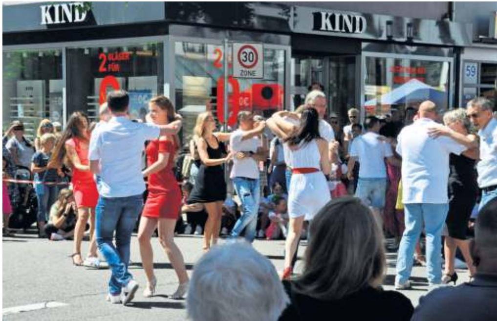
Getanzt werden darf natürlich auch in diesem Jahr.