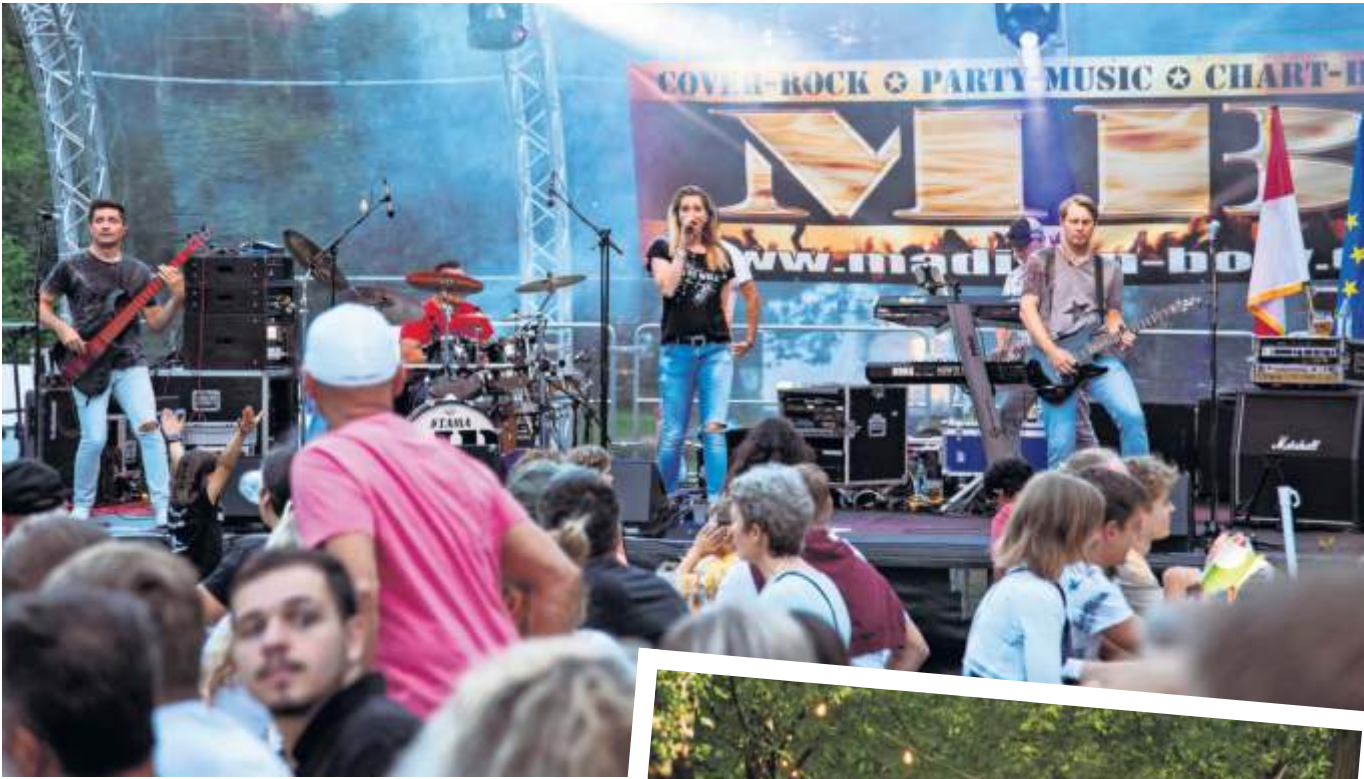
Beim Vaihinger Stadtfest ist wieder einiges auf den Bühnen und im Stadtpark geboten.

Vaihinger Stadtfest vom 30. Juni bis 2. Juli – Über 80 Gruppen sorgen für ein tolles Programm auf drei Bühnen – Mitmachangebote für die ganze Familie.