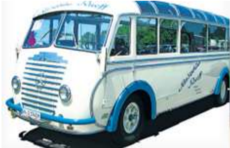
Ein 75 Jahre alte Auwärter-Bus pendelt die Gäste von Fellbach nach Backnang und wieder zurück.