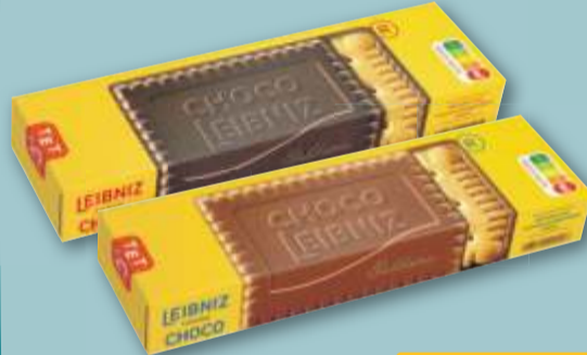
Leibniz Choco versch. Sorten, je 125-g-Pckg. (1 kg = 8.00)