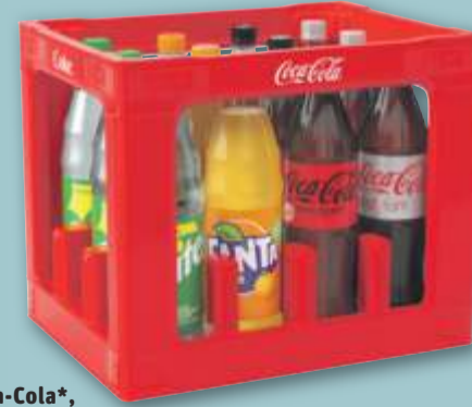
Coca-Cola*, Coca-Cola Zero*, Fanta oder Sprite Mischkasten versch. Sorten, *koffeinhaltig, je 12 x 1-l-Fl.-Kasten (1 l = 0.79) zzgl. 3.30 Pfand