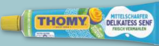
Thomy Delikatess Senf mittelscharf, je 200-ml-Tube (1 l = 5.00)