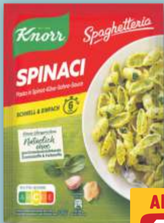
Knorr Spaghettiherria Spinaci je 160-g-Btl. (1 kg = 6.25)