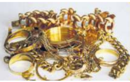
Altgold und Bruchgold

Familie K. sucht dringend ein Haus für sich u. Ihre 2 Kinder zum Kaufen in Feuerbach + 10 km Umkreis! Eigenkapital: 500.000 € Angebote bitte an Hahn + Keller 07 11 - 39 69 70 10