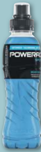
Powerade Mountain Blast je 0,5-l-Fl. (1 l = 1.78) zzgl. 0.25 Pfand