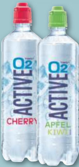
Adelholzener Active O2 versch. Sorten, je 0,75-l-Fl. (1 l = 1.33) zzgl. 0.25 Pfand