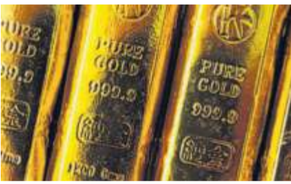
Goldbarren jeder Größe