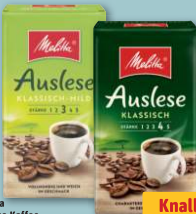
Melitta Auslese Kaffee versch. Sorten, gemahlener Bohnenkaffee, je 500-g-Pckg. (1 kg = 7.98)