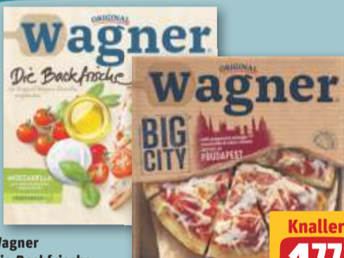
Wagner Die Backfrische Mozzarella tiefgefroren, je 350-g-Pckg. (1 kg = 5.06) oder Big City Pizza Budapest tiefgefroren, je 400-g-Pckg. (1 kg = 4.43)