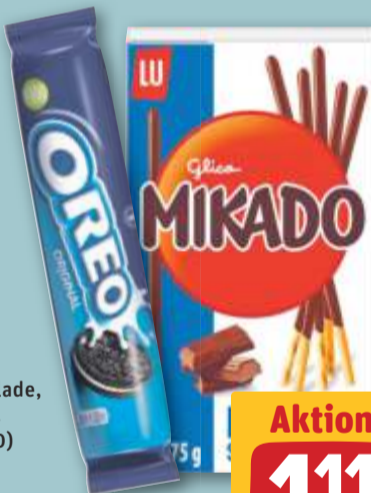
Mikado Milkschokolade, je 75-g-Pckg. (1 kg = 14.80) oder Oreo Kekse Original, je 154-g-Rolle (1 kg = 7.21)