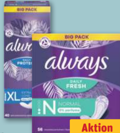
Always Slipeinlagen daily protect extra long, je 40-St.-Pckg. oder Slipeinlagen daily fresh normal, je 56-St.-Pckg.