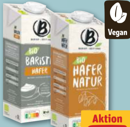
Berief Bio Barista Hafer oder Hafer Natur je 1-l-Pckg.