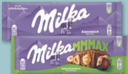
Milka Schokolade versch. Sorten, je 270-g-Tafel (1 kg = 7.41)