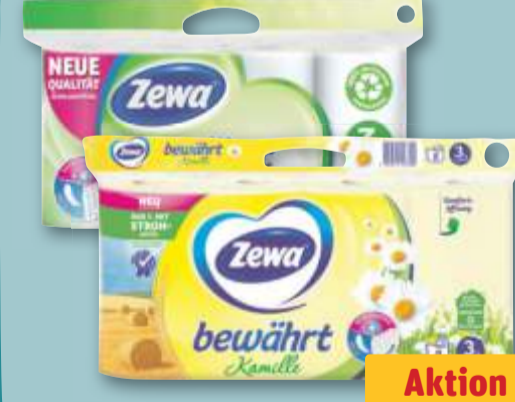
Zewa Toilettenpapier versch. Sorten, je 8 x 150-St.-Pckg.