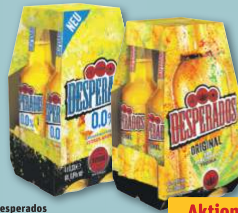
Desperados Beer versch. Sorten, je 4 x 0,33-l-Fl.-Pckg. (1 l = 4.16) zzgl. 0.32 Pfand