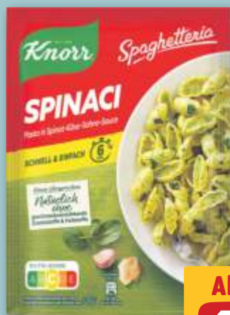
Knorr Spaghettiherria Spinaci je 160-g-Btl. (1 kg = 6.25)