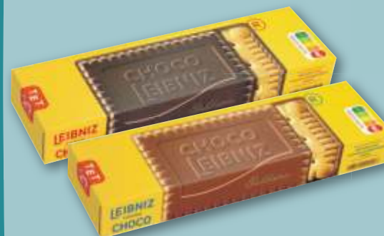
Leibniz Choco versch. Sorten, je 125-g-Pckg. (1 kg = 8.00)