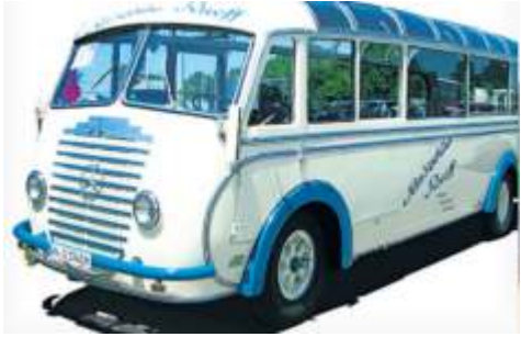
Ein 75 Jahre alte Auwärter-Bus pendelt die Gäste von Fellbach nach Backnang und wieder zurück.