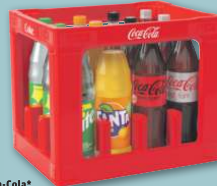
Coca-Cola*, Coca-Cola Zero*, Fanta oder Sprite Mischkasten versch. Sorten, *koffeinhaltig, je 12 x 1-l-Fl.-Kasten (1 l = 0.79) zzgl. 3.30 Pfand