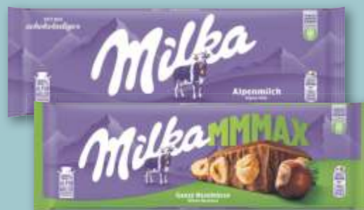
Milka Schokolade versch. Sorten, je 270-g-Tafel (1 kg = 7.41)