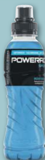
Powerade Mountain Blast je 0,5-l-Fl. (1 l = 1.78) zzgl. 0.25 Pfand