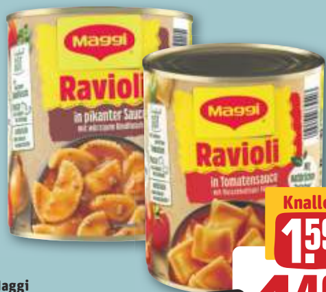
Maggi Ravioli versch. Sorten, je 800-g-Dose (1 kg = 1.99)