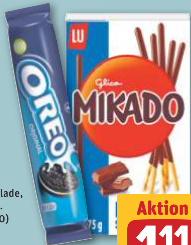
Mikado Milkschokolade, je 75-g-Pckg. (1 kg = 14.80) oder Oreo Kekse Original, je 154-g-Rolle (1 kg = 7.21)