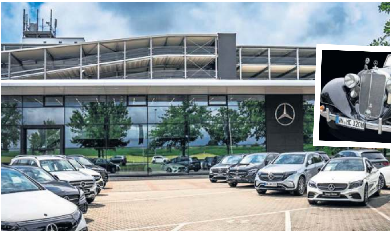
Das Autohaus Kloz feiert in Fellbach am 1. und 2. Juli groß seinen 75. Geburtstag inklusive Oldtimer-Show.