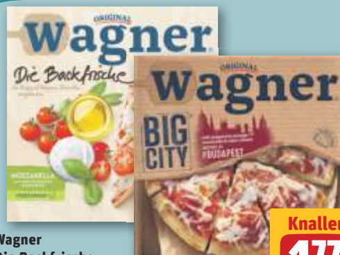
Wagner Die Backfrische Mozzarella tiefgefroren, je 350-g-Pckg. (1 kg = 5.06) oder Big City Pizza Budapest tiefgefroren, je 400-g-Pckg. (1 kg = 4.43)