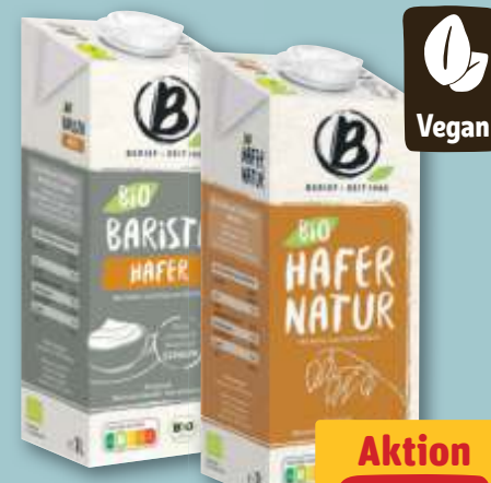
Berief Bio Barista Hafer oder Hafer Natur je 1-l-Pckg.