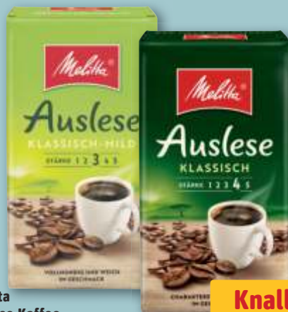
Melitta Auslese Kaffee versch. Sorten, gemahlener Bohnenkaffee, je 500-g-Pckg. (1 kg = 7.98)