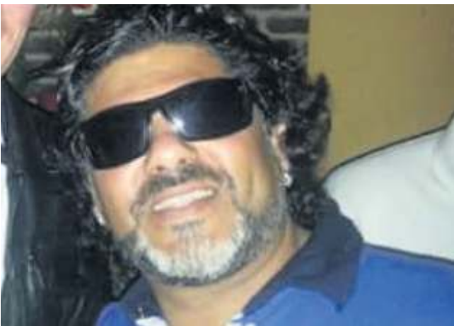
Auch Abi Aticis Tochter lässt sich beim Tauffest auf dem Fernsehturm taufen. Da darf das Maradona-Double nicht fehlen.

Wie gestalten wir unsere Zukunft angesichts der prognostizierten Mindereinnahmen und des