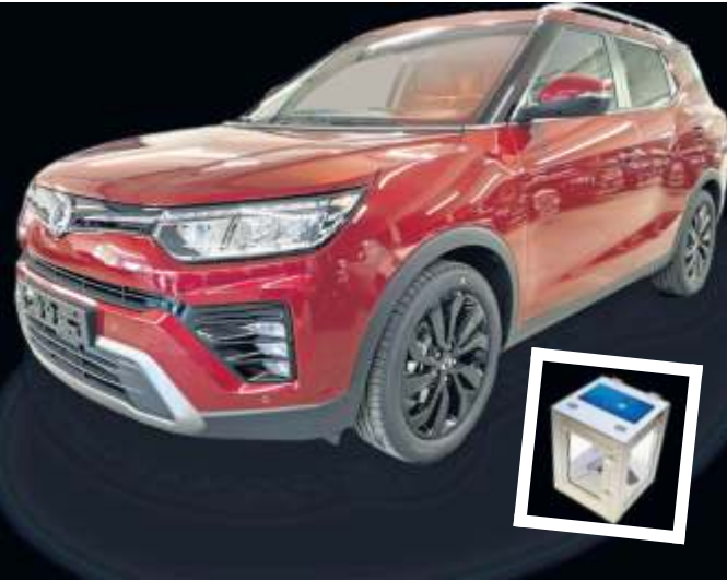
Beim Gewinnspiel lockt als erster Preis ein Ssangyong Tivoli Grand Blackline. Der Schlüssel ist in einem Tresor, den es zu knacken gilt.

Und bis dahin war der Tag mit Oldtimerfestival und großem Veranstaltungsprogramm schon eine Riesenerreichung – versprochen.