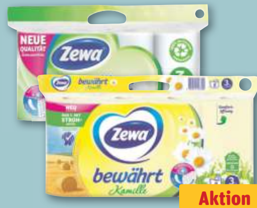
Zewa Toilettenpapier versch. Sorten, je 8 x 150-St.-Pckg.