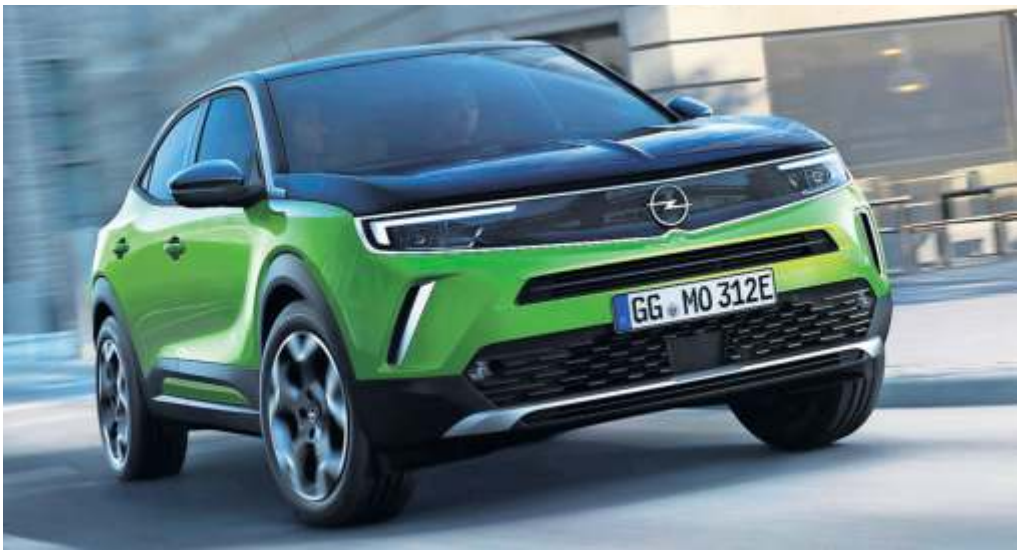
Vorne trägt der Mokka das neue Opel-Vizor-Gesicht. Unten links der etwas knapp geratene Kofferraum, rechts daneben die übersichtlich gestaltete Mittelkonsole.

Satz: reinsetzen und losfahren. Die Leistung von 136 PS (100 kW) ist für den Cross-over ausreichend, das Fahrwerk lässt (bedingt) auch dynamischere Fortbewegung zu, auf Landstraßen fühlt sich der Mokka durchaus wohl. Vor allem, wenn mit dem Schalter in der Mittelkonsole der Modus „Sport“ aktiviert wurde. Wobei: Das geht deutlich zu Lasten der Akkukapazität. Wir waren vornehmlich im „Normal“- sowie im „Eco“-Betrieb unterwegs. Über den 14-Tage-Testzeitraum meldete der Bordcomputer ein Mittel von 14,9 kWh/100 km – wir lagen damit deutlich unter der WLTP-Norm. So sind echte 300 km Reichweite mit dem 50-kWh-Akku drin. Allerdings waren die Witterungsbedingungen beim Test mit Temperaturen um die 25 Grad für Elektroautos ideal. Ist der Akku fast leer (bei fünf Prozent), muss für eine Ladung bis 80 Prozent an einem Schnelllader eine halbe Stunde eingeplant werden. An einer Wallbox fließen 11 kW in den Spei-