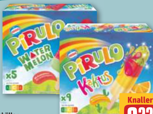
Schöller Multipackung Pirulo Watermelon je 5 x 73-ml-Pckg. (1 l = 6.08) oder Multipackung Kaktus je 9 x 45-ml-Pckg. (1 l = 5.48)