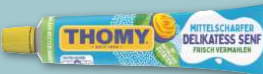
Thomy Delikatess Senf mittelscharf, je 200-ml-Tube (1 l = 5.00)