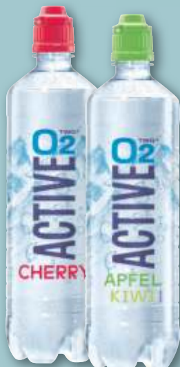
Adelholzener Active O2 versch. Sorten, je 0,75-l-Fl. (1 l = 1.33) zzgl. 0.25 Pfand