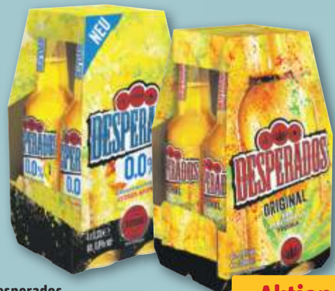
Desperados Beer versch. Sorten, je 4 x 0,33-l-Fl.-Pckg. (1 l = 4.16) zzgl. 0.32 Pfand