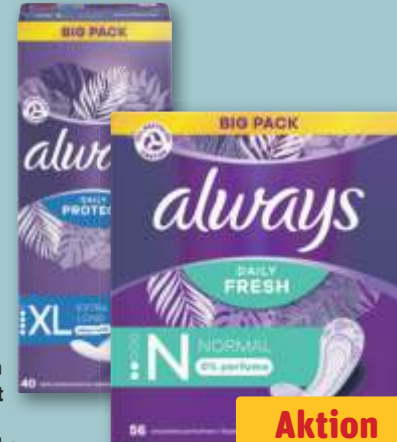
Always Slipeinlagen daily protect extra long, je 40-St.-Pckg. oder Slipeinlagen daily fresh normal, je 56-St.-Pckg.