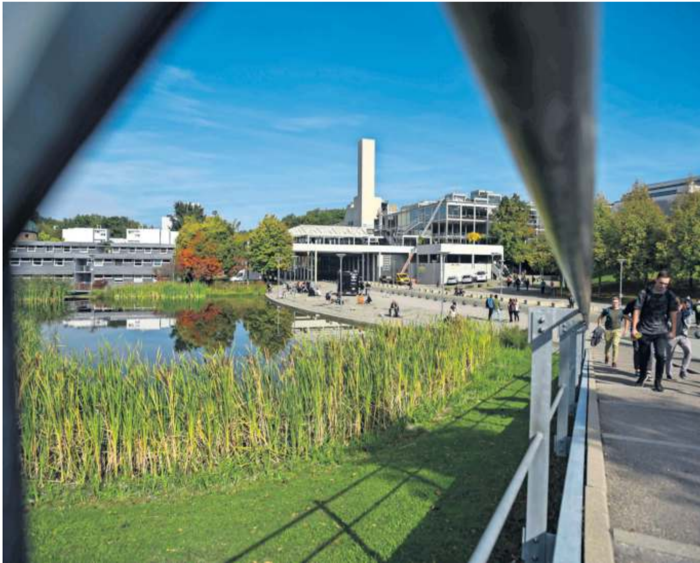
Auf dem Uni-Campus in Stuttgart-Vaihingen befinden sich seit den 1950er Jahren große Teile der Stuttgarter Forschungseinrichtungen.