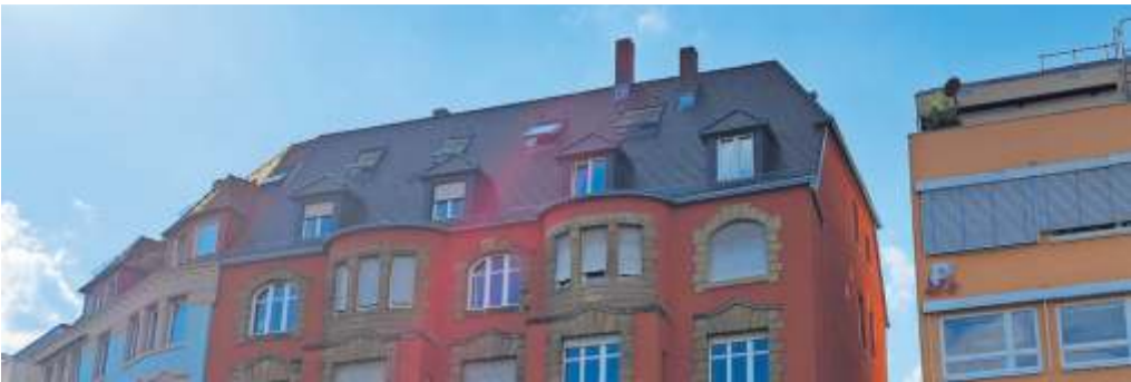
Miets- und Geschäftshaus mit Stuttgarter Dach am Marienplatz. Die Grünen im Gemeinderat suchen nach Lösungen für Fotovoltaikmöglichkeiten für diese spezielle Dachform.

falls denkbar. Als Stuttgarter Dach bezeichnet man eine Dachform, die aus einem niedrigen Pyramidenstumpf besteht und von einer Blechplattform bekrönt wird. Das Stuttgarter Dach besteht aus ein oder drei schrägen Dachflächen und einem blechernen Flachdach, das von der Straße aus nicht sichtbar ist, sodass ein Satteldach oder ein Walmdach vorgetäuscht wird. Die Wände hinter den schrägen Dachflächen sind als Dachschrägen gestaltet, die übrigen Wände sind senkrecht ausgebaut. Das Stuttgarter Dach kam im letzten Viertel des 19. Jahrhunderts auf. Es diente zur Kostenersparnis und zur Umgehung baupolizeilicher Vorschriften. Die sprichwörtliche schwäbi-