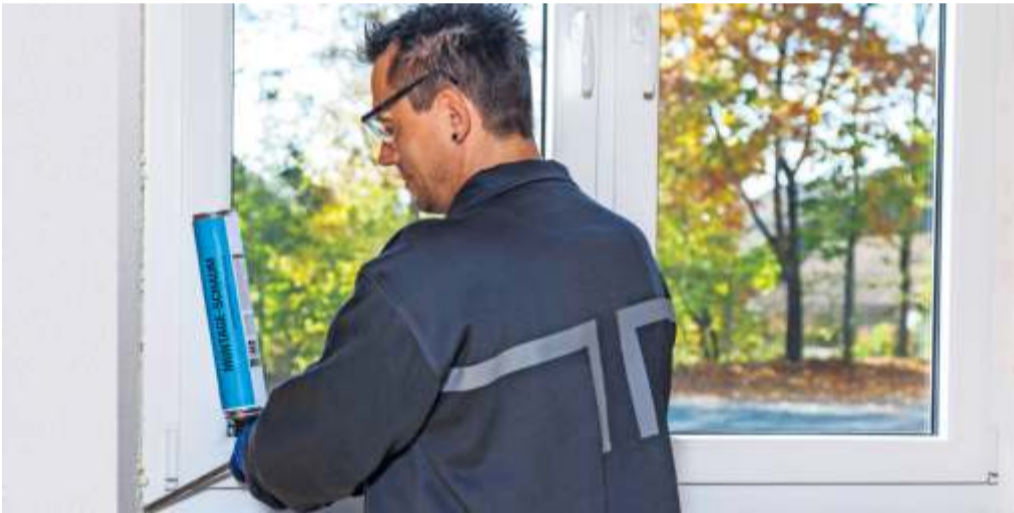
Neben der Dämmwirkung von Verglasung und Rahmen spielt auch der fachgerechte Einbau von Fenstern eine wichtige Rolle.