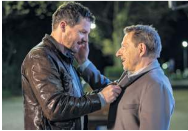
„Die Nacht der Kommissare“: Am 18. Juni wird der Stuttgart-„Tatort“ in der ARD ausgestrahlt. Rechts Thorsten Lannert (Richy Müller) und Sebastian Bootz (Felix Klare).