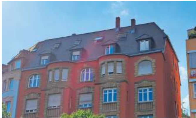
Miets- und Geschäftshaus mit Stuttgarter Dach am Marienplatz. Die Grünen im Gemeinderat suchen nach Lösungen für Fotovoltaikmöglichkeiten für diese spezielle Dachform.

Als Stuttgarter Dach bezeichnet man eine Dachform, die aus einem niedrigen Pyramidenstumpf besteht und von einer Blechplattform bekrönt wird. Das Stuttgarter Dach besteht aus ein oder drei schrägen Dachflächen und einem blechernen Flach-