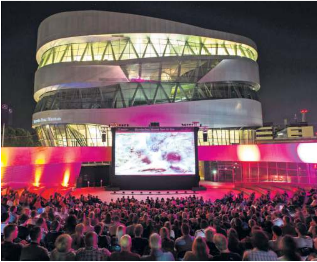
Vom 18. August bis 3. September 2023 gibt's vor dem Mercedes-Benz Museum wieder Open-Air-Kino.

Mitmachaktionen, Food und Drinks sowie eine Chill-out-Area: Das kostenlose Jugendmusikfestival „Summer Vibes“ der stjg (Stuttgarter Jugendhaus Gesellschaft) kehrt zurück in den Schlossgarten, genauer auf den Berger Festplatz. Am Freitag und Samstag, 16. und 17. Juni, laden die Jugendhäuser West und Mitte gemeinsam mit dem Werkstattthaus Ost