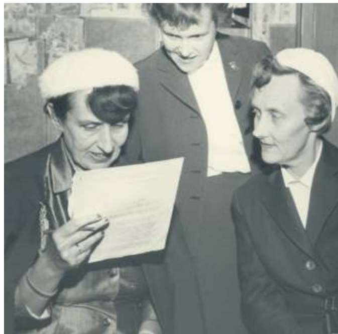
Astrid Lindgren (rechts) wäre vielleicht nicht so bekannt geworden, wenn die Stuttgarterin Jella Lepman (links) sie nicht gefördert hätte. Hier trifft man sich beim Kongress des International Board on Books for young People 1956 in Stockholm.

Aber Jella Lepman kam zurück nach Deutschland, sogar nach Stuttgart und schrieb in ihren Erinnerungen, dass sie einen Auftrag als Majorin für Erwachsene sicher abgelehnt hätte. Aber als eine Beauftragte für Frauen- und Jugendfragen willigte sie ein. „Waren die Kinder Deutschlands nicht genauso schuldlos wie die Kinder überall auf der Welt, wehrlose Opfer furchtbarer Ereignisse?“, so notierte sie in ihren Memoiren „Die Kinderbuchbrücke“ 1964. Der erste Landesvater Baden-Württembergs, Reinhold Maier, erinnerte sich,