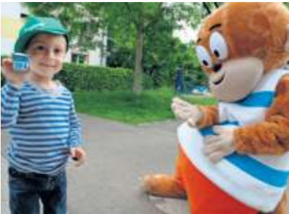
S'LAUFT lädt am 30. Juni zum Kids Cup.

Bodenmarkierungen versehen. Sie führen über die Weinberge oder durch den Ortskern. Damit sich alle laufbegeisterten Eltern und Kinder kennenlernen können, feiern wir gemeinsam beim Kids Cup am Freitag, 30. Juni. Höhepunkt für Groß & Klein ist der Besuch der schwäbischen Nationalhelden „Äffle & Pferdle“.