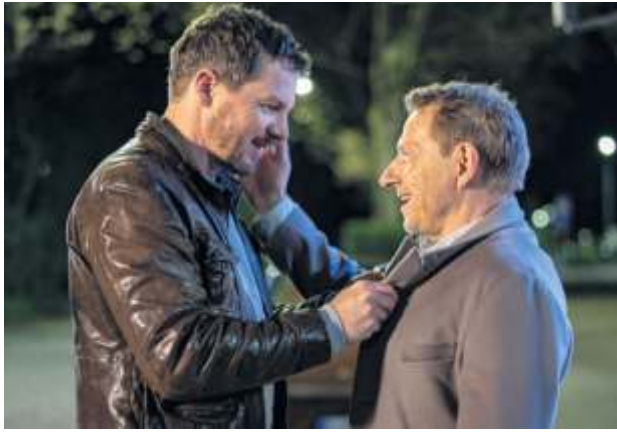
„Die Nacht der Kommissare“: Am 18. Juni wird der Stuttgart-„Tatort“ in der ARD ausgestrahlt. Rechts Thorsten Lannert (Richy Müller) und Sebastian Bootz (Felix Klare).