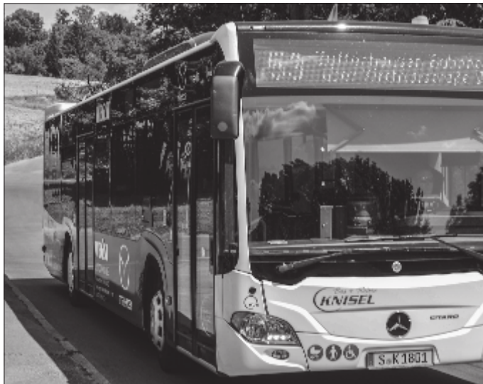
Die Buslinie 53 verkehrt zwischen Zuffenhausen und Mühlhausen. In den Morgenstunden fährt sie auch Feuerbach an und teils endet sie in Zazenhausen.

Am Zuffenhäuser Busbahnhof stehend und die städtische Umgebung betrachtend, kommt man wohl nicht auf die Idee, dass man nur wenige Minuten von Hangwäldern, Tümpeln, Auewiesen und einer reichen Flora und Fauna entfernt ist. Dabei ist es so einfach: Einsteigen in den Bus der Linie 53, gefahren von der Firma Knisel im Auftrag der SSB – und aussteigen in einem wunderschönen Naturschutzgebiet im Norden Stuttgarts.