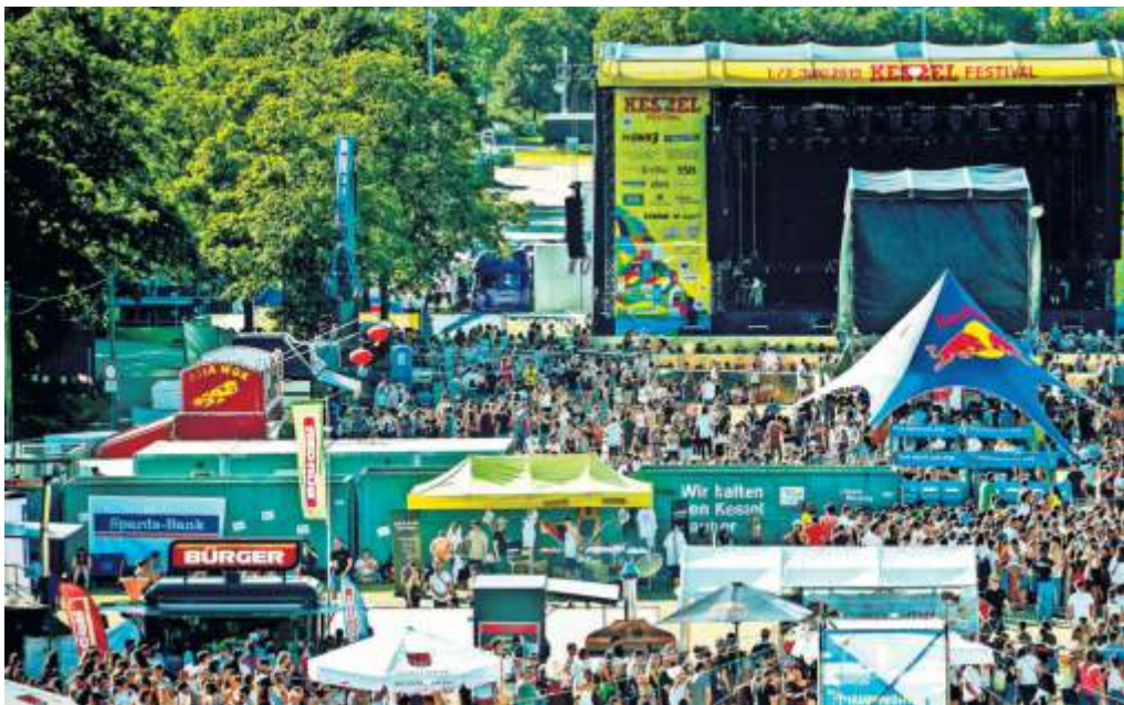
Musik, Kulinarisches, Unterhaltung und Nachhaltigkeit: Das Kessel Festival am 24. und 25. Juni bietet Attraktionen und eine Vielzahl an Konzerten.