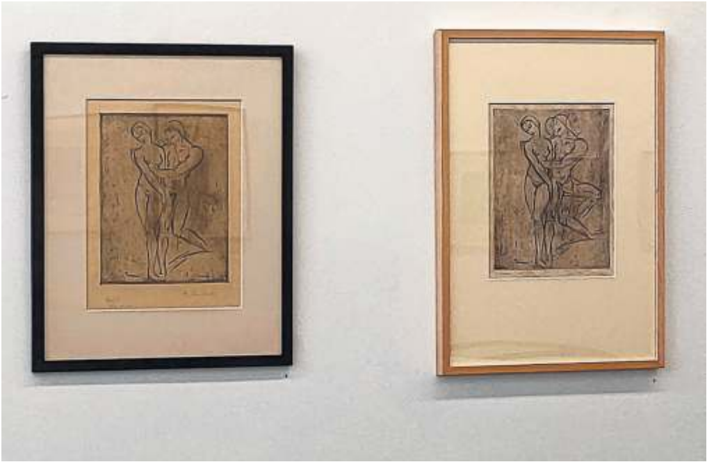
Das druckgrafische Werk von Wilhelm Lehmbruck wird jetzt in einer ersten eigenständigen Ausstellung in der Städtischen Galerie Fellbach gezeigt.

In der Galerie der Stadt Fellbach wird im Rahmen des Europäischen Kultursommers, bei dem Frankreich Gastland ist, eine umfassende Ausstellung zum grafischen Werk von Wilhelm Lehmbruck gezeigt. Von Ingrid Sachsenmaier