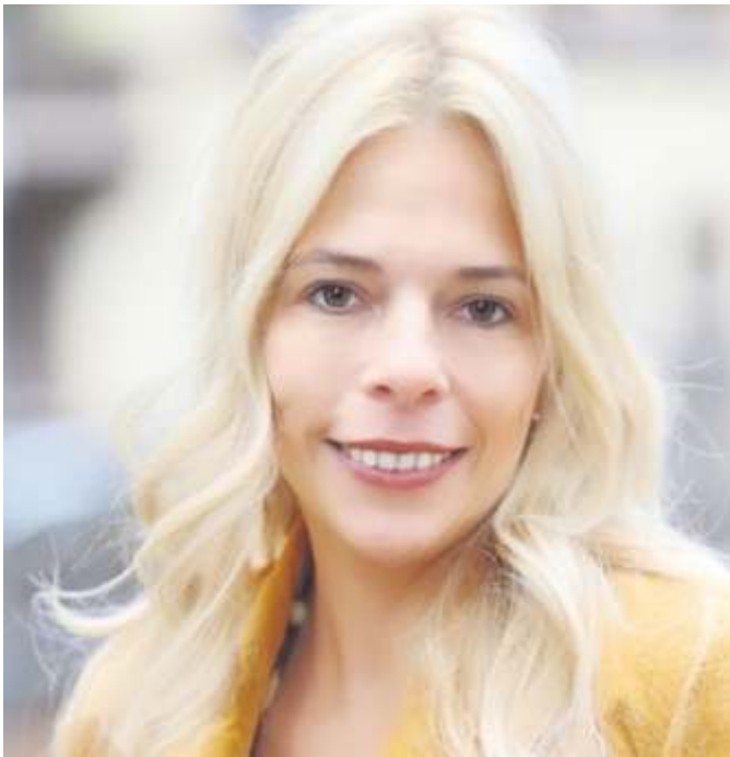
Am Donnerstag, 15. Juni, wird die Autorin Eva-Maria Bast aus ihrer Romanbiografie über das Leben der jungen Queen lesen.

schönste aller Büchereien gesucht wird. Auf die Gewinnerinnen und Gewinner wartet ein kleiner Preis. Die Bilderbuchshow beginnt um 15 Uhr, die Dauer beträgt 60 Minuten. Hierzu wird um eine telefonische Anmeldung unter Telefon 58 51-616 oder direkt in der Bücherei gebeten. Zusätzlich findet ab 15. Juni zu den Öffnungszeiten der Stadtteilbücherei ein Bücherflohmarkt zu Schnäppchenpreisen statt.