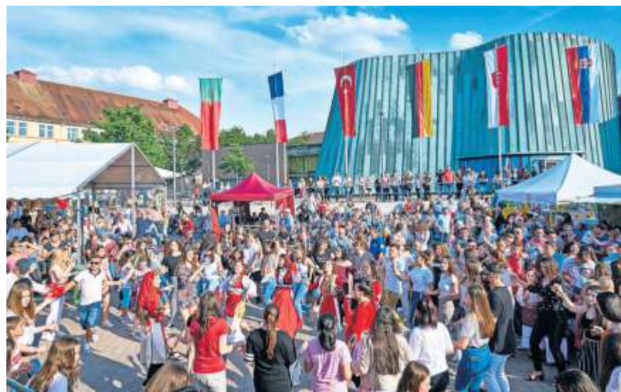
Treffpunkt der Kulturen – die Fiesta International.

Den Abschluss am Sonntag prägen Klänge und Tänze aus Südamerika, gestaltet vom Club Argentino Deportivo Stuttgart e.V. und Colombia Candela Tanz und Kultur e.V., Folklo-