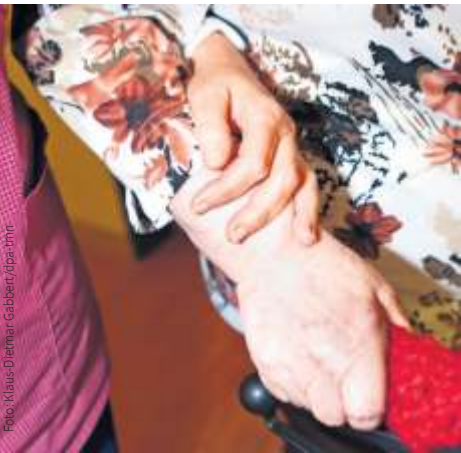
Helfende Hände werden gebraucht.

https://www.fsj-baden-wuerttemberg.de/einsatzstelle-finden