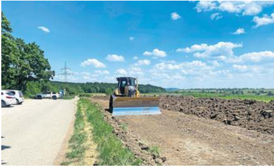
Die Vorbereitungen fürs Bodenmanagement laufen.