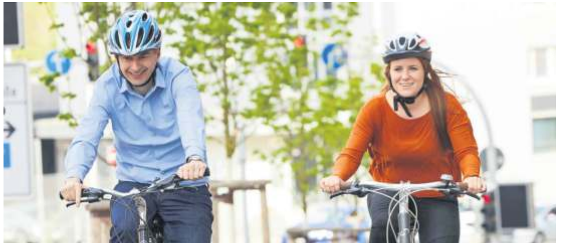
Über die Planungen zum stadtverträglichen Radschnellweg informiert die Stadtverwaltung am 20. Juni im Rathaus.

träglichen Lösung ausgebaut werden“, sind sich die Fachleute einig. Stadtverträglich heißt in diesem Zusammenhang, dass die Breite des Radweges bei 2,50 Meter liegt, ein Schutzstreifen zwei Meter umfasst, die nicht zurückgebaute Fahrspur der alten B14 mitgenutzt wird und dass die Wegeführung zusammen mit den Bürgern, den Einzelhänd-