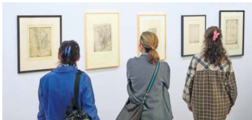
Bis 6. August sind die Arbeiten Wilhelm Lehmbrucks zu sehen.