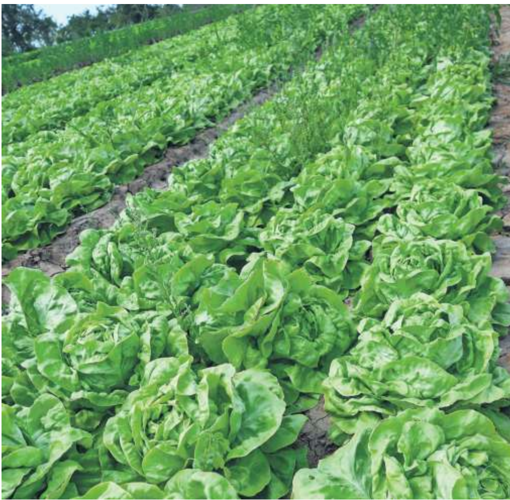
Salat vom Freiland: trotz der ergiebigen Regenfälle im Frühjahr ist die Erdkrume, auch durch den Wind der vergangenen Tage, schon so trocken, dass die Landwirte regelmäßig bewässern