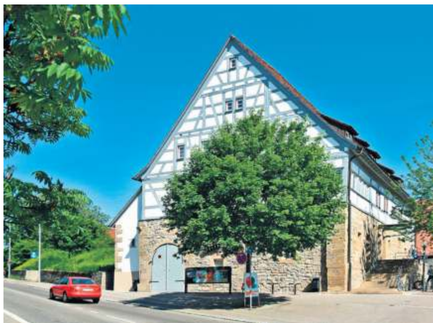
Seit 30 Jahren beherbergt das Große Haus die Stadtteilbücherei.

Zusätzlich findet ab Donnerstag, 15. Juni zu den Öffnungszeiten der Stadtteilbücherei ein Bücherflohmarkt, mit Kinderbüchern, Romanen und vielen Musik-CDs zu Schnäppchenpreisen statt.