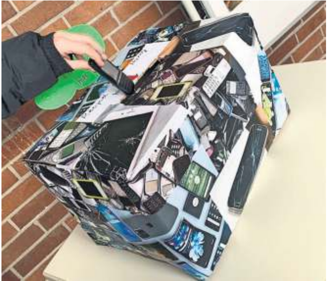
Ist das noch gut oder kann das weg, das alte Handy?

Eine Stellwand mit Informationen über die Herstellung und Produktion von Handys sowie eine große Sammelbox wurden von den Schülern gestaltet und zentral in der Schule aufgestellt. Gesammelt wurden nicht nur die Handys selbst, sondern auch Ladekabel und Kopfhörer. Die gesammelten Geräte wurden in den Fellbacher