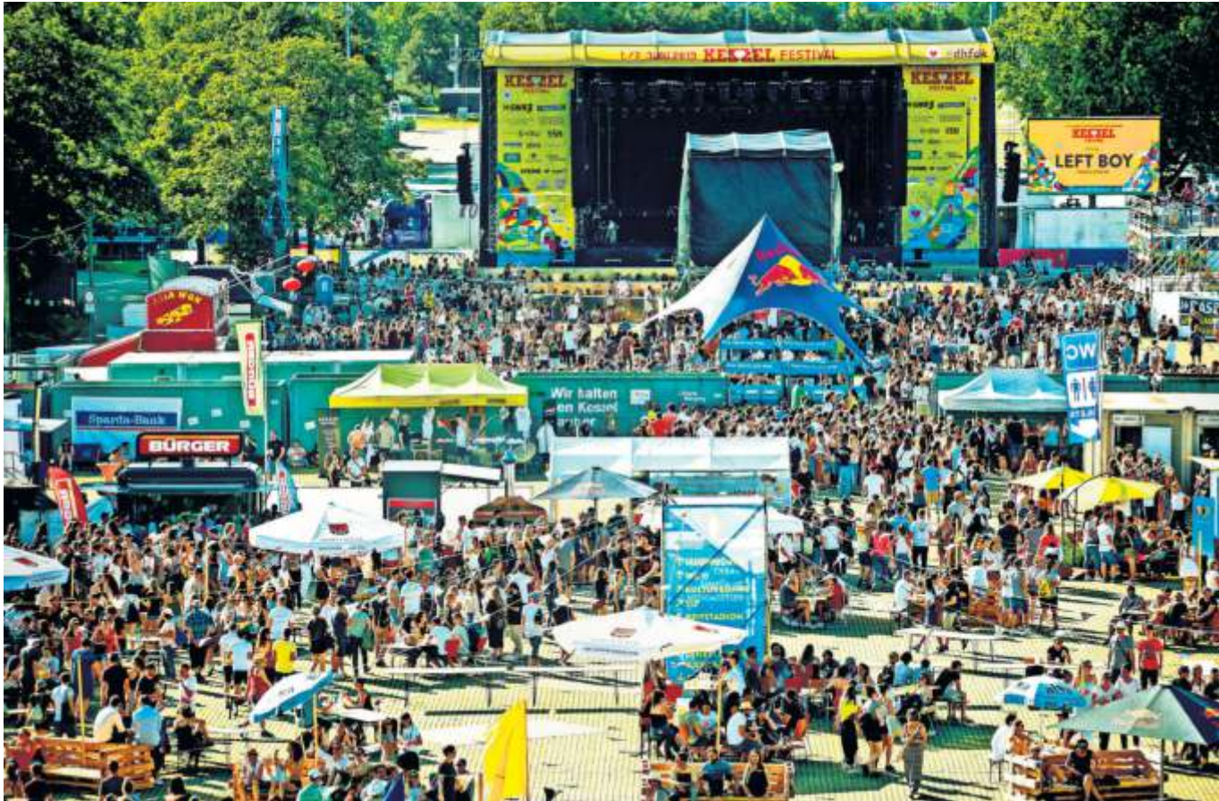
Musik, Kulinarisches, Unterhaltung und Nachhaltigkeit: Das Kessel Festival am 24. und 25. Juni bietet spannende Attraktionen und eine Vielzahl an Konzerten für Jung und Alt.

der Hauptbühne freuen, sondern ebenso auch auf aufstrebende Musikerinnen und Musiker auf der Kulturbühne sowie zahlreiche DJs. Auch ein Sportprogramm ist geboten, ebenso wird es den bereits etablierten Übermorgen-Markt geben, der nachhaltige Themen aufgreift. Die kleinen Gäste sind bestens versorgt im Bastelparadies, beim Mitmachzirkus, in der Verkleidungsbude oder an der Kinderschminkstation. Das Festivalgelände ist am Samstag von 11 bis 23 Uhr und am Sonntag von 11 bis 23 Uhr geöffnet. Die Gastronomie hat täglich bis 23 Uhr geöffnet. Alle Details gibt es online auf www.kessel-festival.de . Bunt und vielfältig: Das interkulturelle Stuttgarter Kinderfest richtet sich am Sonntag, 2. Juli, an alle kleinen Stuttgarterinnen und Stuttgarter. Angesagt ist ein Bühnenprogramm und zahlreiche Mitmachangebote von Stuttgarter Einrichtungen, Verbänden und Vereinen. Mehr dazu unter