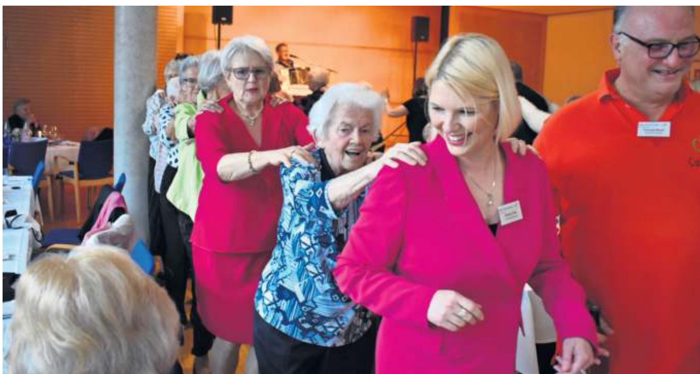
Bei der Jubiläumsfeier zum 25-jährigen Bestehen war die Stimmung hervorragend, es war ein fröhliches Fest.