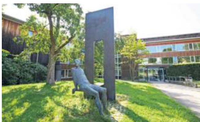
Das Haus Rohrer Höhe, das vor 25 Jahren in Betrieb ging, war das erste große Werk der Rudolf Schmid und Hermann Schmid Stiftung.