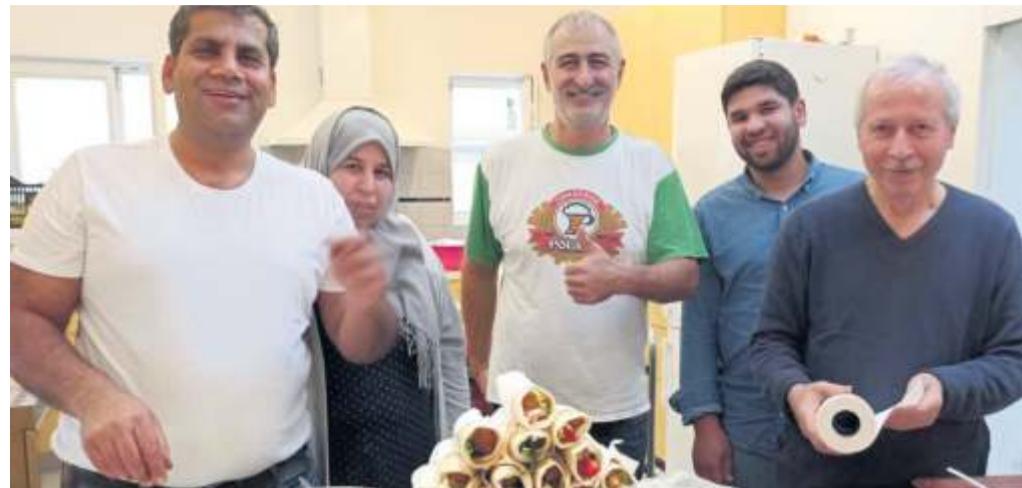
Das Team des Café Syria freut sich auf seine Gäste

Forum der Begegnung im Katholische Gemeindehaus St. Monika am 6. Mai