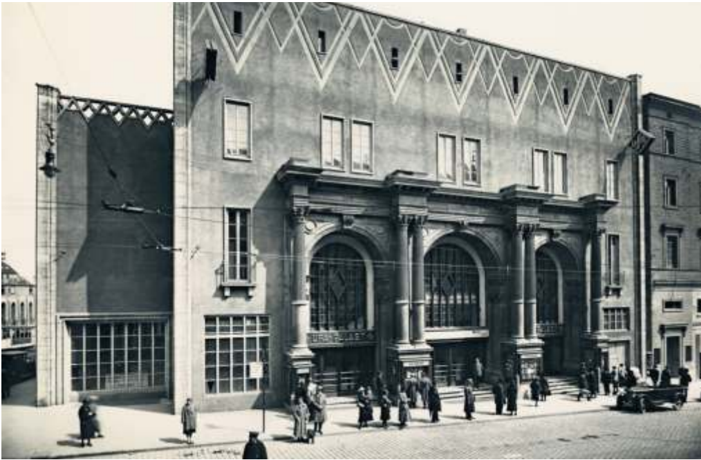
Das Metropol-Kino Mitte der Zwanzigerjahre: Die Säulen waren Überbleibsel des alten Bahnhofsgebäudes. Interessant ist die flache Fassade.